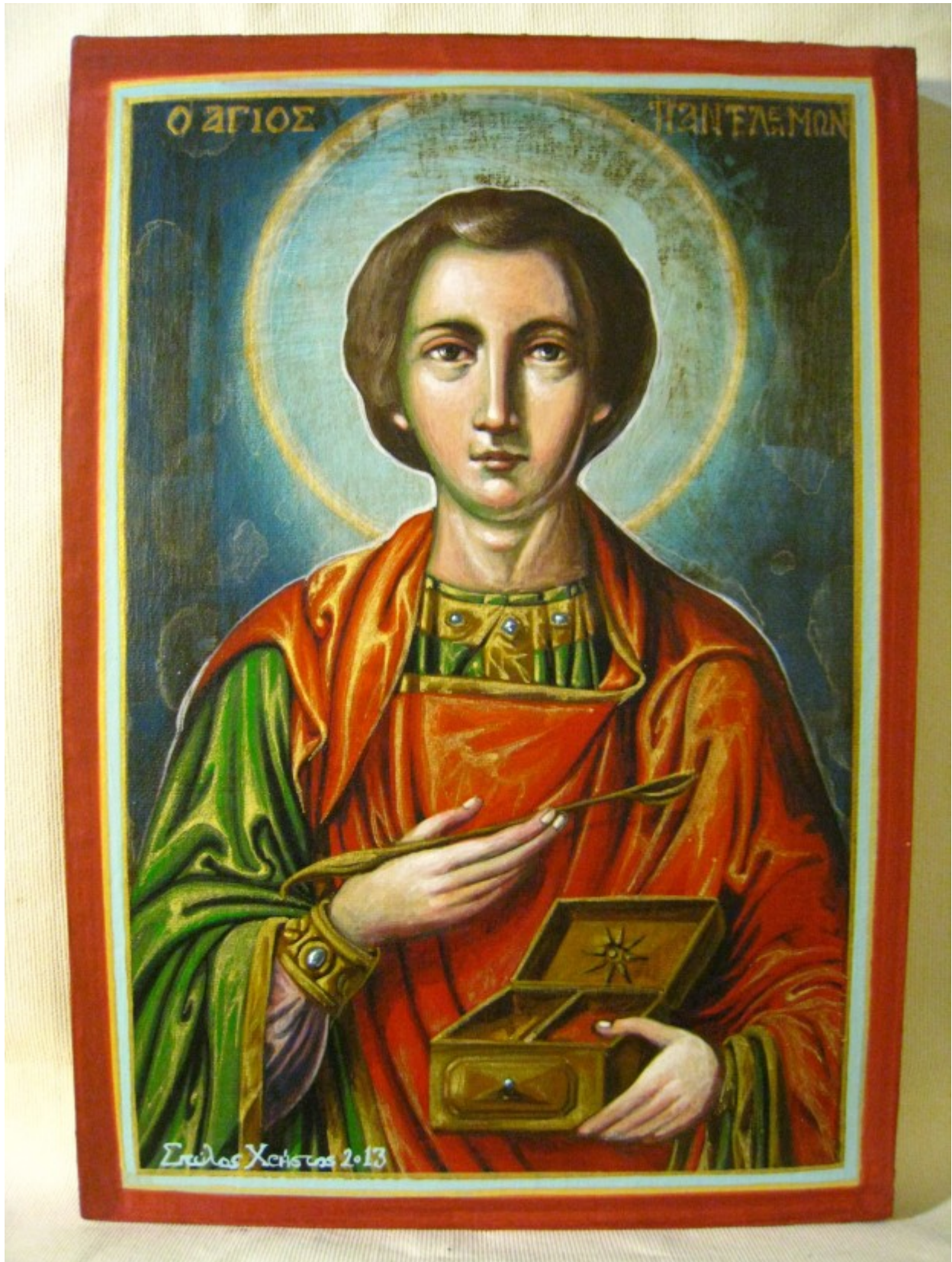
Άγιος Παντελεήμων ο Μεγαλομάρτυς και Ιαματικός - Χρυσός Στύλος ©