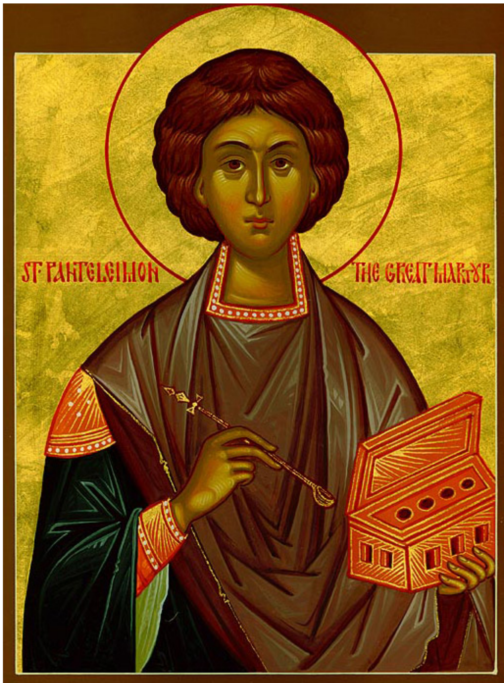
Άγιος Παντελεήμων ο Μεγαλομάρτυς και Ιαματικός