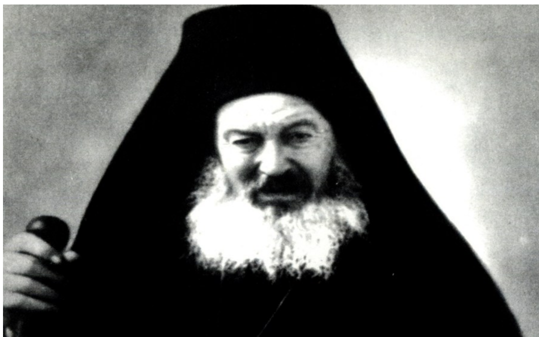
Ιερομόναχος Γαβριήλ († 1956)

Ημερονύκτιο δίχως όλη τη στιχολογία, το Θεοτοκάριο, τους Χαιρετισμούς, την Παράκληση της Παναγίας και της Αγίας Άννης η του Αγίου Γεωργίου δεν περνούσε. Μετά την ακολουθία δεν υπήρχε ανάπαυση. Ο Γέροντας έβαζε ανάγνωση και οι άλλοι ετοιμάζαν το φαγητό η την τράπεζα μέχρι να ξημερώσει και ν' αρχίσουν το εργόχειρο.