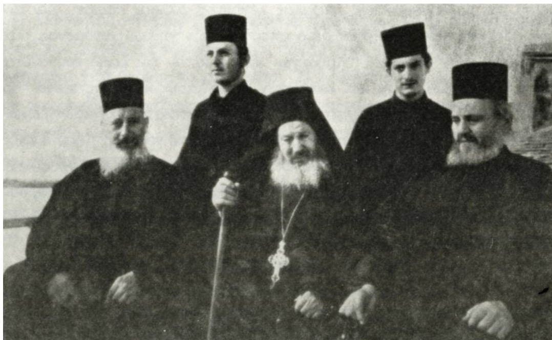
Η συνοδεία του Γέροντος Γαβριήλ

Ημερονύκτιο δίχως όλη τη στιχολογία, το Θεοτοκάριο, τους Χαιρετισμούς, την Παράκληση της Παναγίας και της Αγίας Άννης η του Αγίου Γεωργίου δεν περνούσε. Μετά την ακολουθία δεν υπήρχε ανάπαυση. Ο Γέροντας έβαζε ανάγνωση και οι άλλοι ετοιμάζαν το φαγητό η την τράπεζα μέχρι να ξημερώσει και ν' αρχίσουν το εργόχειρο.