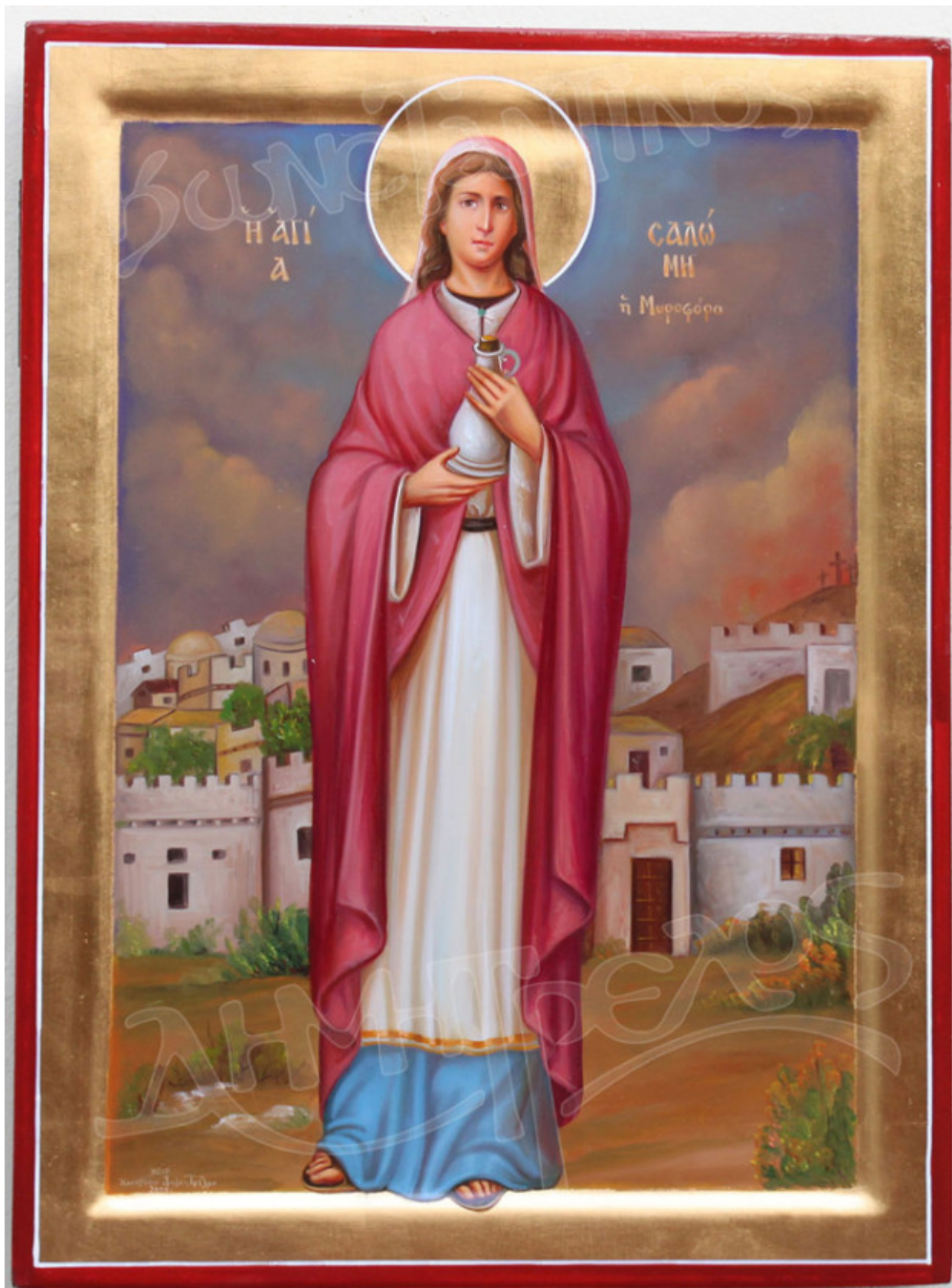
(Νέος Συναξαριστής της Ορθοδόξου Εκκλησίας, Αύγουστος, εκδ. Ίνδικτος σ. 29)