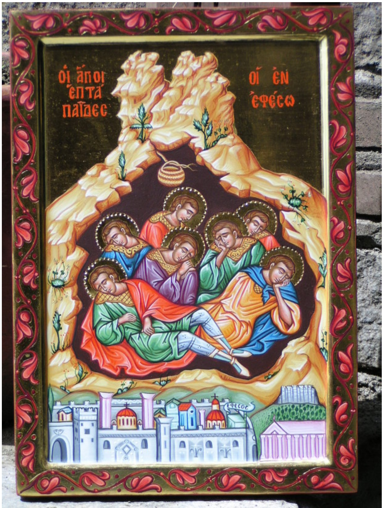
Ἅγιοι ἑπτὰ Παιδες εν Εφεσω