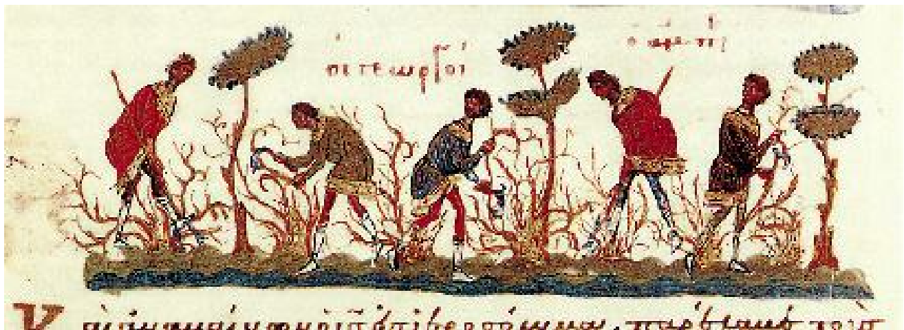
: Οι γεωργοί και η ἀμπελος. Μικρογραφία εικονογραφημένου χειρογράφου, 11ος αι. μ.Χ., Εθνική Βιβλιοθήκη Παρισίων.

(Γεωργίου Π. Πατρώνου, Ομοτ. Καθηγ. Παν/μίου Αθηνών, Κήρυγμα και Θεολογία, τ. Α΄, εκδ. Αποστ. Διακονία, σ.130-134)