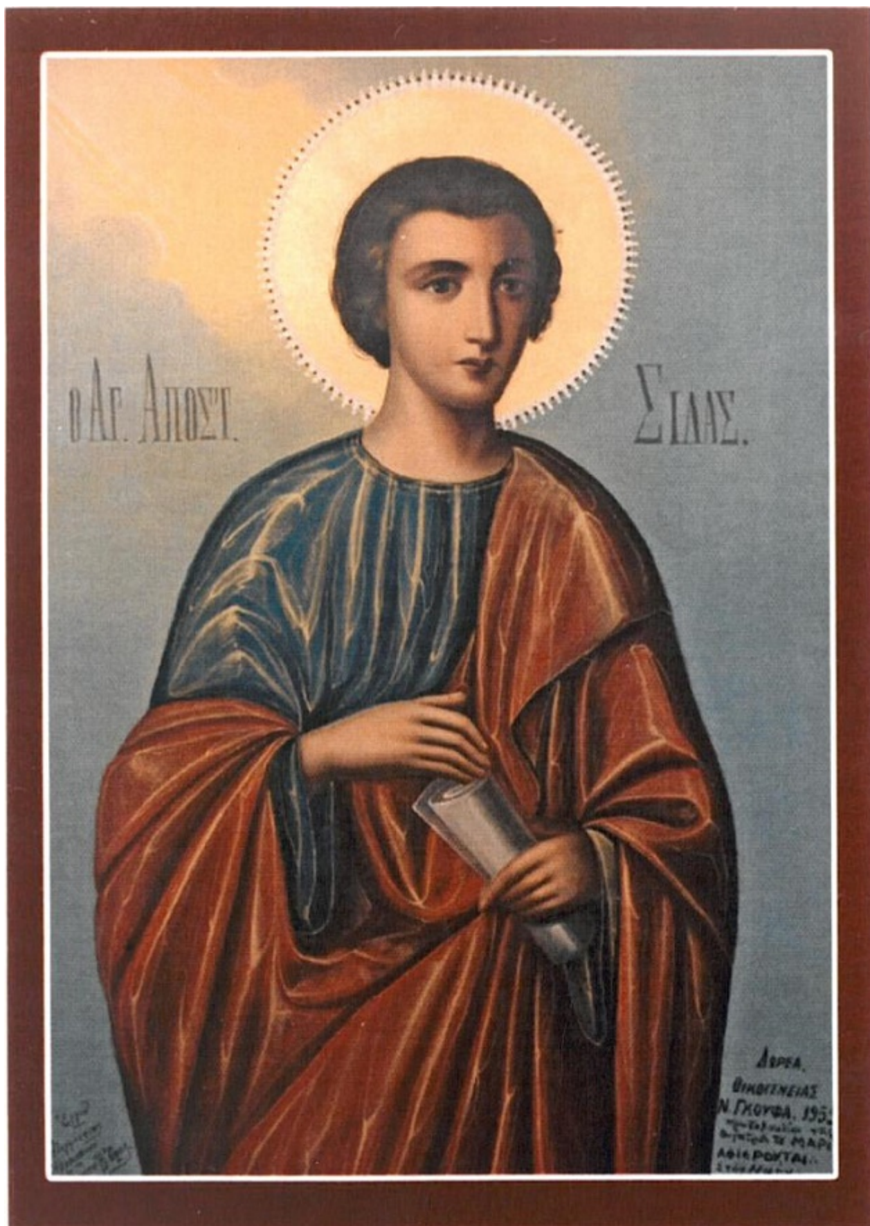
Ο απ. Σίλας , μαζί με τον απ. Ιούδα , ως απεσταλμένοι της Εκκλησίας της