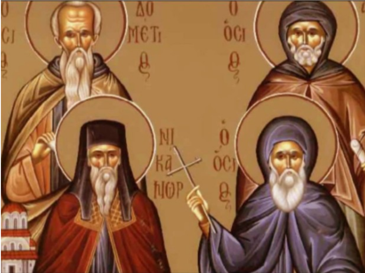
Άγιος Δομέτιος ο Πέρσης και οι δύο μαθητές του

Εορτάζει στις 7 Αυγούστου εκάστου έτους.