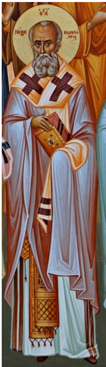
Άγιος Νήφων Πατριάρχης Κωνσταντινούπολης