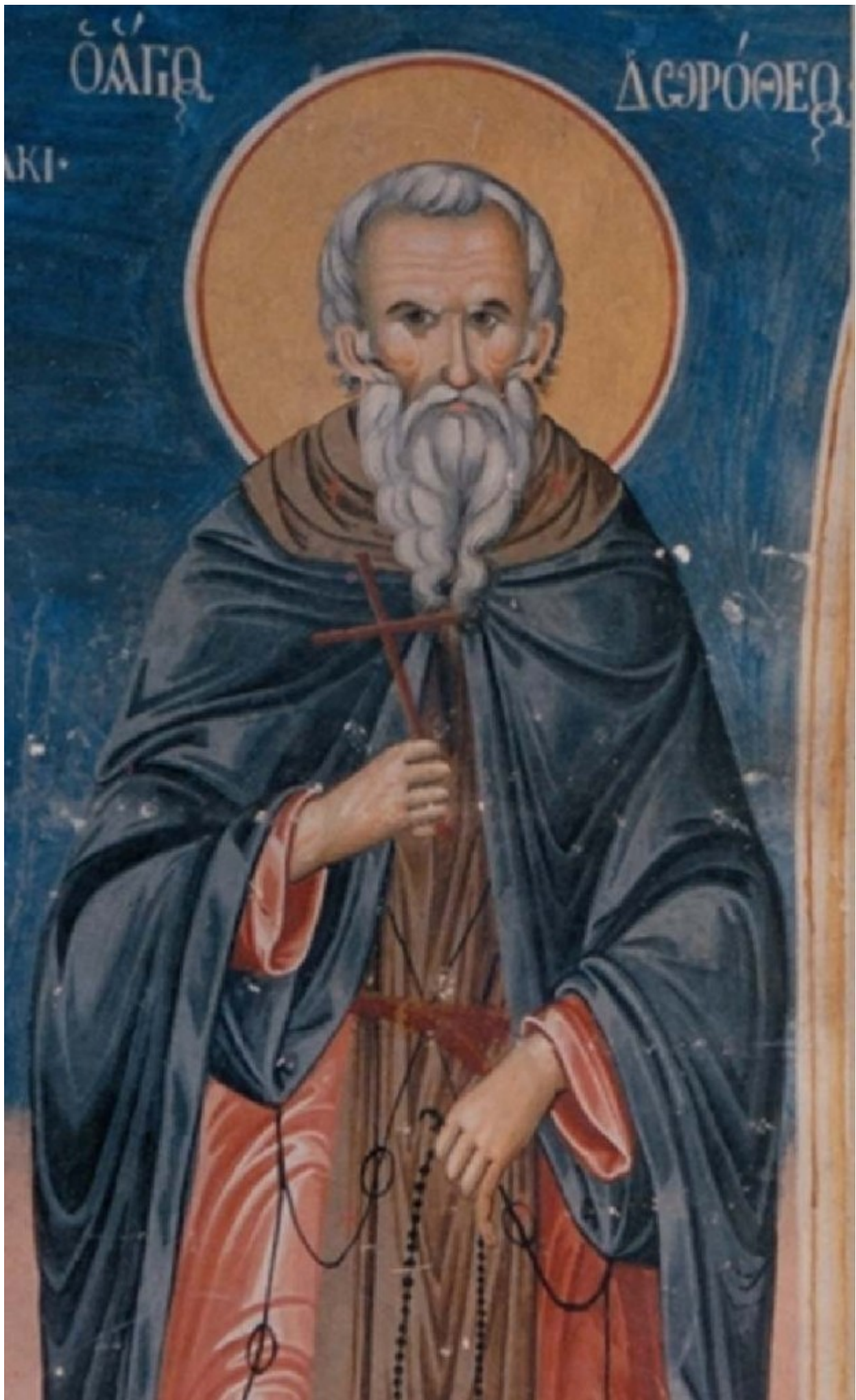
Όσιος (Αββάς) Δωρόθεος. Τοιχογραφία Λιτής Αγίου Νικολάου. έργο Γαλατσιάνων αγιογράφων 1802,