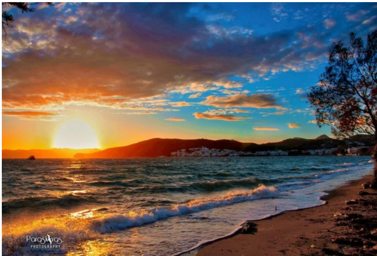
Ηλιοβασίλεμα στον κόλπο του Αδάμαντα

Ο Μήλος, σύμφωνα με τη μυθολογία, ήταν γιος του ποταμού Σκαμάνδρου που αποίκισε το νησί μετά από οδηγία της θεάς Αφροδίτης. Ήταν ένας όμορφος νέος που τον ερωτεύτηκαν οι τρεις Ολύμπιες θεές, Ήρα, Αθηνά και Αφροδίτη.