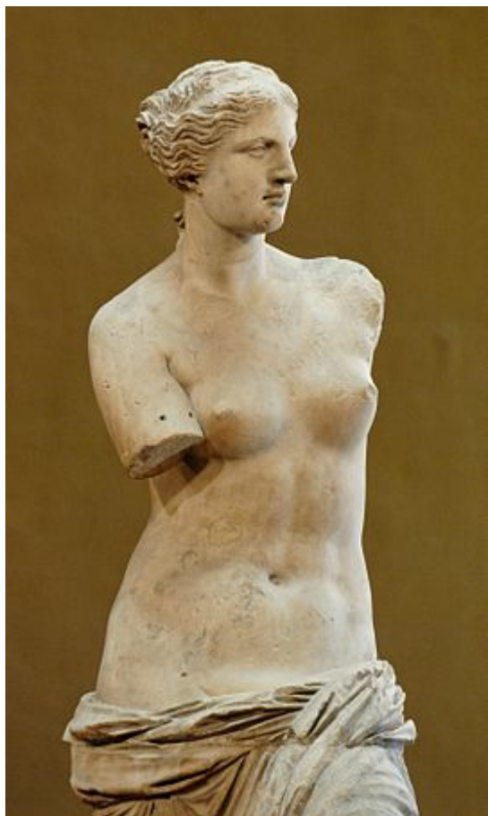
Αφροδίτη της Μήλου

Γνώρισα, όμως, τη Μήλο και την αγάπησα, όταν ο σύζυγός μου υπηρέτησε ως Διευθυντής της Εθνικής Τράπεζας στο νησί. Έζησα για κάποιους μήνες κι εγώ εκεί, και μετά τη Νίσυρο όπου έζησα για ένα χρόνο, υπηρετώντας ως φιλόλογος στο Λύκειο Νισύρου, η Μήλος κατέχει μια σημαντική θέση στην καρδιά μου.