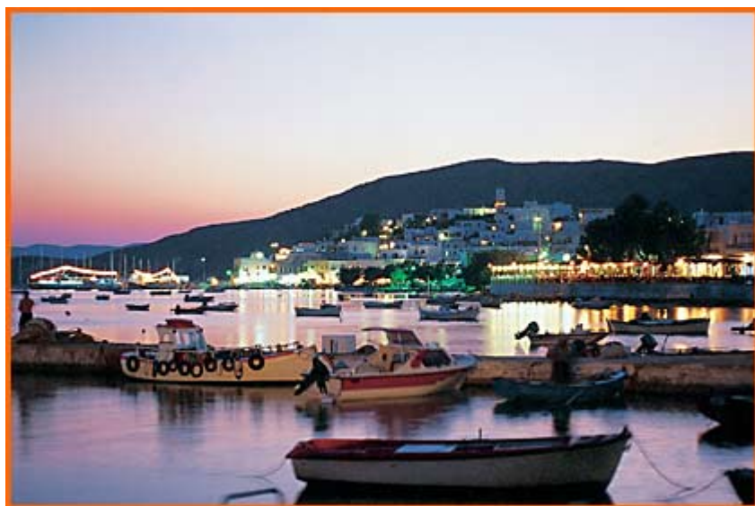
Το λιμάνι του Αδάμαντα

Τη Μήλο, το ηφαιστειακό αυτό νησί στις Δυτικές Κυκλάδες που έχει σχήμα πετάλου, το ήξερα από τα νεανικά μου χρόνια, όταν μαθαίναμε στην Αρχαιολογία για τον οψιδιανό των προϊστορικών χρόνων και τη Φυλακωπή,