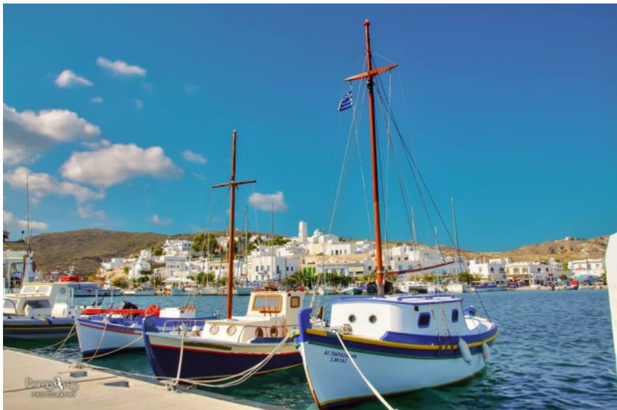
Το λιμάνι του Αδάμαντα

Έτσι, δημιουργήθηκε η έρις μεταξύ τους, γι' αυτό κάλεσαν τον Πάρη που πρόσφερε το μήλο στην Αφροδίτη, «τη καλλίστη».