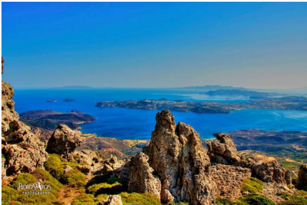
Από τον Προφήτη Ηλία

ευμετάβλητη τον χειμώνα, άλλοτε αγριεμένη κι άλλοτε αναπάντεχα ηλιόλουστη, μαυλίζει τους λιγοστούς τυχερούς επισκέπτες με το καθαίο φως της.