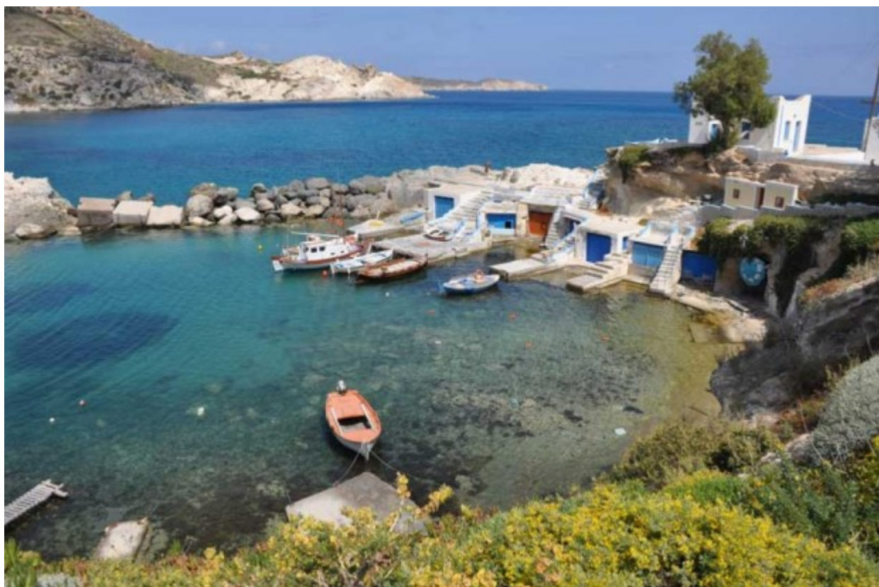
Τα αγαπημένα μου Μαντράκια