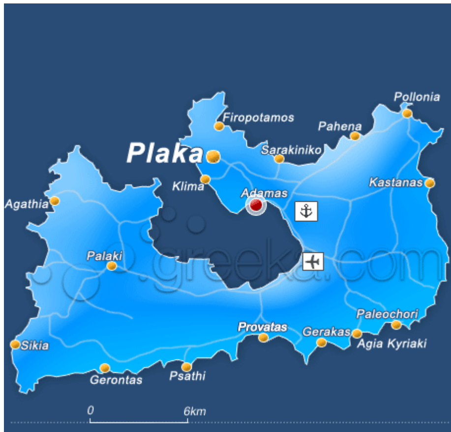
Χάρτης της Μήλου

Φέτος, ταξιδέψαμε για τη Μήλο στις αρχές Ιουλίου, 4-9 Ιουλίου. Το Αιγαίο πέλαγος ήταν λιγάκι ανταριασμένο. Το καταμαράν κλυδωνιζόταν στα κύματα.