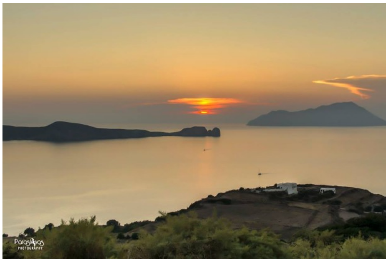
Ηλιοβασίλεμα στη Μήλο

Φτάσαμε στη Μήλο μας Σάββατο απομεσήμερο. Το λιμάνι λέγεται Αδάμαντας.