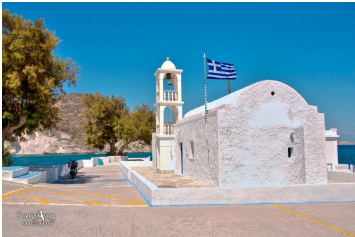
Η εκκλησία της Ζωοδόχου Πηγής

«Θεέ μου, τι μπλε ξοδεύεις για να μη σε βλέπουμε» Ο. Ελύτης