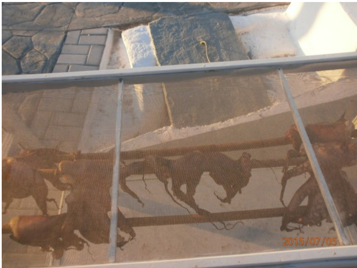
Χταπόδια σε ειδική θήκη έξω από το μεζεδοπωλείο