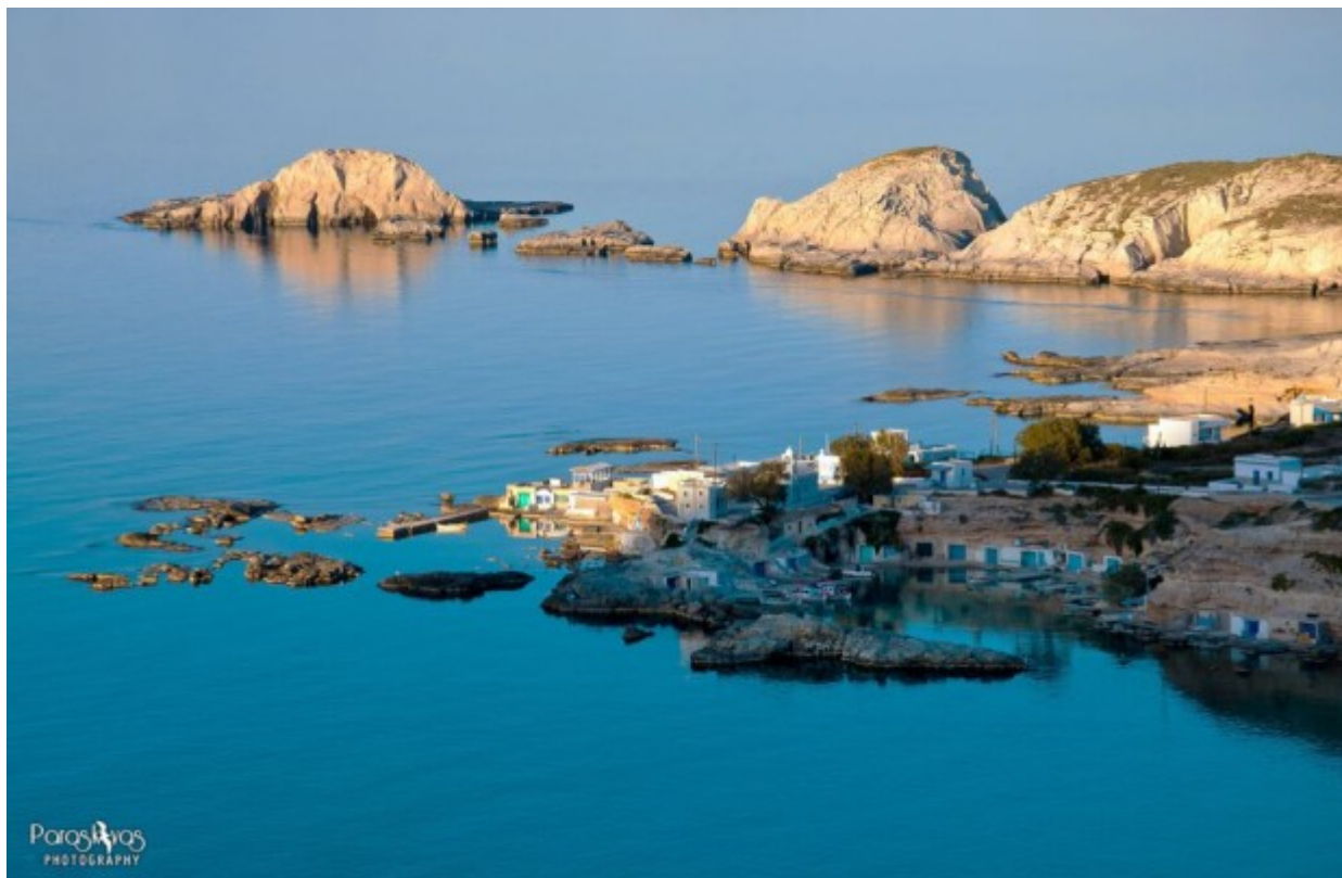
Τα πολυαγαπημένα μου Μαντράκια