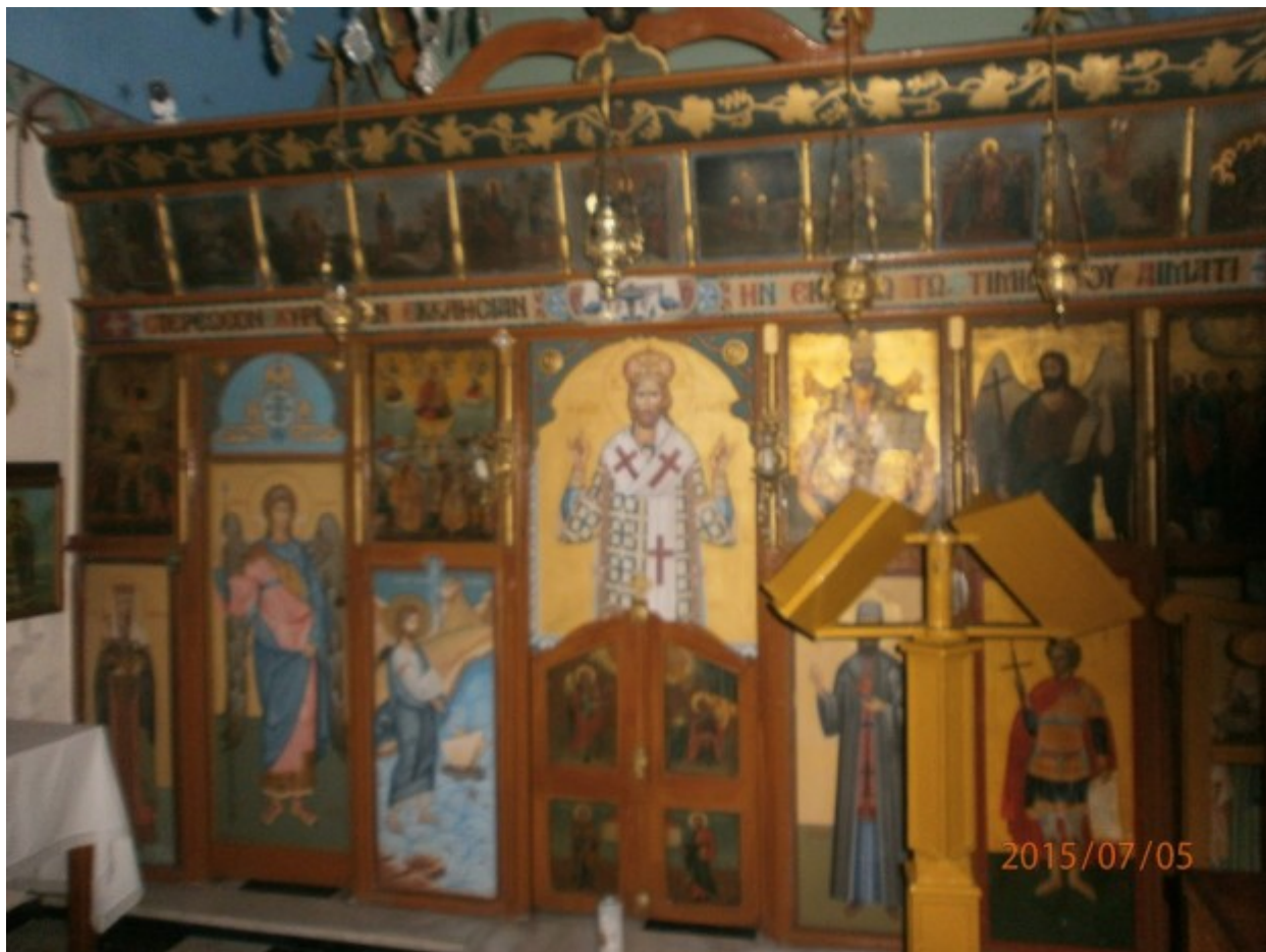
Το εσωτερικό της εκκλησίας της Ζωοδόχου Πηγής