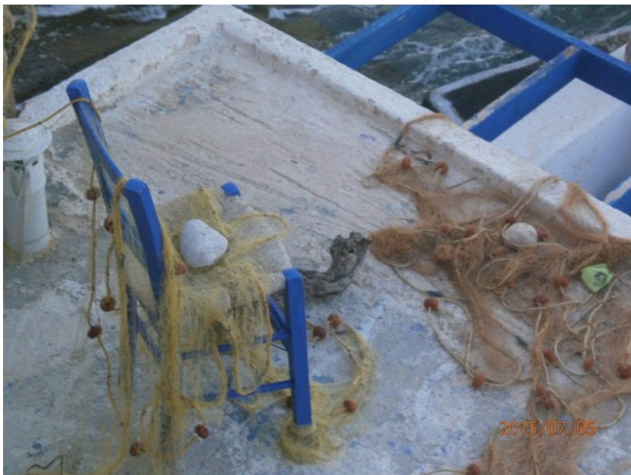
Τα δίκτυα του ψαρά