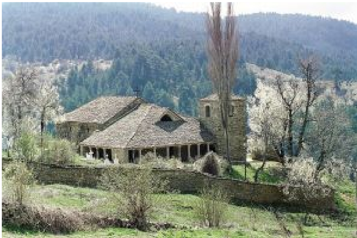
Ναός Αγίου Γεωργίου Σίψκα (Υπισχίας)

Ο Ναός Αγίου Γεωργίου Σίψκα (Υπισχίας) βρίσκεται στην είσοδο του ομώνυμου χωριού το οποίο βρίσκεται 5 χλμ μακριά από την Μοσχόπολη ( 25 χλμ από την Κορυτσά). Κτίστηκε το 17 αιώνα και ανήκει στην ομάδα των βασιλικών ναών της Μοσχοπόλεως. Ο ναός είναι τρίκλιнос Βασιλικός με σύστημα κάλυψης αποτελούμενο από καμάρες, θόλους και τόξα. Δύο σειρές από κίονες και χωρίζουν τον κύριο ναό σε τρεις κλίτες. Ο ναός του Αγίου Γεωργίου έχει τοιχογραφηθεί κατά τον 17 αι. Ένας χώρος του ναού στην νότια πλευρά, έχει αφιερωθεί στον Όσιο Ναούμ. Αυτός είναι ένας χώρος του ναού που προστέθηκε αργότερο. Το παρεκκλήσι του Οσίου Ναούμ έχει αγιογραφηθεί τον 18 αιώνα.