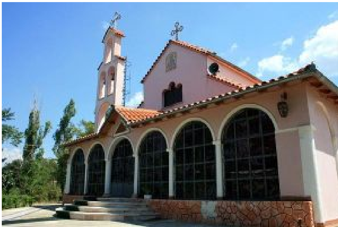
Ναός Αγίου Αθανασίου

Ο Ναός βρίσκεται στην Μοσχόπολη Κορυτσάς, 21 χλμ από την πόλη της Κορυτσάς, στην νοτιοανατολική πλευρά της Αλβανίας. Έχει κτιστεί πάνω σε λόφο. Είναι τυπικός ναός της μεταβυζαντινής περιόδου. Μερικές επιγραφές στα Ελληνικά στην νότια πλευρά, δείχνουν πως έχει κτιστεί το 1724 από αρχιτέκτονες της πόλης Κριμέα, δίπλα στην Καστοριά. Διακρίνεται για την εξωτερική διακόσμηση με κεραμικά και με χρωματιστές πέτρες που έχουν εισαχθεί στο τοίχο. Η εξωτερική στοά, αποτελείται από τόξα και σε οδηγεί στο εξωτερικό του ναού μια πόρτα που βρίσκεται νότια. Η επτάγωνη είσοδος του ναού παρουσιάζει πέτρινο τοίχοδομιά. Διακοσμημένες ασίδες σχεδιασμένες με μοτίβα πτηνών και φυτών.