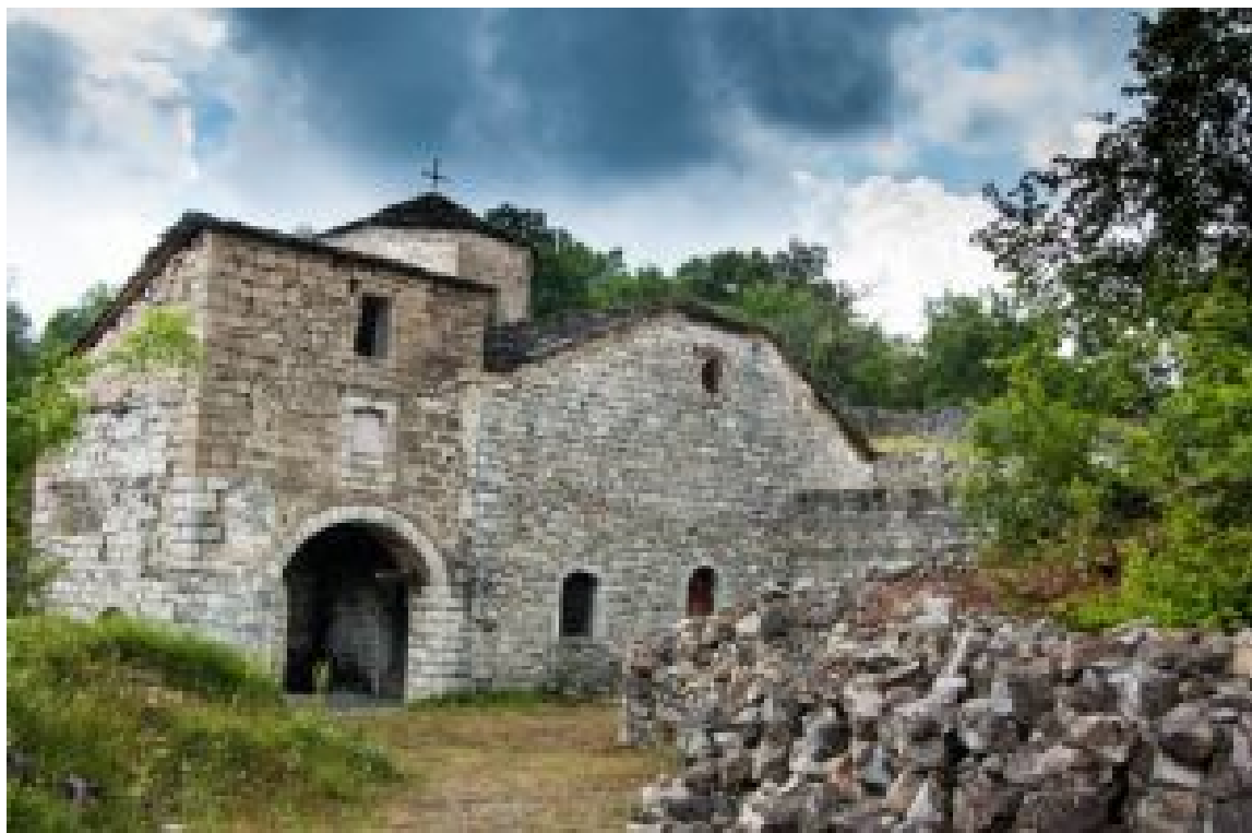
Η Ιερά Μονή Αγίου Αποστόλου Πέτρου στο Βυθκούκι Κορυτσάς