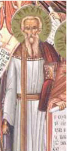
Άγιος Αμμούν ο Διδάσκαλος