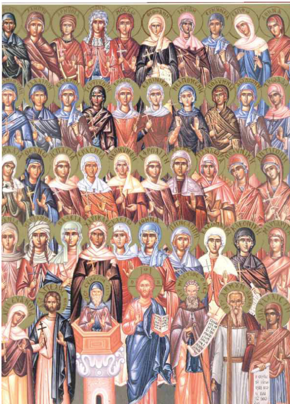
Αγίες Τεσσαράκοντα Παρθένες και Ασκήτριες και Αμμούν ο διδάσκαλος αυτών