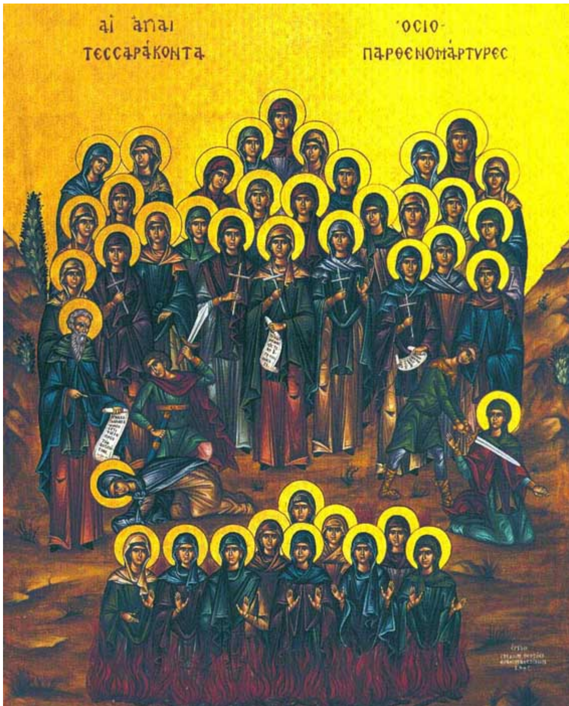
Ἄγιες Τεσσαράκοντα Παρθένες και Ἀσκήτριες και Ἀμμούν ο διδάσκαλος αὐτῶν

Εορτάζει στις 1 Σεπτεμβρίου εκάστου ἔτους.