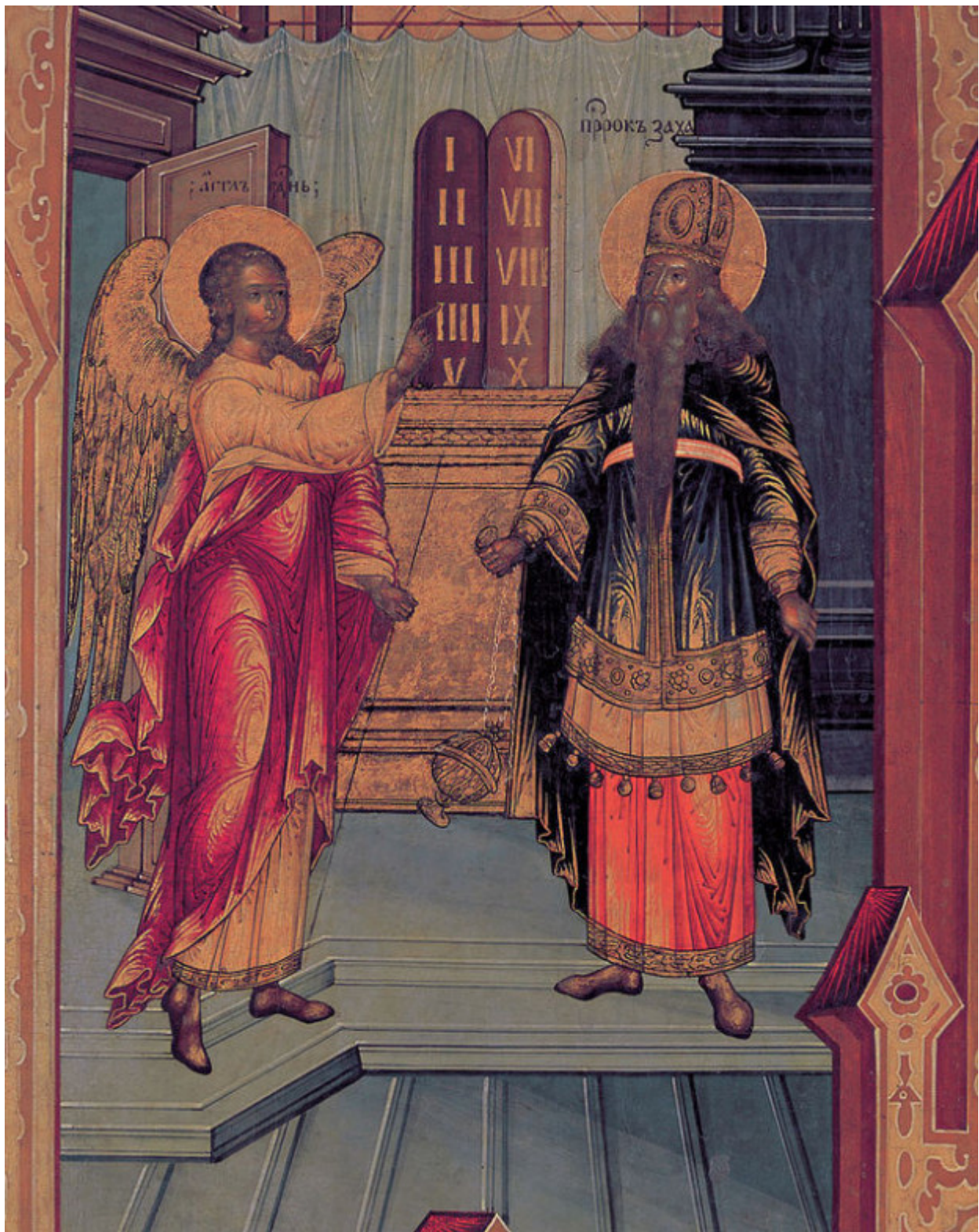
Ο ευαγγελισμός του Ζαχαρία