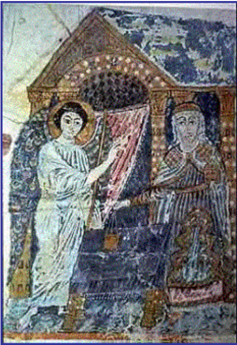
Ο ευαγγελισμός του Ζαχαρία - Μικρογραφία από αρχαίο αρμενικό χειρόγραφο