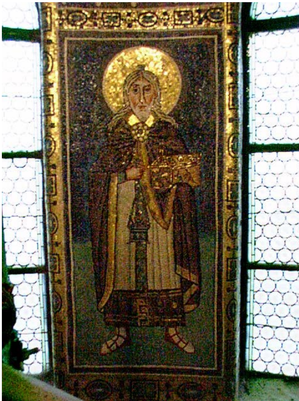
Προφήτης Ζαχαρίας - Ψηφιδωτό του 6ου αιώνα μ.Χ. στην βυζαντική βασιλική του Ευφράσιου στο Porec της Κροατίας