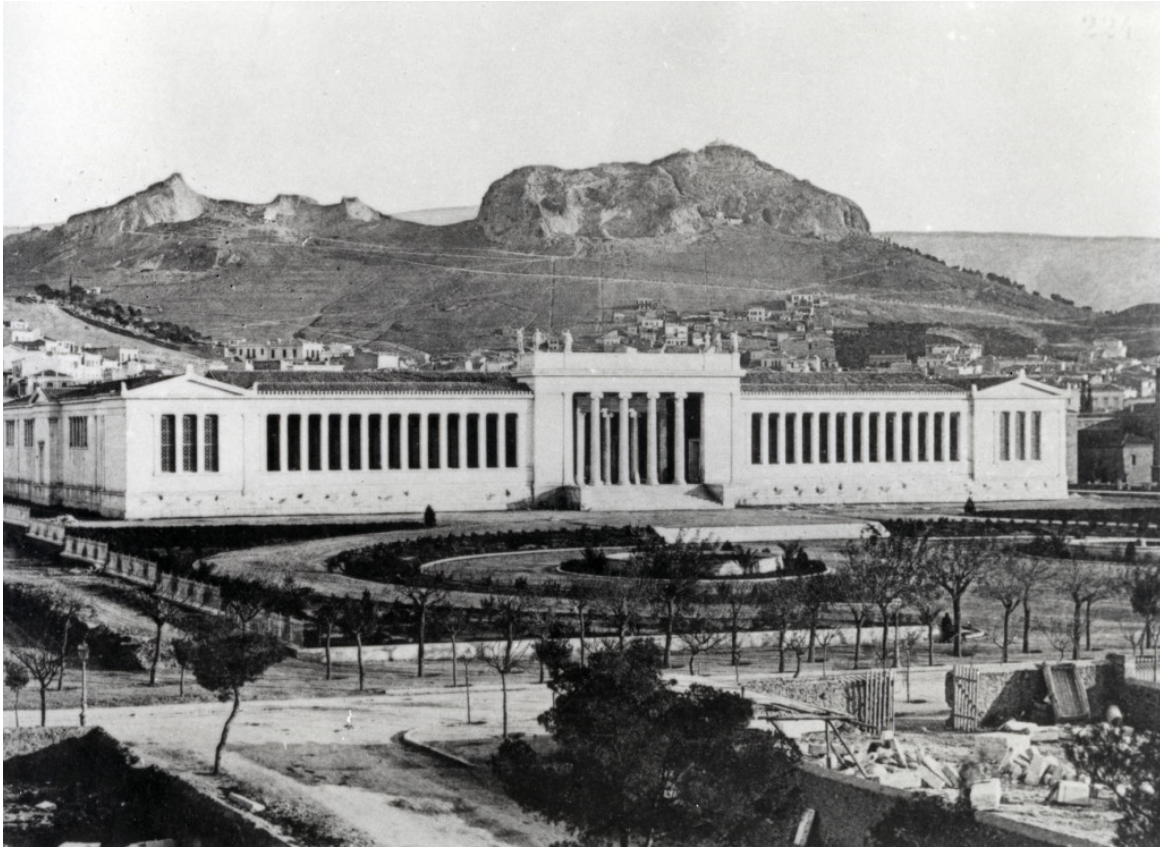
Αποψη του Εθνικού Αρχαιολογικού Μουσείου μετά την αποπεράτωσή του

της έκθεσης των Περιηγητών και περιλαμβάνει μια ιδιαίτερη εκθεσιακή εγκατάσταση, που φιλοδοξεί να μεταφέρει τους επισκέπτες στα πρώτα χρόνια της λειτουργίας του Μουσείου.