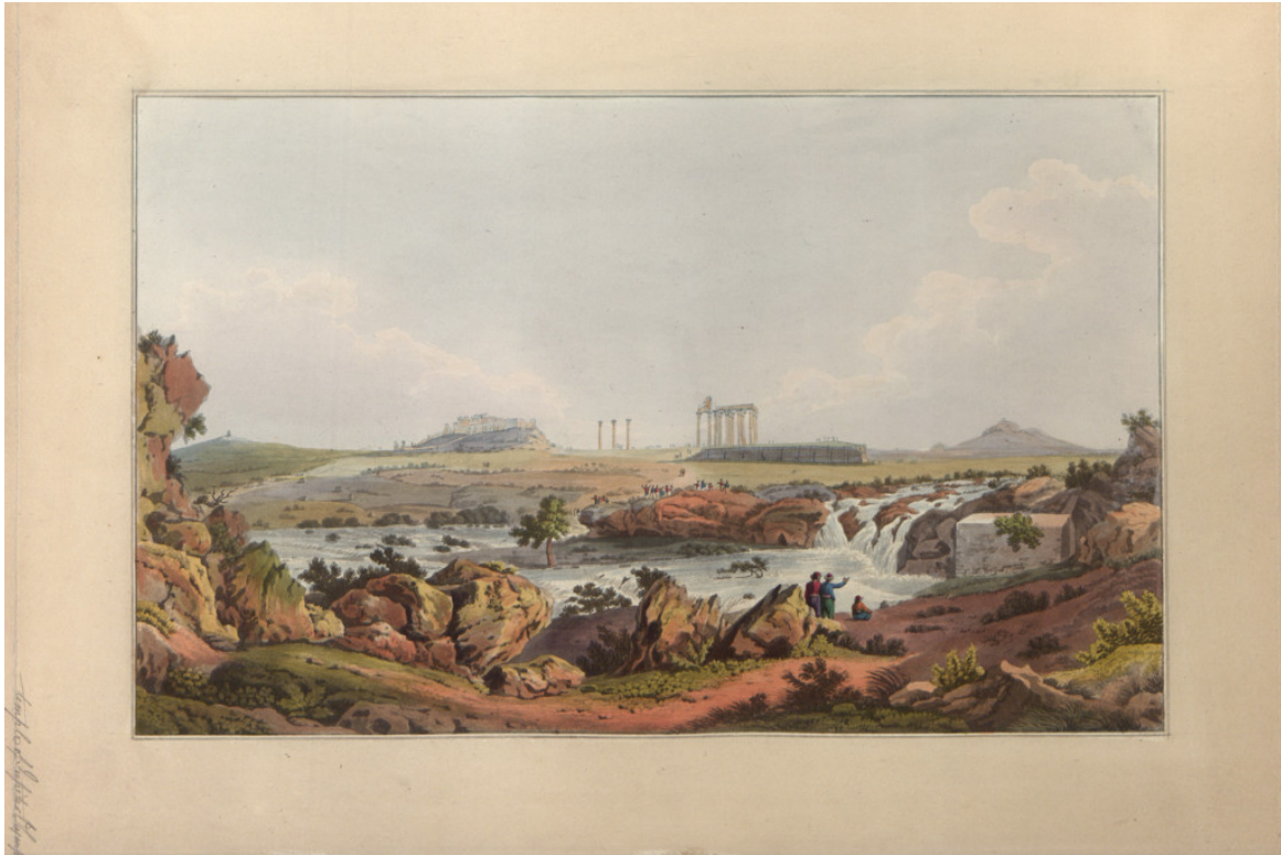
Ο ναός του Ολυπίου Διός και ο ποταμός Ιλισσός από το βιβλίο του Edward Dodwell, Views in Greece , London 1821 (Βιβλιοθήκη της Βουλής των Ελλήνων, αρ.κατ. ΣΒΞ (f)ΠΕΡ 1821 VIE)

κλασικισμού, αποτυπώνουν τα «υπέροχα ερείπια» του ιστορικού της παρελθόντος.