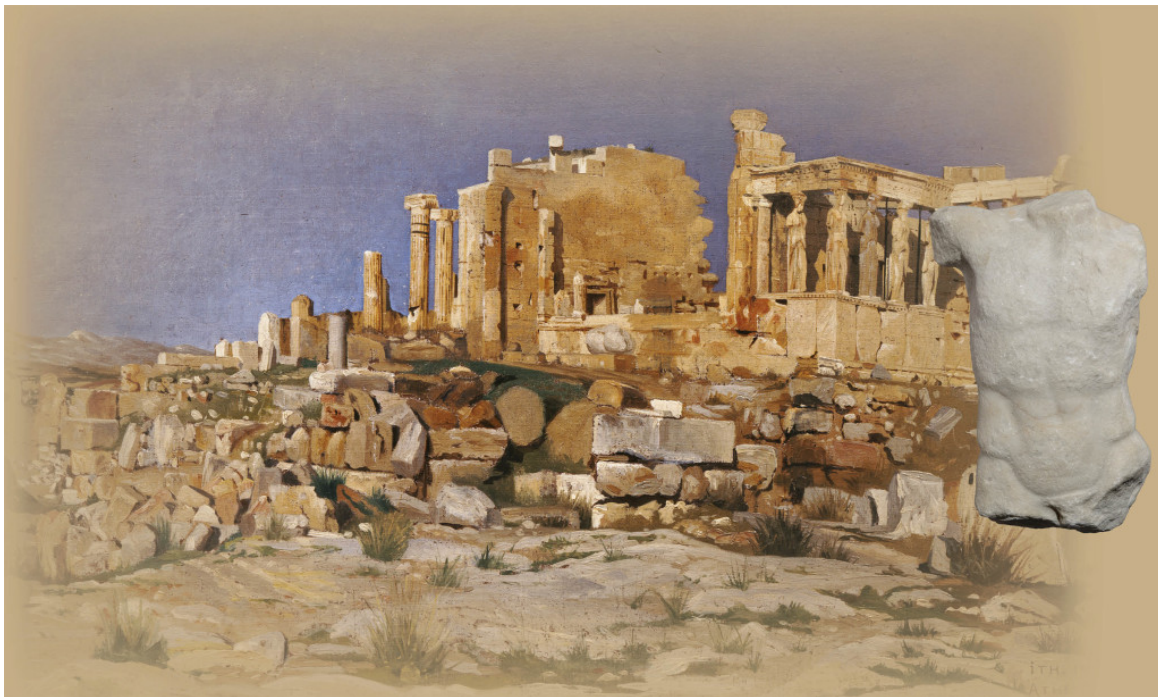
Φωτογραφική σύνθεση της ελαιογραφίας του Josef Theodor Hansen που απεικονίζει το Ερεχθείο, 1881 (Βιβλιοθήκη της Βουλής των Ελλήνων αρ.κατ.337) και του μαρμάρινου ανδρικού κορμού που αποδίδεται στη ζωφόρο του ίδιου μνημείου (αρ.κατ. ΕΑΜ Γ 15485).

Την επέτειο των 150 χρόνων από τη θεμελίωσή του, γιορτάζει το 2016, το Εθνικό Αρχαιολογικό Μουσείο. Προάγγελο των εκδηλώσεων και εκθέσεων που θα γίνουν με αφορμή αυτήν την επέτειο, αποτελεί η έκθεση «Ένα όνειρο ανάμεσα σε υπέροχα ερείπια... Περίπατος στην Αθήνα των περιηγητών, 17ος- 19ος αιώνας», την οποία θα εγκαινιάσει την ερχόμενη Δευτέρα 7 Σεπτεμβρίου η Πρωθυπουργός Βασιλική Θάνου, παρουσία της αναπληρωτού Υπουργού Πολιτισμού Μαρίνας Λαμπράκη-Πλάκα