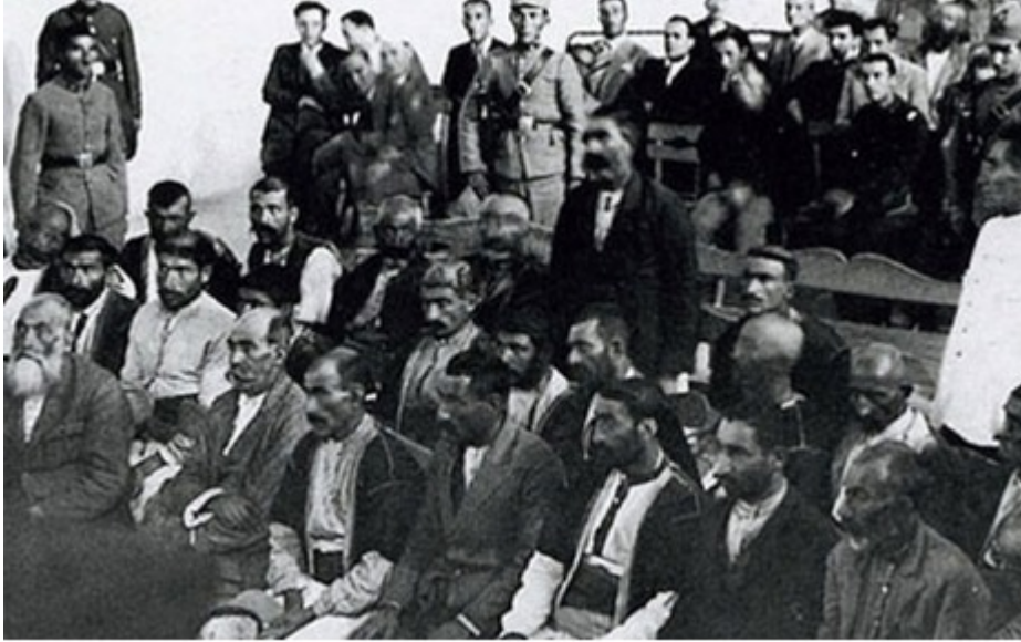
Εικόνα από τα Δικαστήρια Ανεξαρτησίας

του μαρτυρικού Πόντου, με εντολή του Κεμάλ συστήνονται τα περιβόητα Δικαστήρια Ανεξαρτησίας (İstiklâl Mahkemeleri), στα οποία δικάζονται με συνοπτικές διαδικασίες και οδηγούνται στην αγχόνη οι πιο σημαντικοί Έλληνες, η πνευματική και οικονομική ηγεσία των πόλεων και των κοινοτήτων του Πόντου.