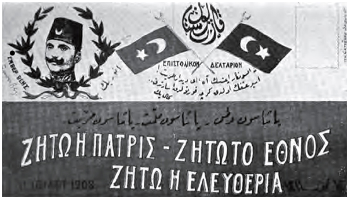
Ταχυδρομικό δελτάριο των Νεότουρκων στα ελληνικά

Οι λεπτομέρειες αυτού του αποτρόπαιου σχεδίου, που σημειώνεται ότι σχεδιάστηκε εν ψυχρώ και όχι κατά τη διάρκεια πολεμικών γεγονότων, συζητείται στα μυστικά συνέδρια των Νεοτούρκων που διεξάγονται στη Θεσσαλονίκη το 1908, 1909, 1910 και 1911, και προβλέπει την απομάκρυνση όλων των χριστιανικών πληθυσμών, ήτοι Ελλήνων, Αρμενίων και Ασσυρίων από τα εδάφη της Μικράς Ασίας ακόμα και με τη χρήση βίας, για να δημιουργηθεί εκεί το νέο τουρκικό κράτος, το οποίο θα κατοικείται αποκλειστικά από Τούρκους και μουσουλμάνους.