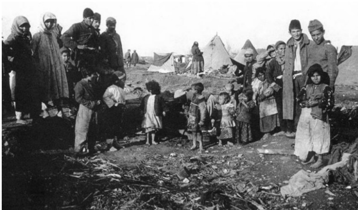
Η εκκένωση της Θράκης

Το σχέδιο αρχίζει να τίθεται σε εφαρμογή στα τέλη του 1913 και το 1914, με τον Μεγάλο Διωγμό, οπότε, παραμονές του Α΄ Παγκοσμίου Πολέμου -υποτίθεται για «λόγους ασφαλείας»-, υπό την καθοδήγηση των συμμάχων Γερμανών, εκτοπίζονται και χάνουν τη ζωή τους πολλές δεκάδες χιλιάδες Έλληνες της Θράκης και των παραλίων.