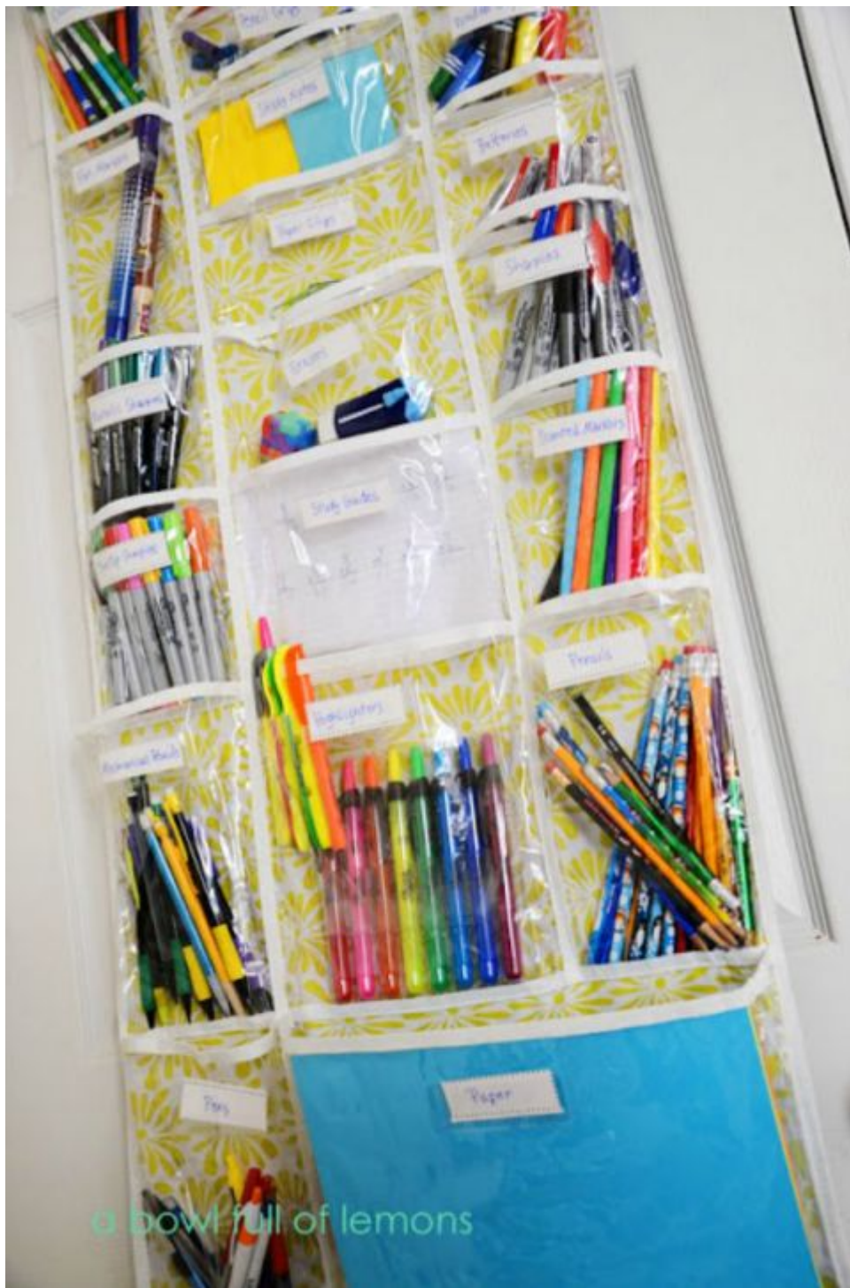
a bowl full of lemons