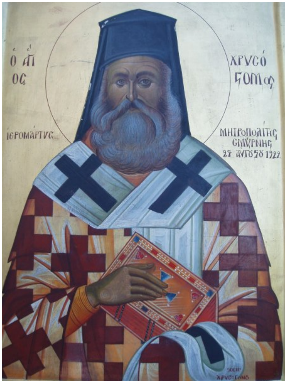
Άγιος Χρυσόστομος Σμύρνης