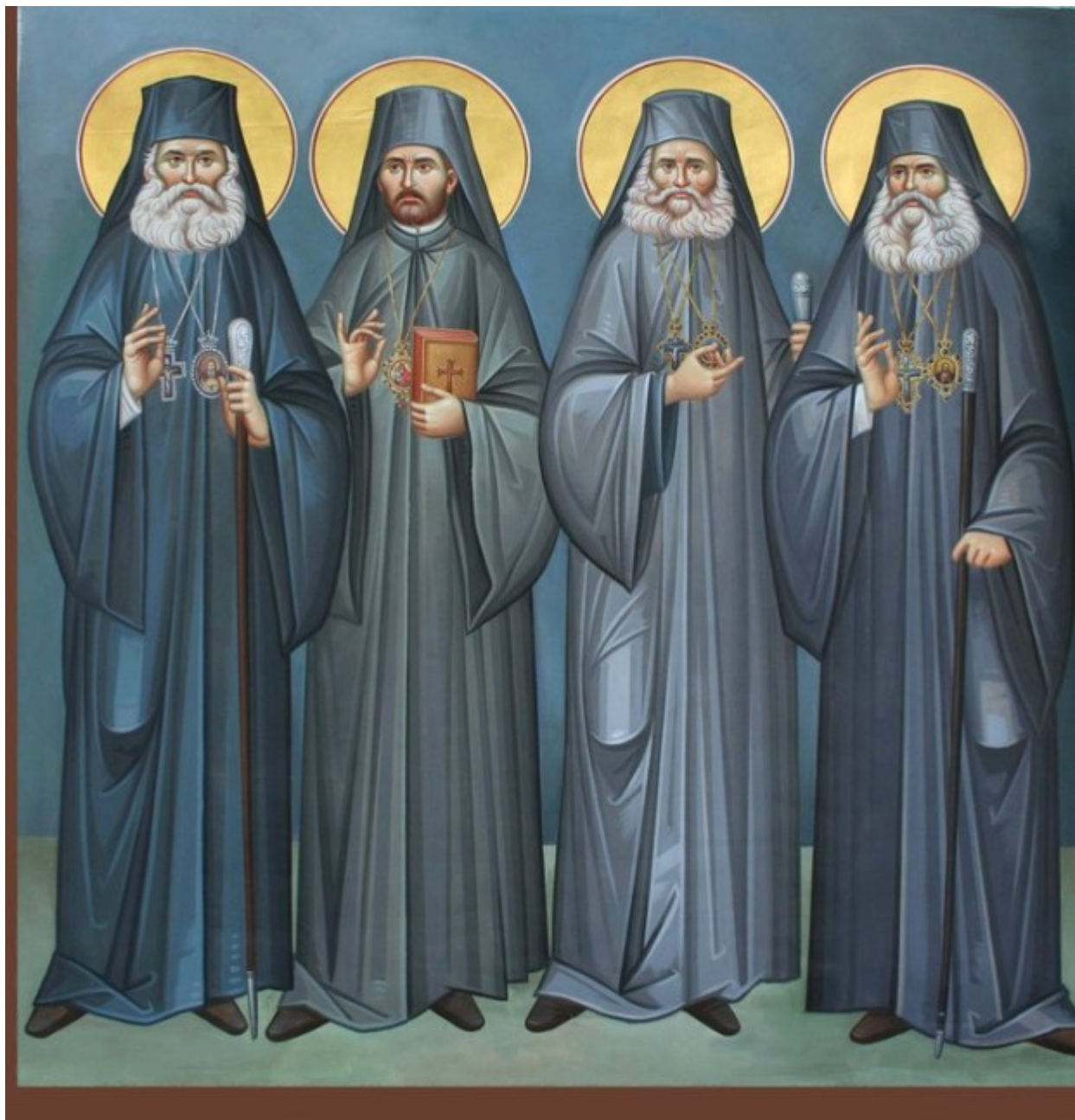
Άγιοι Αρχιερείς Προκόπιος Ικονίου, Γρηγόριος Κυδωνιών, Αμβρόσιος Μοσχονησίων, Ευθύμιος Ζήλων