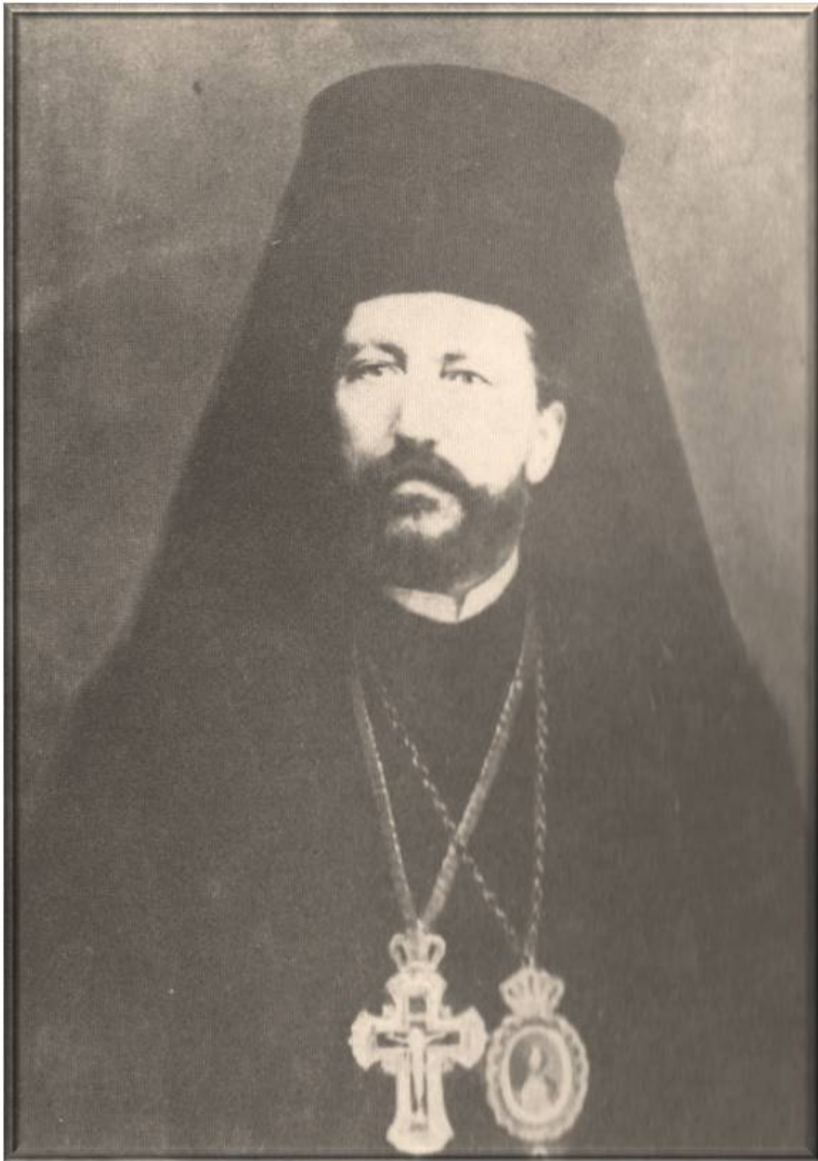
Άγιος Ευθύμιος ο Ιερομάρτυρας Επίσκοπος Ζήλων