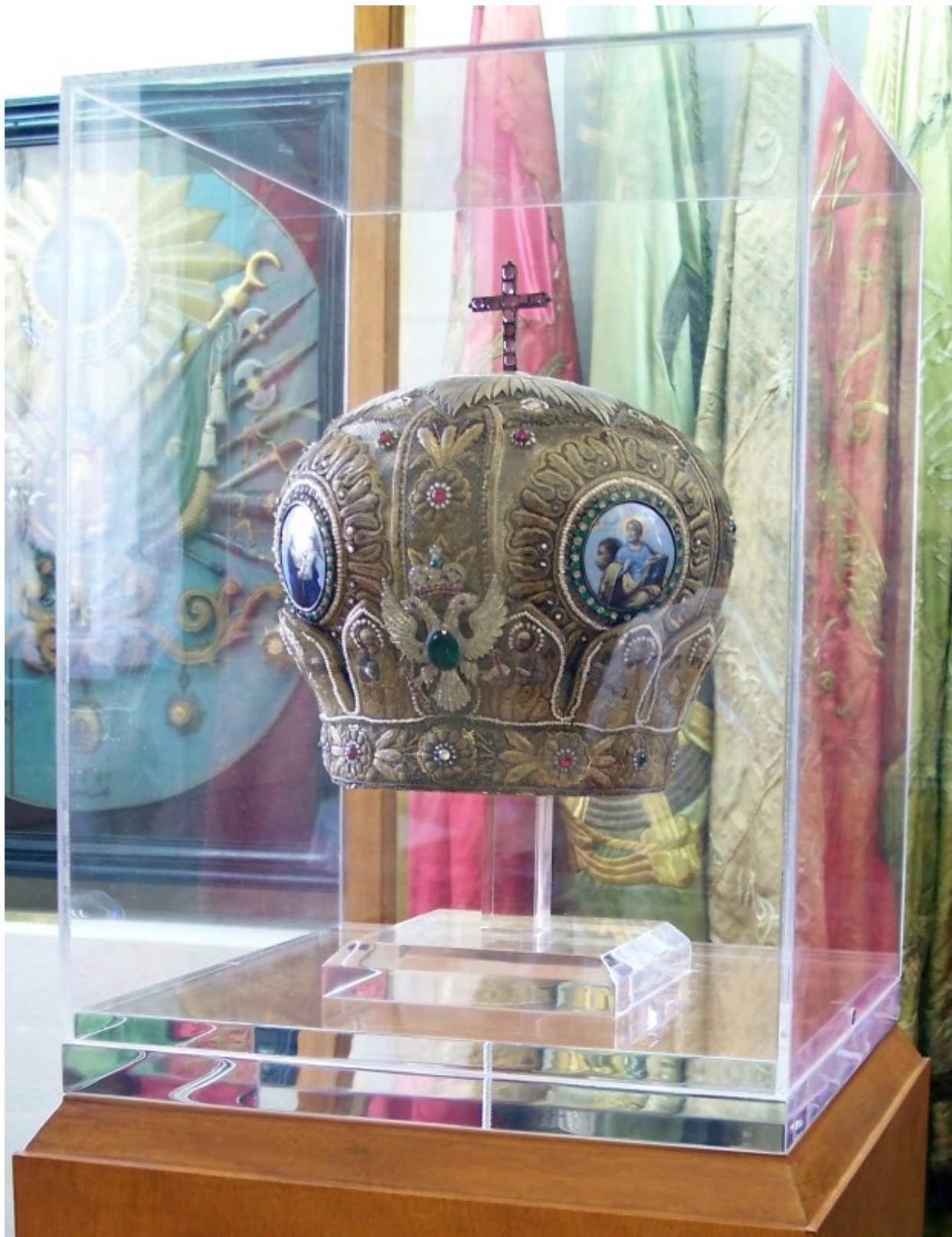
Η μίτρα του Χρυσσοστόμου Σμύρνης. Εθνικό Ιστορικό Μουσείο, Αθήνα