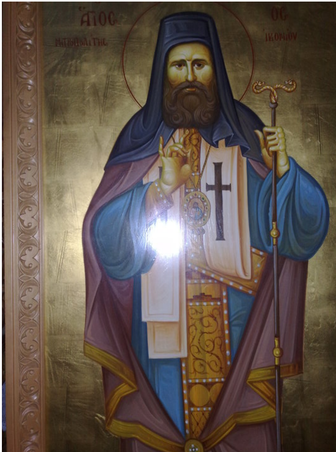
Άγιος Προκόπιος Ικονίου (έργο Αναστασίου Δρακόπουλου - Ιερός Ναός Αγίου Κοσμά Αιτωλού Ν.Φιλαδέλφειας)

Προηγουμένως επίσκοπος Αμφιπόλεως (1894 - 1899 μ.Χ.) και Μητροπολίτης Δυρραχείου (1899 - 1906 μ.Χ.) και Φιλαδέλφειας (1906 - 1911 μ.Χ.). Ήταν και