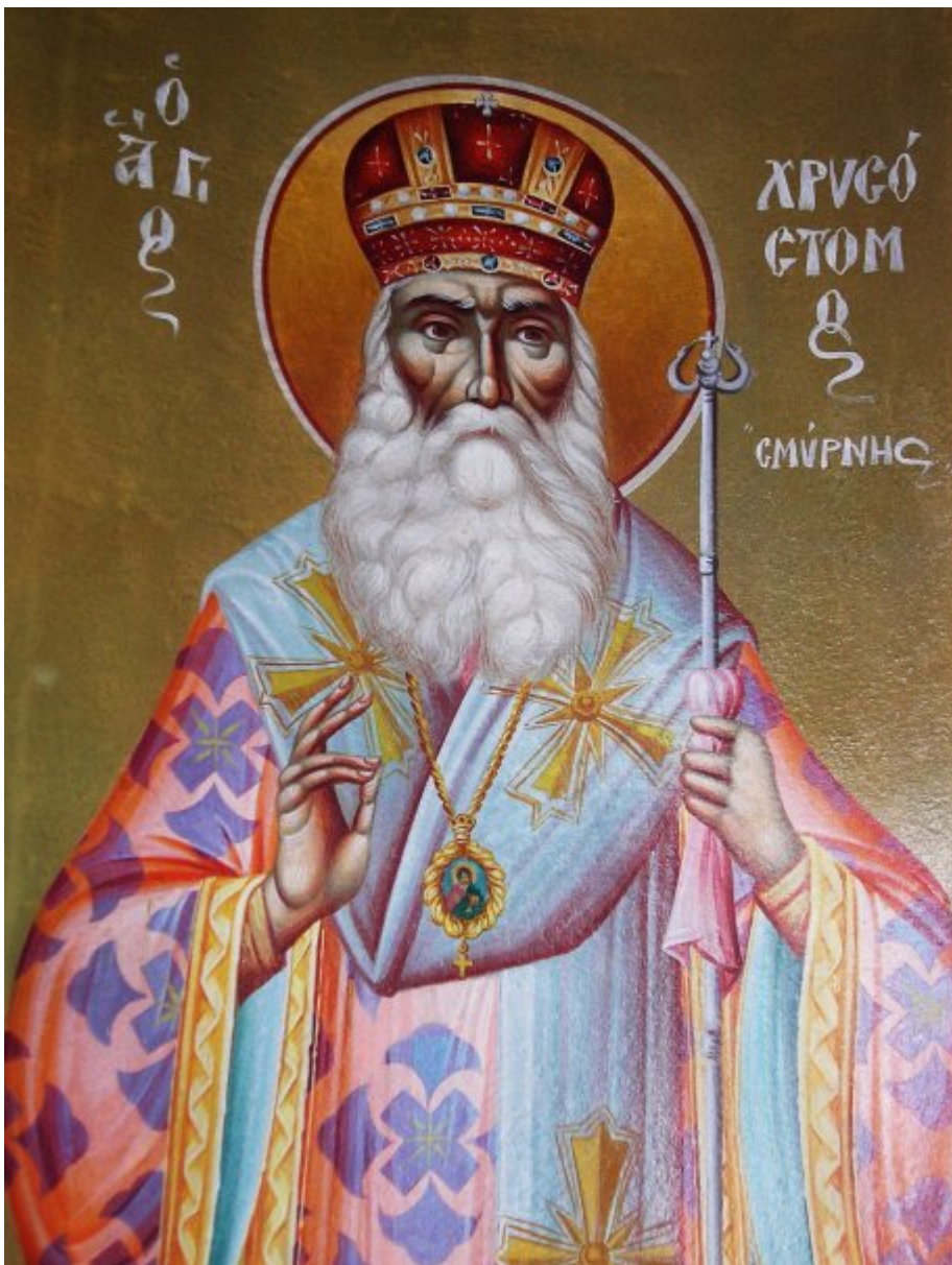
Άγιος Χρυσόστομος Σμύρνης