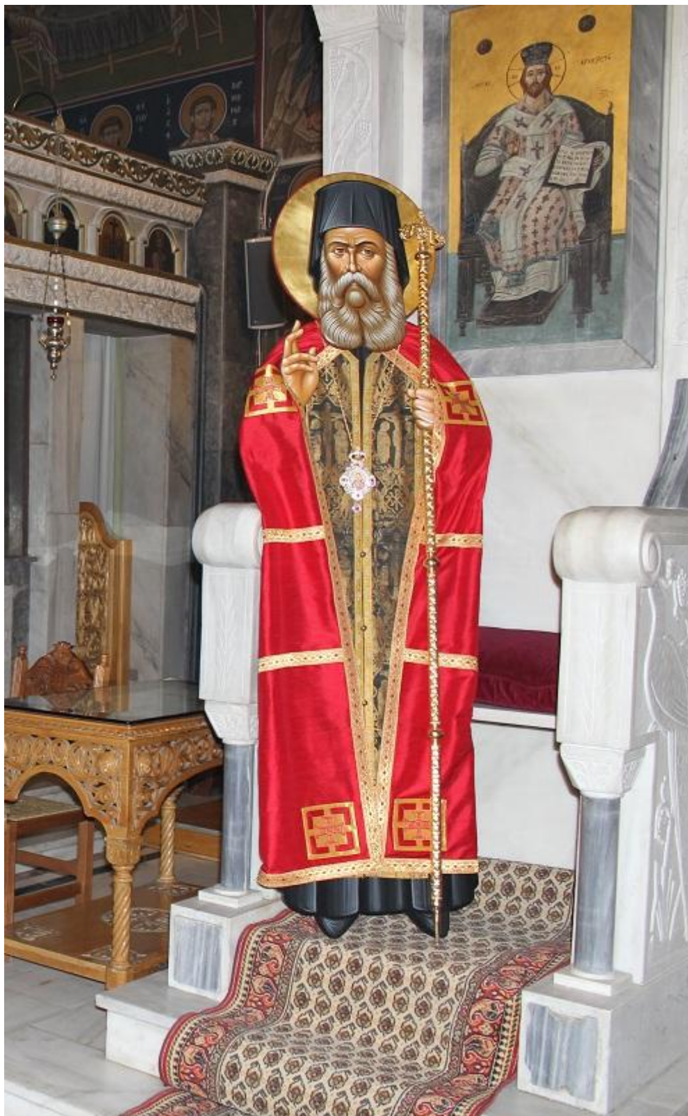
Εικόνα του Αγίου Χρυσόστομου Σμύρνης σε φυσική κλίμακα απο τον Ι. Ν. Παναγίας Παντοβασίλισσας Νέας Τριγλίας Χαλκιδικής που φέρει το αυθεντικό επιτραχήλιο του Αγίου