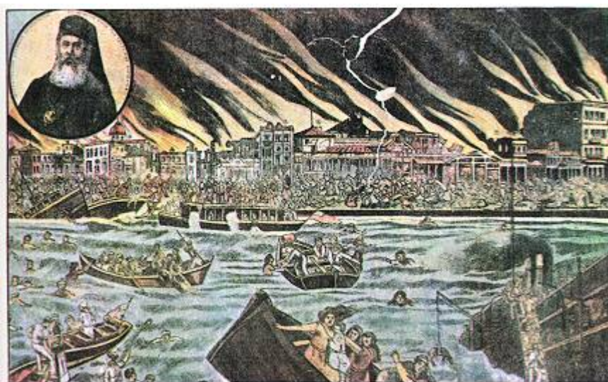
Η Μικρασιατική Καταστροφή