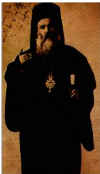
Άγιος Χρυσόστομος Σμύρνης