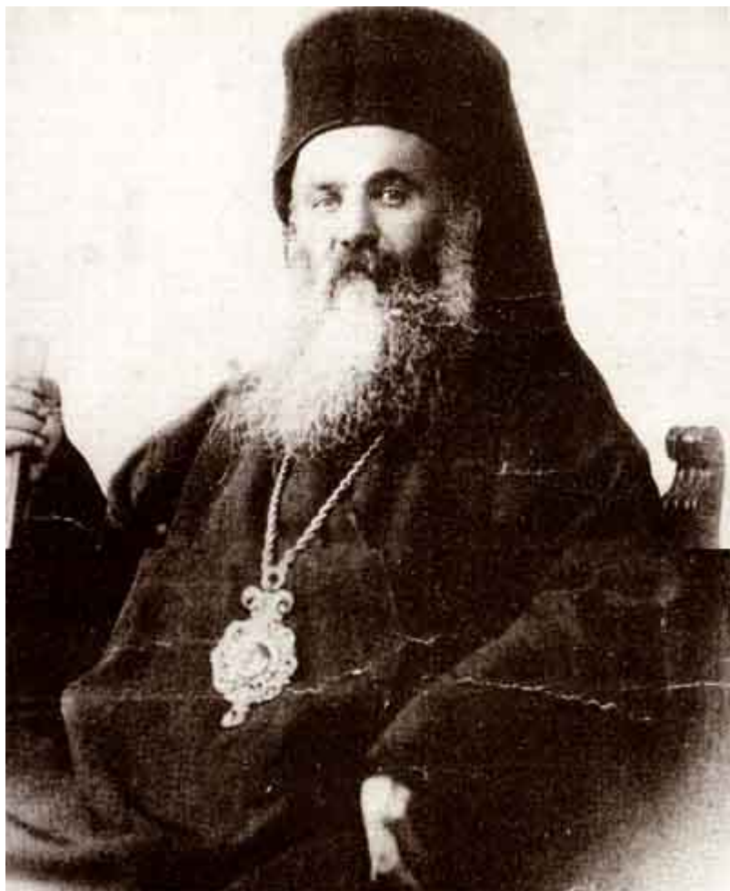
Άγιος Χρυσόστομος Σμύρνης