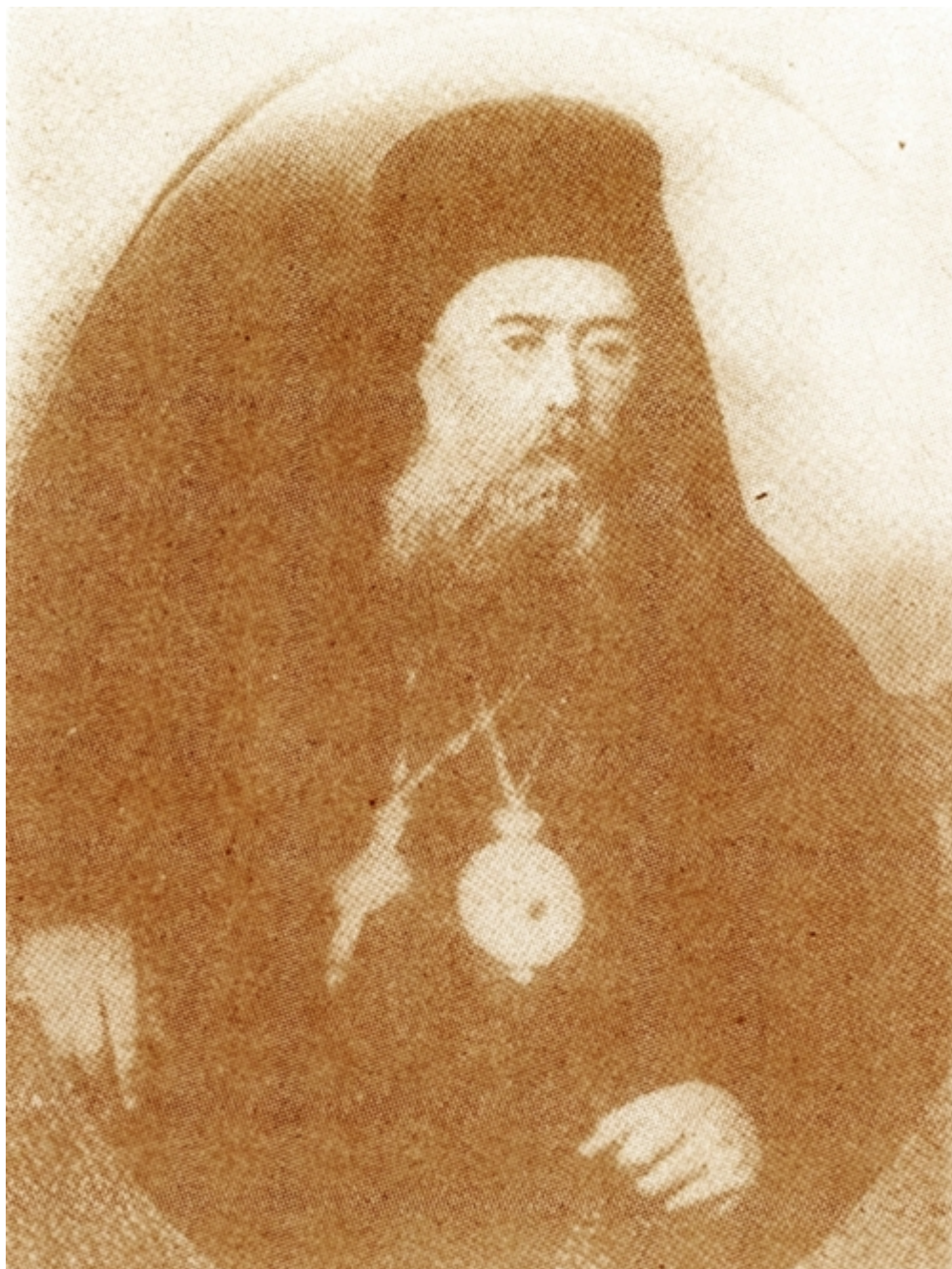
Άγιος Γρηγόριος Κυδωνιών

Προηγουμένως διετέλεσε και μητροπολίτης Τιβεριουπόλεως και Στρωμνίτης (12 Οκτωβρίου 1902 μ.Χ. - 22 Ιουλίου 1908 μ.Χ.). Το κοσμικό του όνομα ήταν Αναστάσιος Αντωνιάδης ή Σαατσόγλου και, κατά μεταγλώττιση δική του, Ωρολογάς. Γεννήθηκε στη Μαγνησία της Μικράς Ασίας το 1864 μ.Χ. Ως Ιεροκήρυκας ανήκει στους πρώτους που στο κήρυγμα χρησιμοποίησαν τη δημοτική γλώσσα. Και στις τρεις μητροπόλεις που υπηρέτησε εργάστηκε με ζήλο και επιτυχία για την προάσπιση των εθνικών ελληνικών δικαιών και ιδιαίτερα συνεργάστηκε γι' αυτά με τον μητροπολίτη Δράμας Χρυσόστομο Καλαφάτη (1902 - 1910 μ.Χ.), τον κατόπιν εθνομάρτυρα μητροπολίτη Σμύρνης (1910 - 1922 μ.Χ.). Στις 12 Οκτωβρίου 1902 μ.Χ. χειροτονήθηκε μητροπολίτης στη σπουδαία από