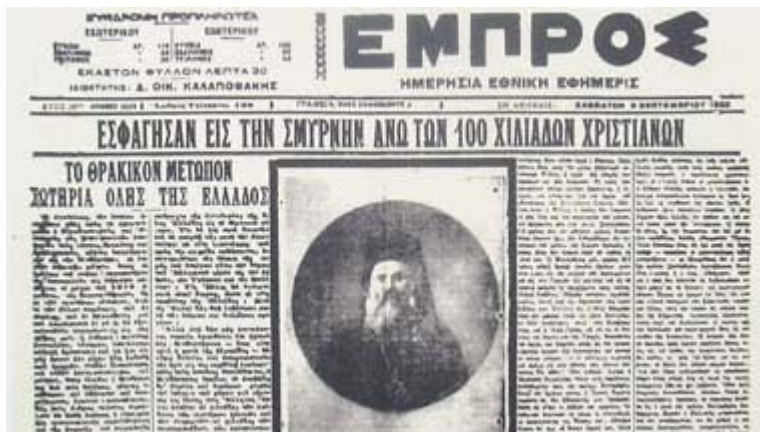
Άγιος Χρυσόστομος Σμύρνης