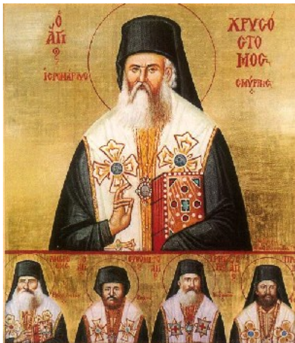
Άγιος Χρυσόστομος Σμύρνης