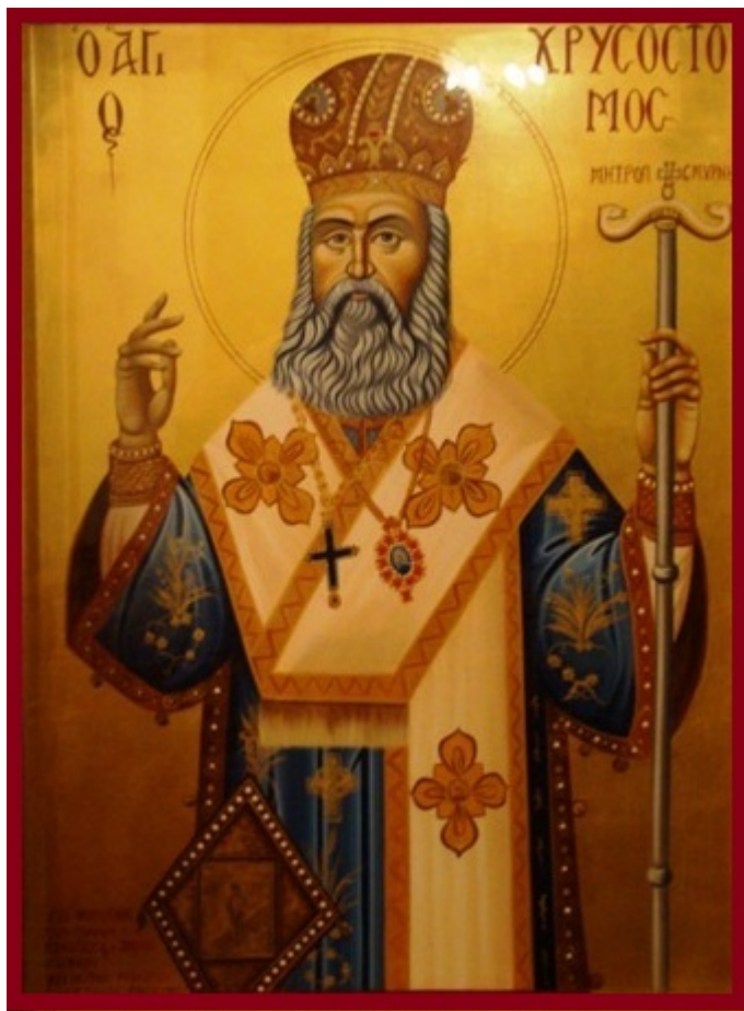
Άγιος Χρυσόστομος Σμύρνης