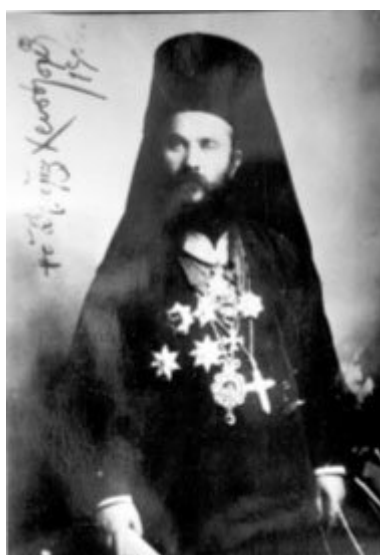
Άγιος Χρυσόστομος Σμύρνης