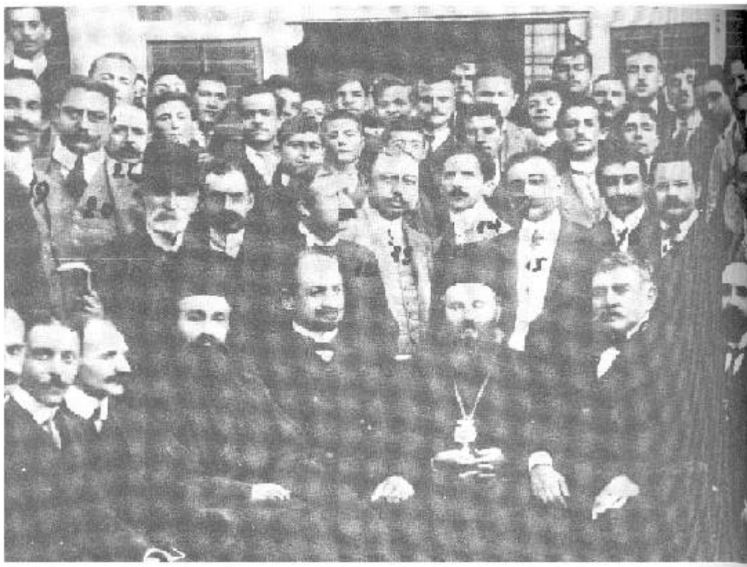
Άγιος Χρυσόστομος Σμύρνης