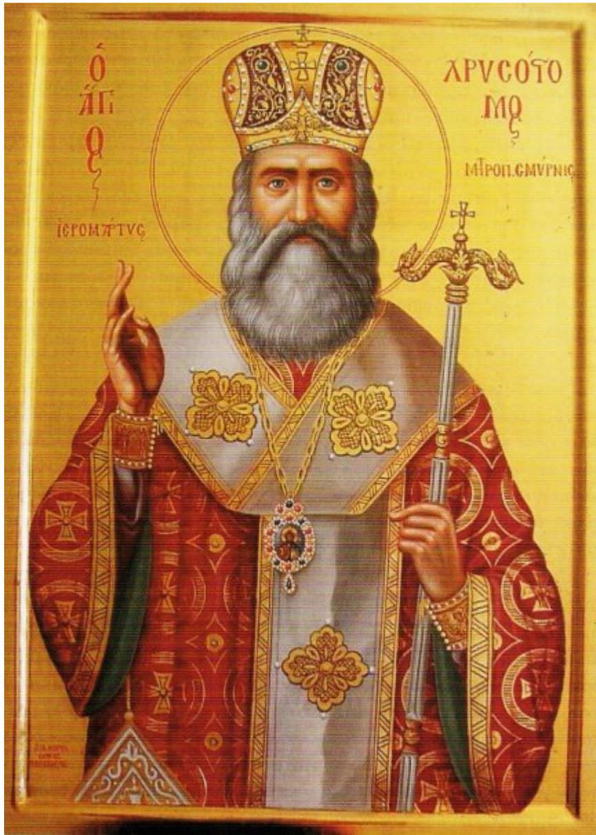
Άγιος Χρυσόστομος Σμύρνης