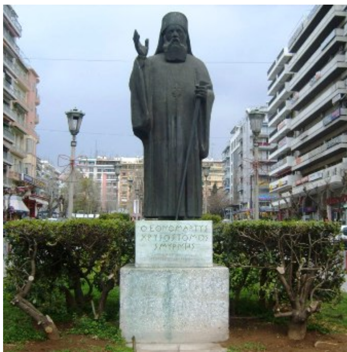
Άγιος Χρυσόστομος Σμύρνης