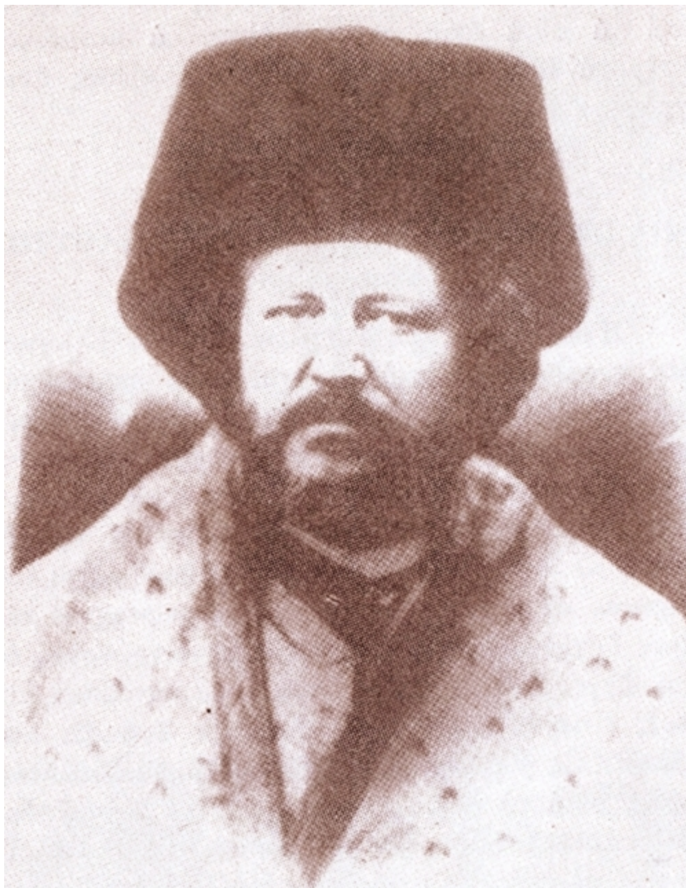
Άγιος Ευθύμιος ο Ιερομάρτυρας Επίσκοπος Ζήλων

Ο Ευθύμιος Αγριτέλης, υπήρξε επίσκοπος Ζήλων από το 1912 μ.Χ. έως το 1921 μ.Χ. Μοναχός της Ιεράς Μονής Λειμώνας, σπούδασε στη Θεολογική σχολή της Χάλκης και κατόπιν έκανε διδάσκαλος και Ιεροκήρυκας στη Λέσβο και πρωτοσύγκελος στη μητρόπολη Μηθύμνης. Στις 12 Ιουνίου 1912 μ.Χ. χειροτονήθηκε επίσκοπος Ζήλων. Ως επίσκοπος ανέπτυξε μεγάλη θρησκευτική και εθνική δράση. Όταν η δράση του έγινε γνωστή στους Κεμαλιστές Τούρκους, συνελήφθη και φυλακίστηκε μαζί με άλλους πρόκριτους της επαρχίας Αμασείας στις 21 Ιανουαρίου 1921 μ.Χ. Με αίτηση του, ζήτησε από την κεμαλική κυβέρνηση της Άγκυρας να θεωρηθεί μόνο αυτός ένοχος και να απαλλαγούν οι υπόλοιποι συλληφθέντες. Μάλιστα δε μπροστά στο δικαστήριο απολογήθηκε με θαυμάσια αγόρευση. Στη φυλακή υπέστη πολλά βασανιστήρια, από τα όποια και πέθανε στις