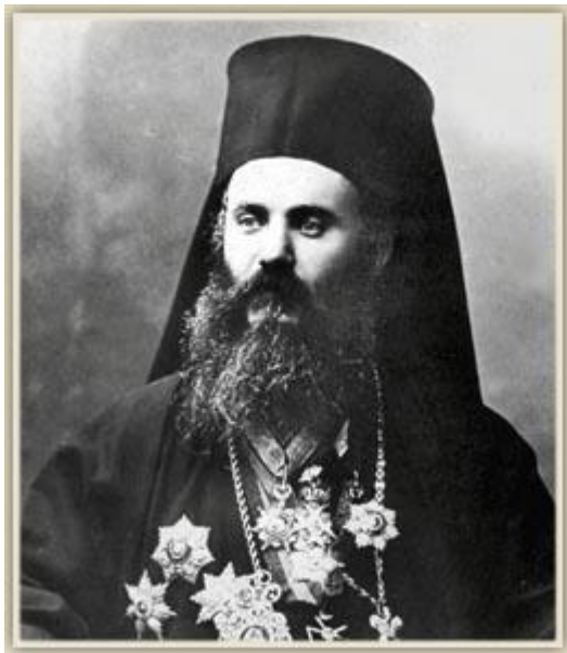
Άγιος Χρυσόστομος Σμύρνης