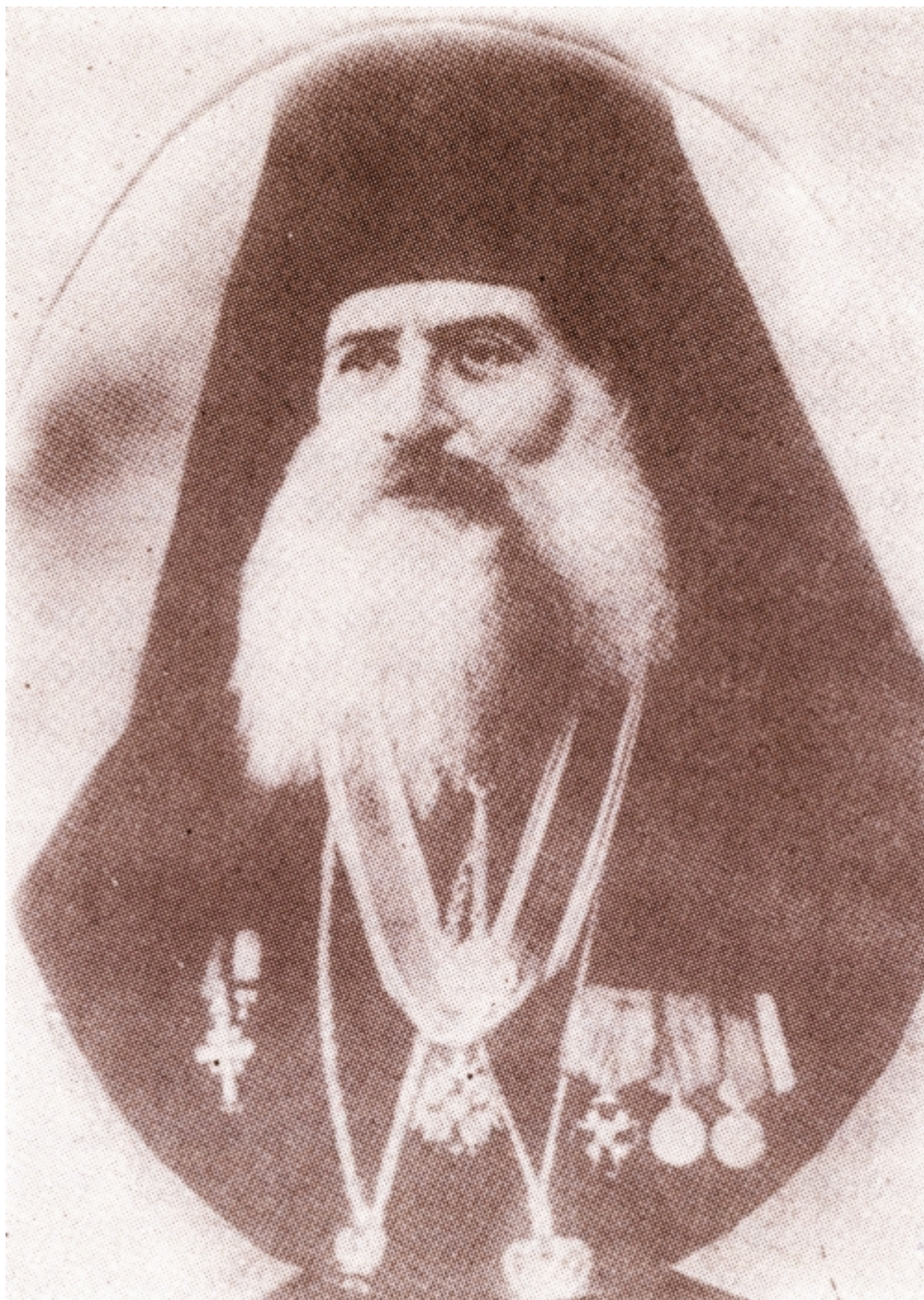
Άγιος Αμβρόσιος Μοσχονησίων

Ο Άγιος Αμβρόσιος σπούδασε στη Θεολογική Σχολή του Τιμίου Σταυρού Ιεροσολύμων και στη θεολογική Ακαδημία του Κιέβου. Υπήρξε δε εφημέριος σε πολλές ελληνικές κοινότητες της Κριμαίας (Θεοδοσίας, Συμφεροπόλεως, Σεβαστουπόλεως). Το 1913 μ.Χ. χειροτονήθηκε βοηθός επίσκοπος της Μητροπόλεως Σμύρνης με τον τίτλο Ξανθουπόλεως, αναπλήρωσε δε τον εξόριστο μητροπολίτη κατά τη διάρκεια του Α΄ παγκοσμίου πολέμου. Το 1919 μ.Χ. χρησιμοποιήθηκε ως πατριαρχικός έξαρχος στα Μοσχονήσια, το δε 1922 μ.Χ. έγινε Μητροπολίτης Μοσχονησίων. Κατά τη Μικρασιατική καταστροφή τάφηκε ζωντανός, από τους Τούρκους μαζί με άλλους εννέα Ιερείς σε λάκκο έξω από την