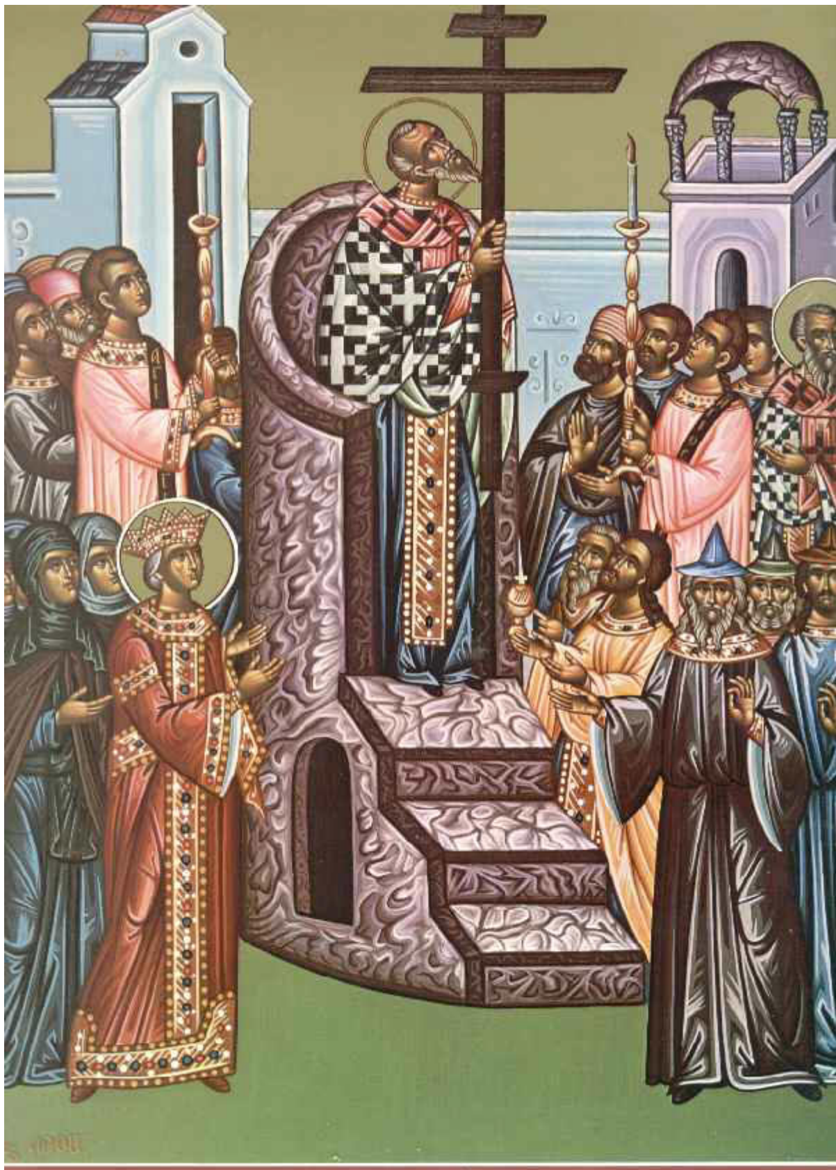
Ύψωση του Τιμίου και Ζωοποιού Σταυρού