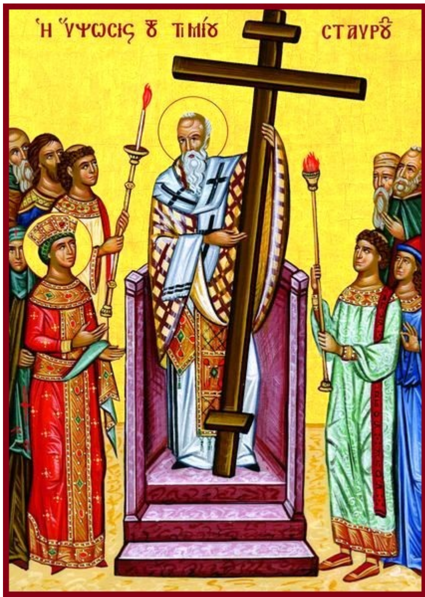
Ἦψωση τοῦ Τιμίου καὶ Ζωοποιοῦ Σταυροῦ