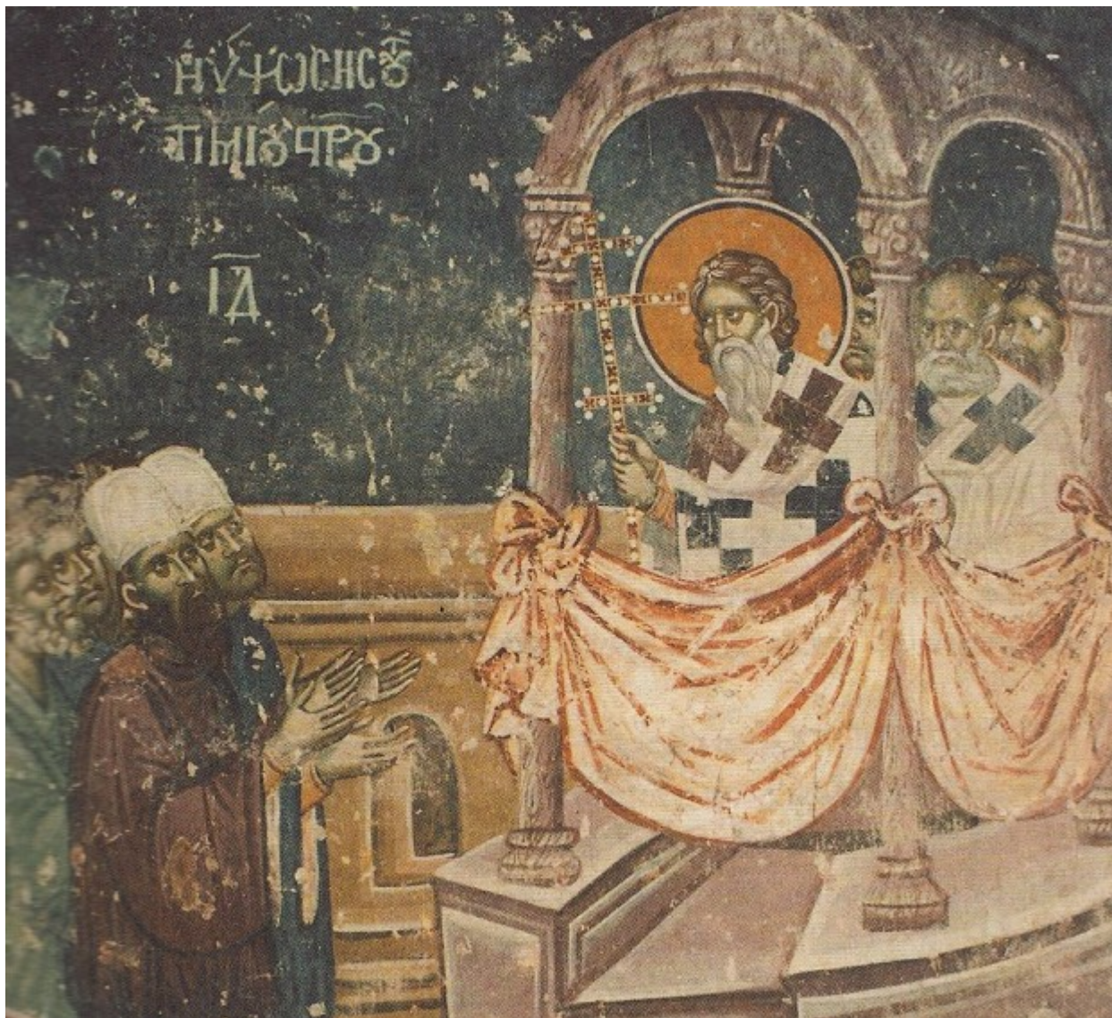
Υψωση του Τιμίου και Ζωοποιού Σταυρού