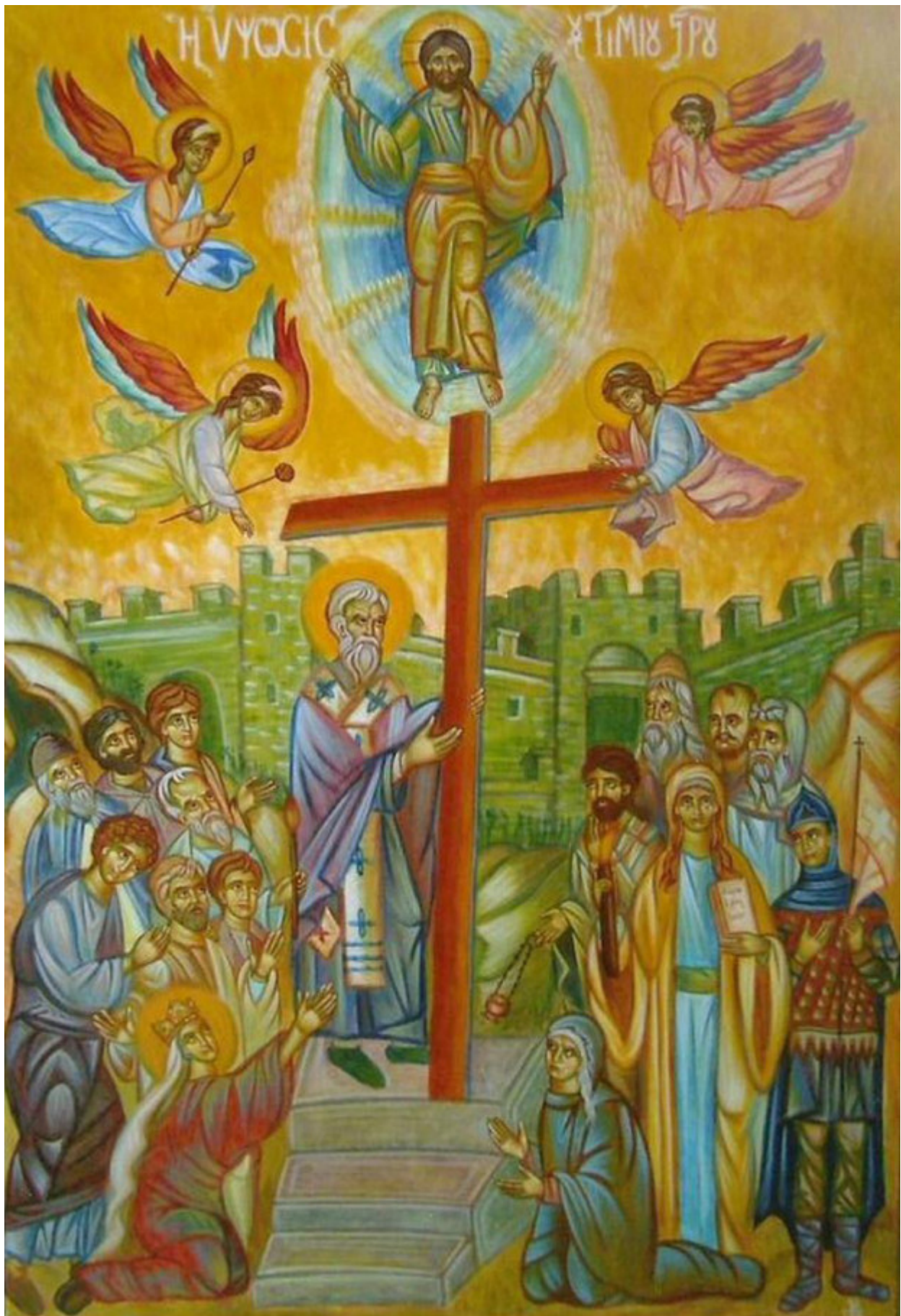
Ύψωση του Τιμίου και Ζωοποιού Σταυρού - Ησυχαστήριο «Παναγία των Βρυούλων»