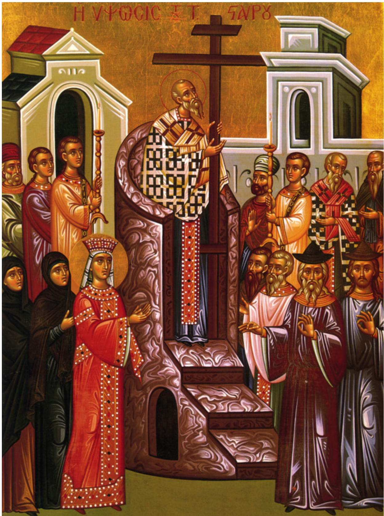
Ύψωση του Τιμίου και Ζωοποιού Σταυρού