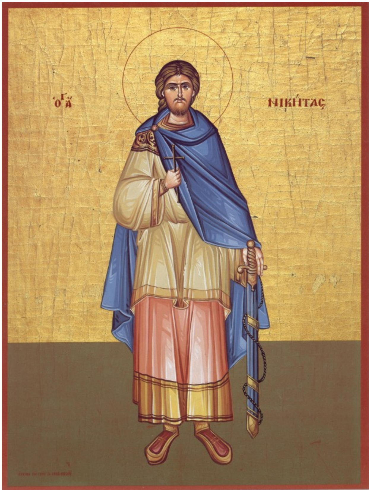
Άγιος Νικήτας ο Γότθος ο μεγαλομάρτυρας