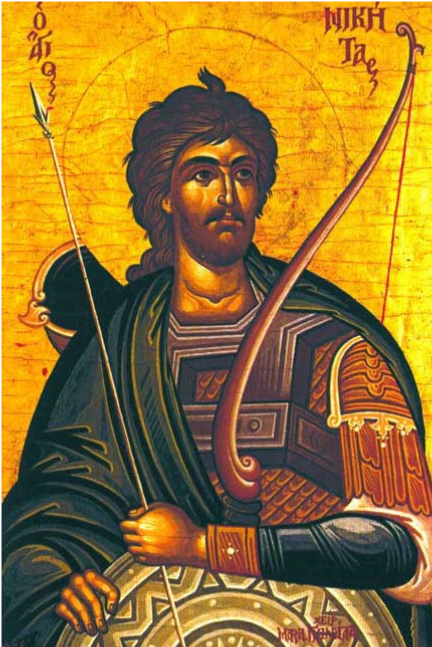
Άγιος Νικήτας ο Γότθος ο μεγαλομάρτυρας

Εορτάζει στις 15 Σεπτεμβρίου εκάστου έτους.