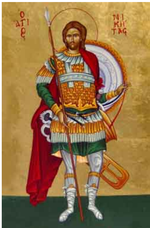
Άγιος Νικήτας ο Γότθος ο μεγαλομάρτυρας