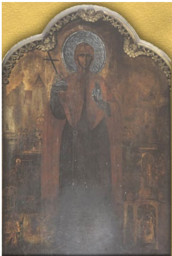
Αγία Ευφημία, ΑΨΜΑ΄ (1741 μ.Χ.) Ίουλίου 13, διὰ χειρὸς τοῦ Ἱεροθέου ἱερομονάχου τοῦ Πατριαρχείου