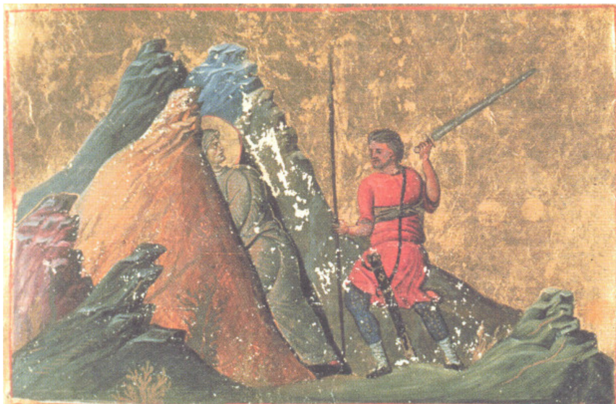
Αγία Αριάδνη - Μηνολόγιον Βασιλείου Β΄, φ. 48 (11ος αι.)