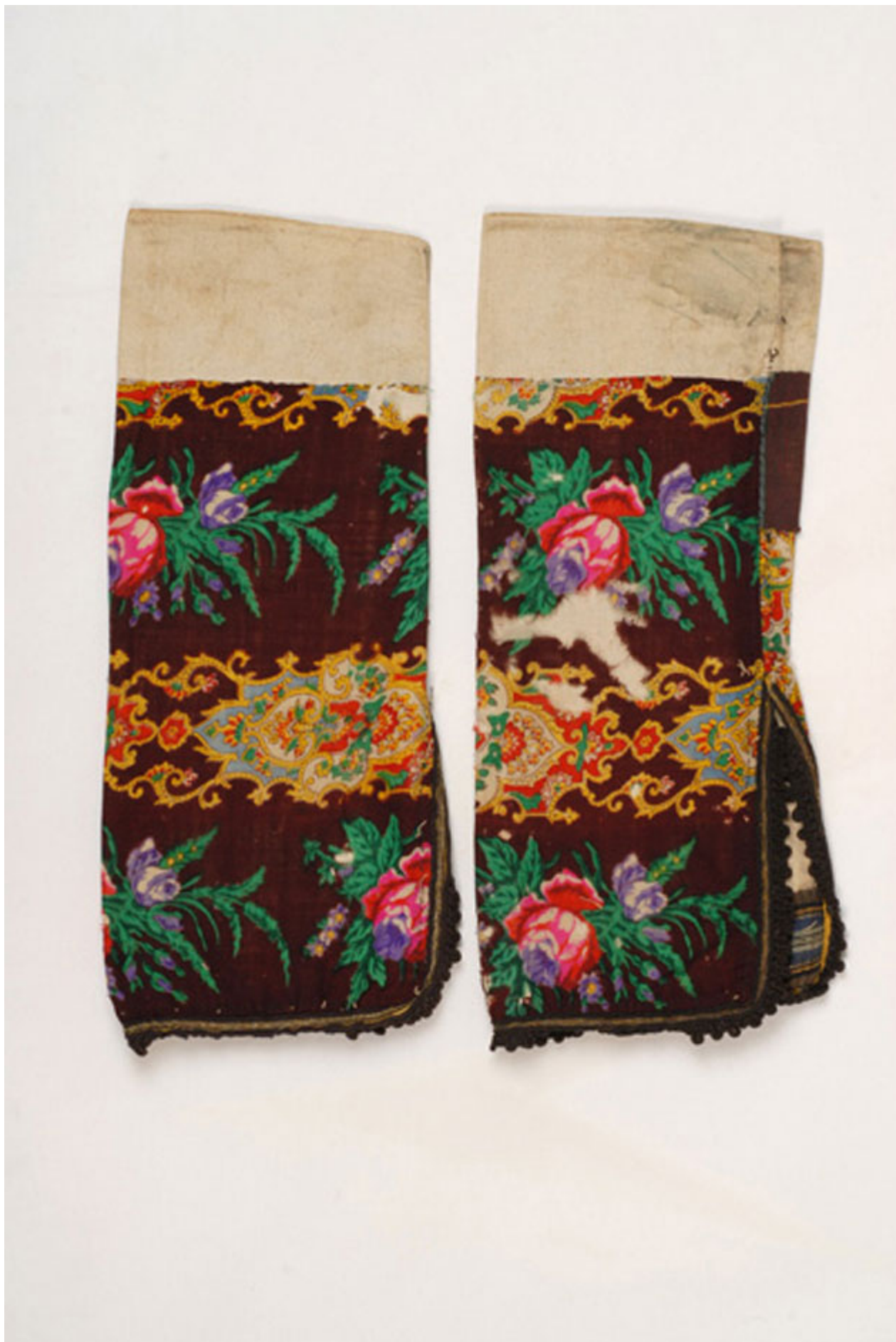
Ζευγάρι μανίκια από σαγιά, Επισκοπής, από το ψηφιακό αρχείο του Λυκείου των Ελληνίδων