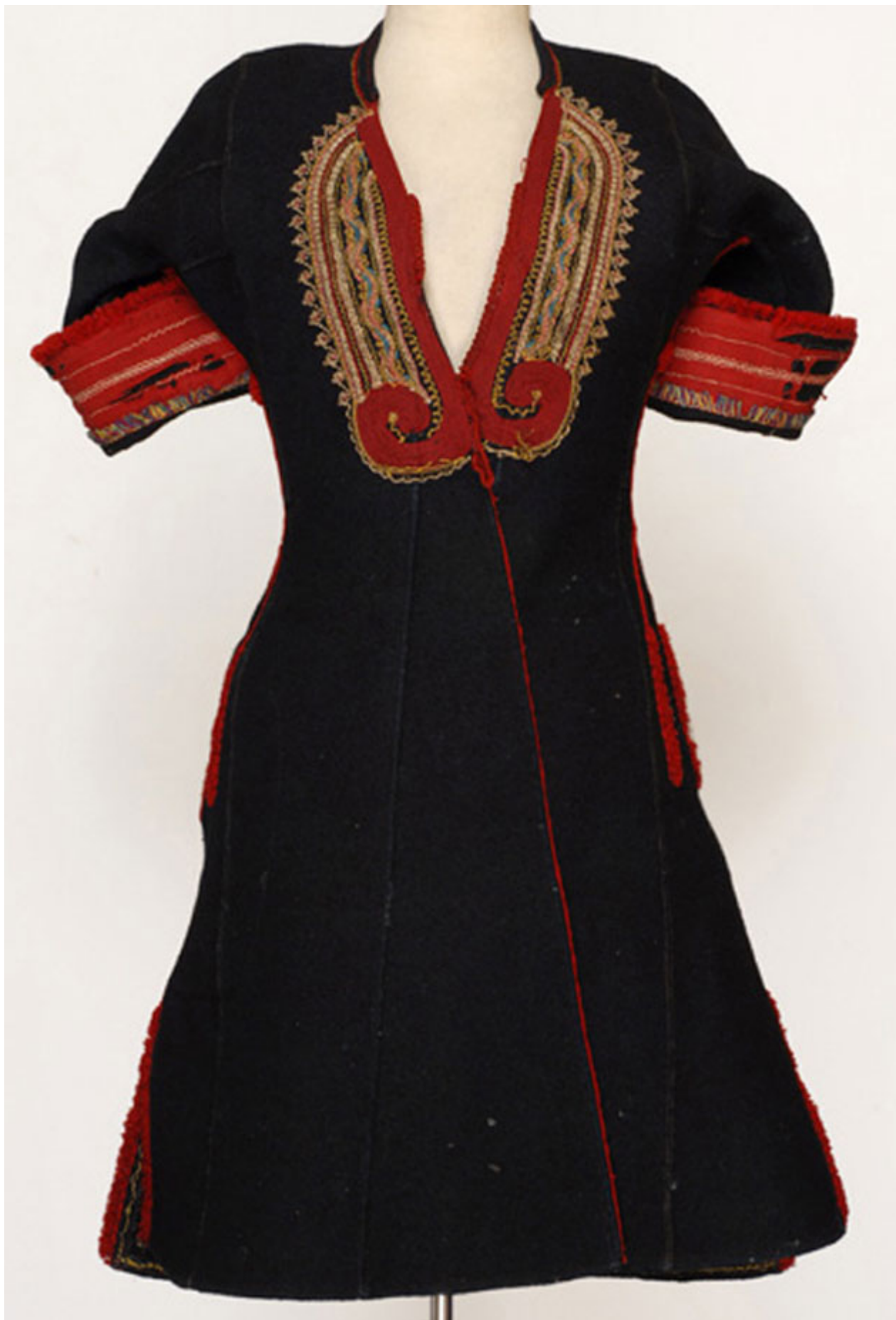
Σαΐκ Χειμωνιάτικος σαγιάς Επισκοπής