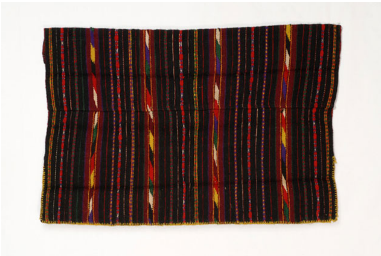
Γυναικεία ποδιά Επισκοπής

Η ποδιά (πριγκάτς) είναι μάλλινη, φτιαγμένη από δύο φύλλα υφάσματος ενωμένα οριζόντια, έτσι που το μήκος του υφάσματος γίνεται φάρδος της ποδιάς. Στο πάνω μέρος της είναι στριφωμένη κατά 5 εκ. για να περνά το κορδόνι με το οποίο η ποδιά δένεται γύρω από τη μέση. Φοριέται πάνω από το ζωνάρι, δένεται στην κάτω άκρη του ζωναριού και είναι κοντή πάνω απ' το γόνατο με κρόσσια γύρω - γύρω και διάφορα σχέδια φτιαγμένα στον αργαλειό.