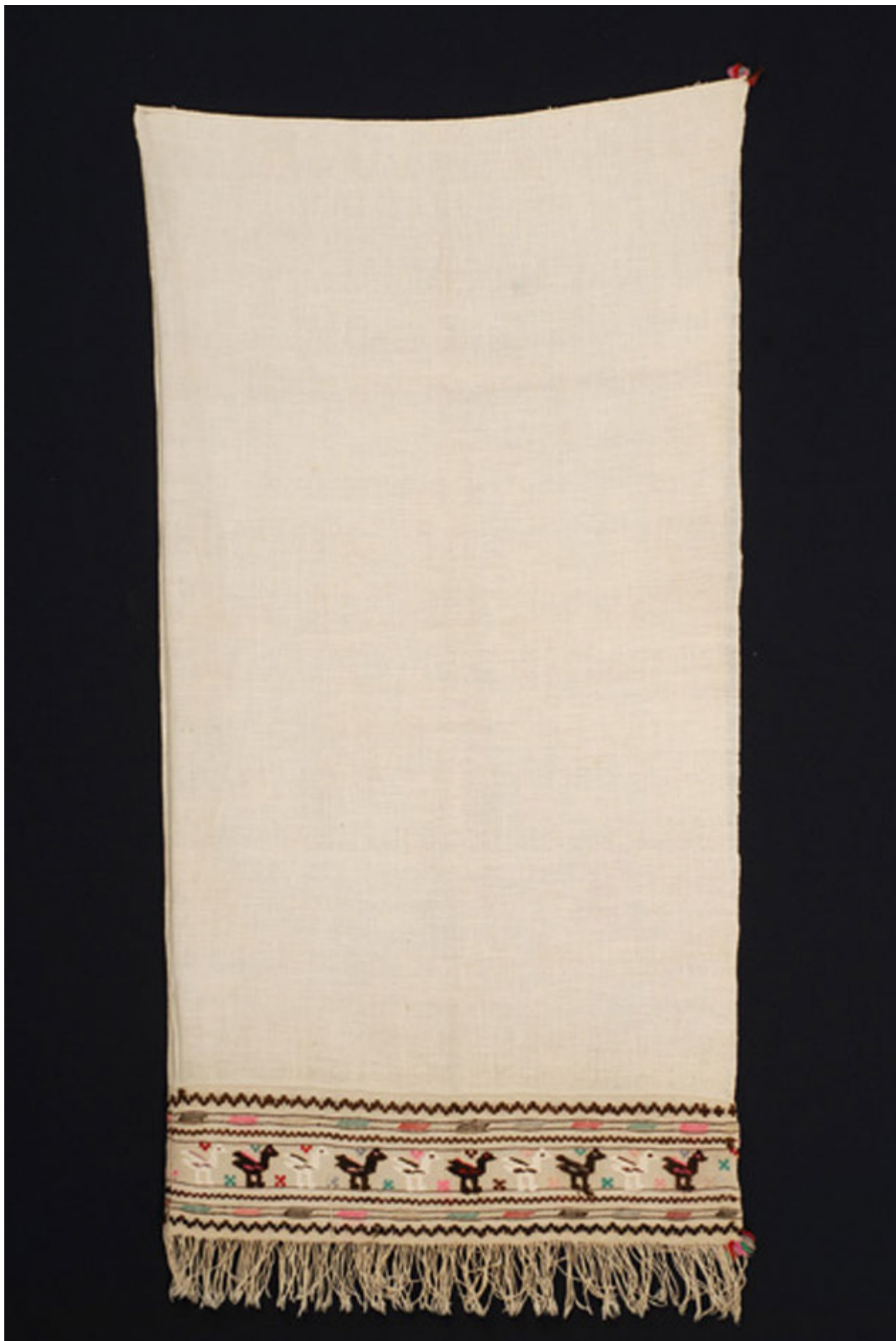
Κάρπα Επισκοπής