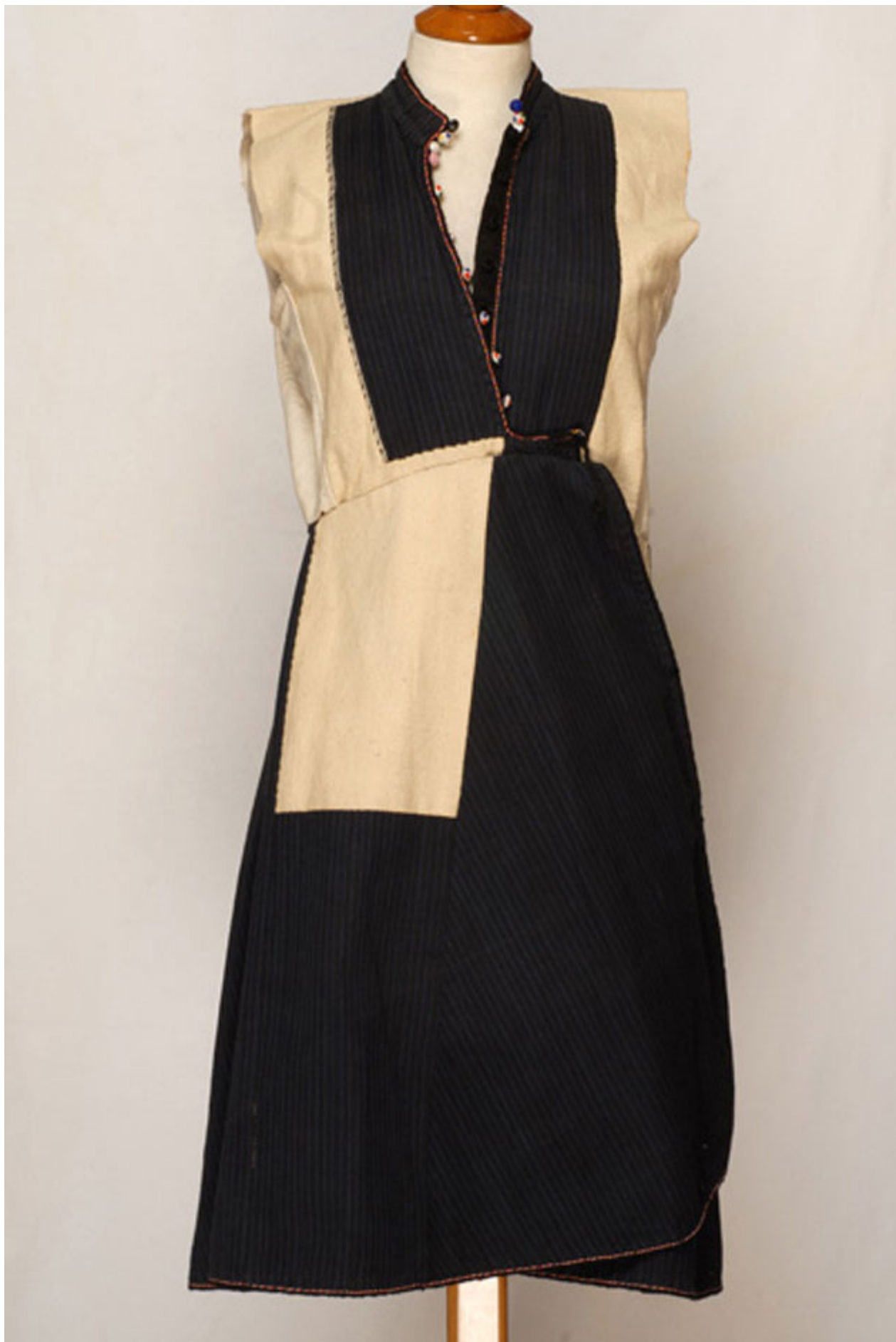
Καβάδι Επισκοπής