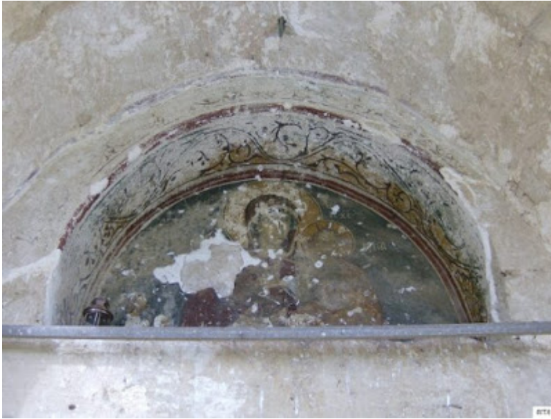
Η τοιχογραφία που σώζεται σε κακή κατάσταση

Ψηφιακός δίσκος για τον συλημένο ναό της Παναγίας της Κανακαριάς