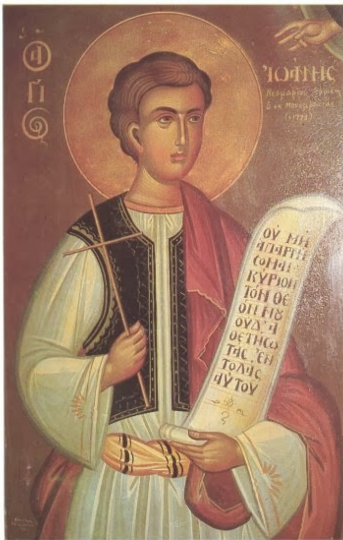
Φορητή εικών του αγίου Ιωάννου του Μονεμβασιώτου. Έργον του Λαρισσίου άγιογράφου Εύαγγ. Καραβασίλη.