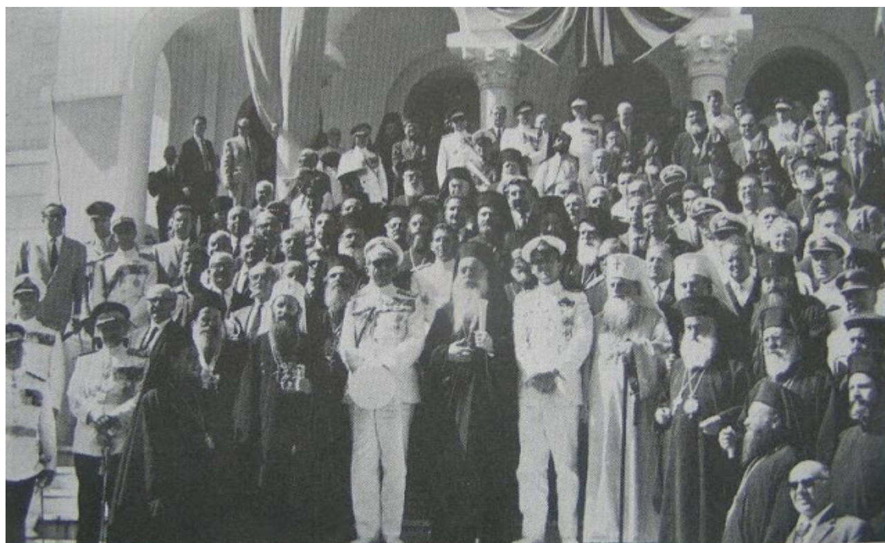
Το έτος 1963 εις τον ΑθΩ εορτάσθηκε με μεγαλοπρέπεια η χιλιετηρίδα του Αγίου Όρους, χίλια χρόνια από την ίδρυσιν της Μεγίστης Λαύρας. Τότε εγένετο εις Άγιον Όρος η επίσκεψις του Οικουμενικού Πατριάρχου, κ.κ. Αθηναγόρα, του τότε Βασιλέως Παύλου, του διαδόχου Κωνσταντίνου, και η εκπεράτων σύναξις της Οικουμενικής Ορθοδοξίας.

όλο και μεγαλύτερες, προς τις οποίες βαδίζει με ασφάλεια, υπολογίζοντας την κατάκτηση τους με το μέτρο του χρόνου. Δεν επαφίεται πια στην τύχη. Έπιασε την αρχή ενός νήματος και το ακολουθεί. Ξέρει σχεδόν από τα πριν την ημερομηνία που θα φτάσει στο ένα ή στο άλλο κρίσιμο σημείο. Ποτέ άλλοτε η ανθρωπότητα δεν άγγισε πραγματικότητες τόσο ζωντανές που την κάνουν να ξεπερνάει διαρκώς τον εαυτό της. Και ιδού ότι μέσα στην αυταρέσκεια και την υπεροψία τηςπίστεψε ότι επέρασε το φράγμα ανάμεσα στο γνωστό και στο άγνωστο, το φράγμα ανάμεσα στις ψυχές. Επίστεψε ότι δεν υπάρχει απόσταση από άνθρωπο σε άνθρωπο, από βίωση σε βίωση. Έπλασε από την Επιστήμη μια θεότητα.