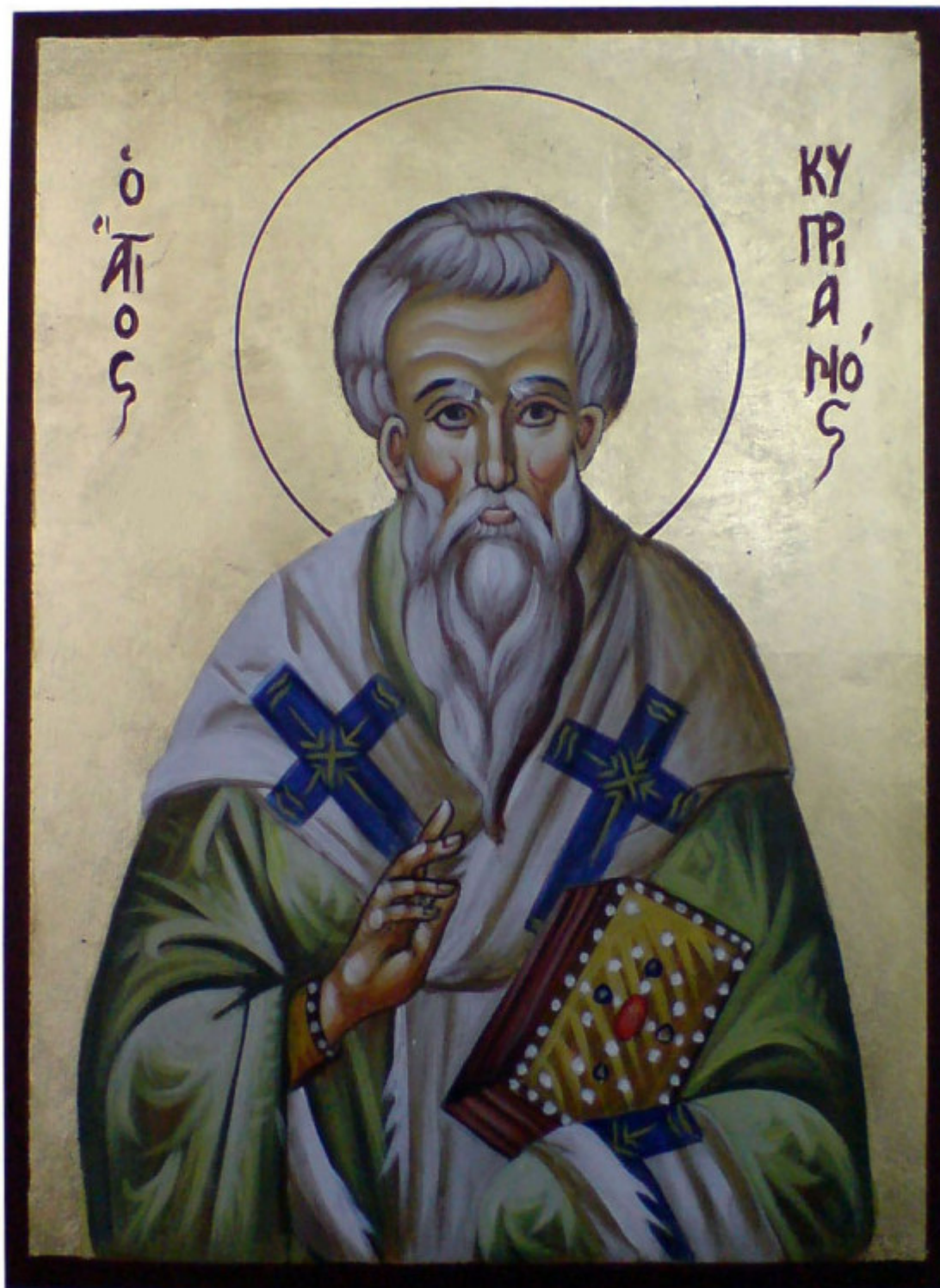
Άγιος Κυπριανός