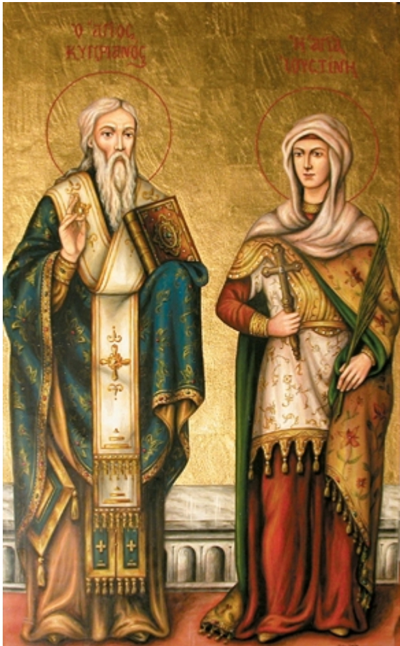
Άγιος Κυπριανός και Αγία Ιουστίνη

Εορτάζει στις 2 Οκτωβρίου εκάστου έτους.