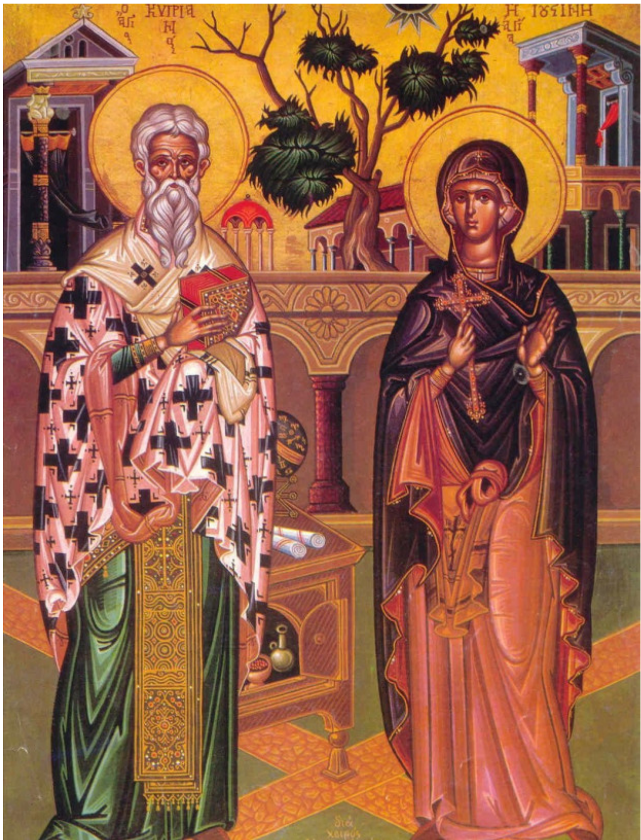
Άγιος Κυριανός και Αγία Ιουστίνη