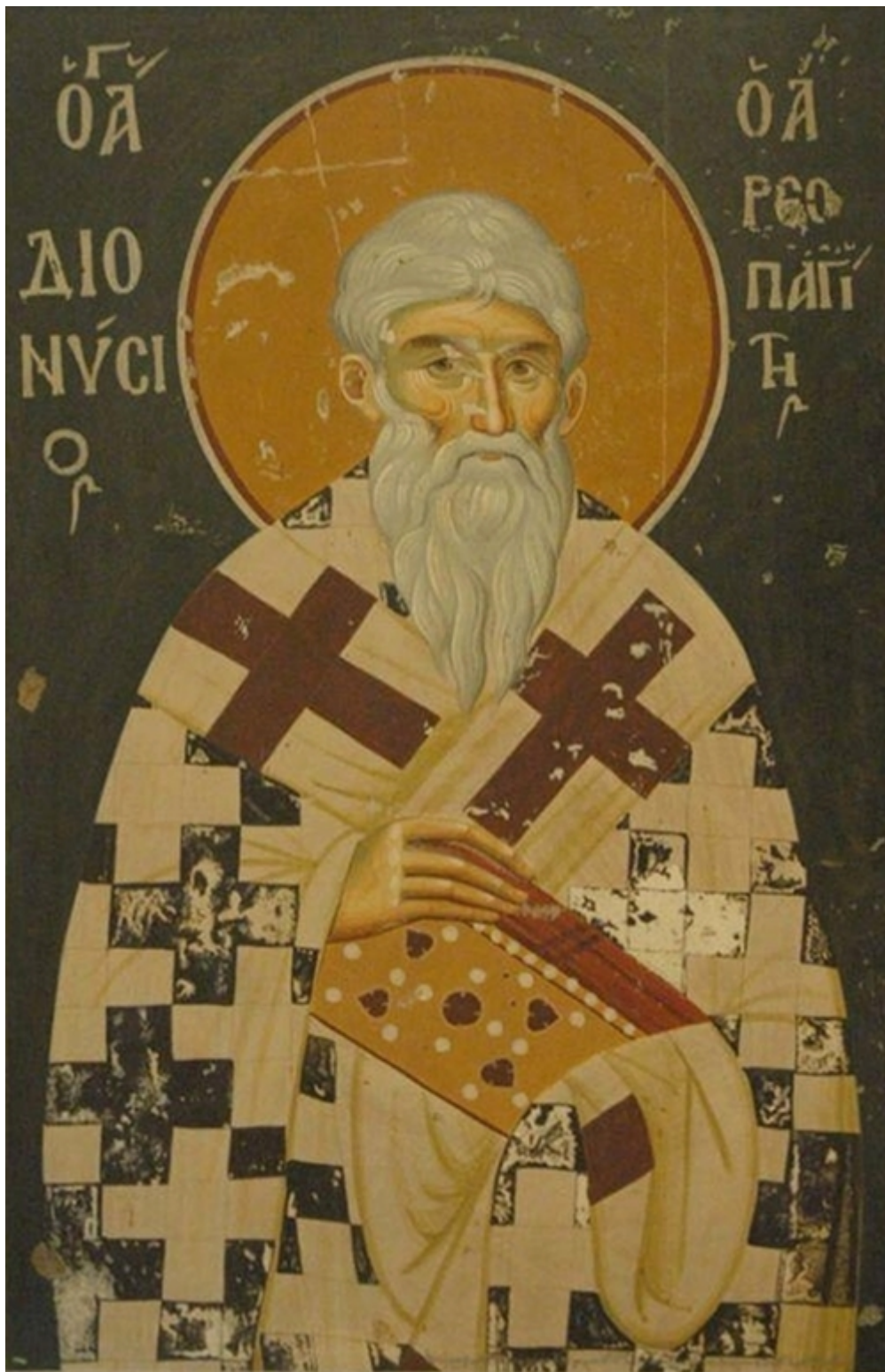
Άγιος Διονύσιος ο Αρεοπαγίτης