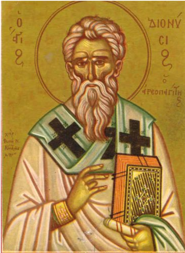
Άγιος Διονύσιος ο Αρεοπαγίτης

Εορτάζει στις 3 Οκτωβρίου εκάστου έτους.