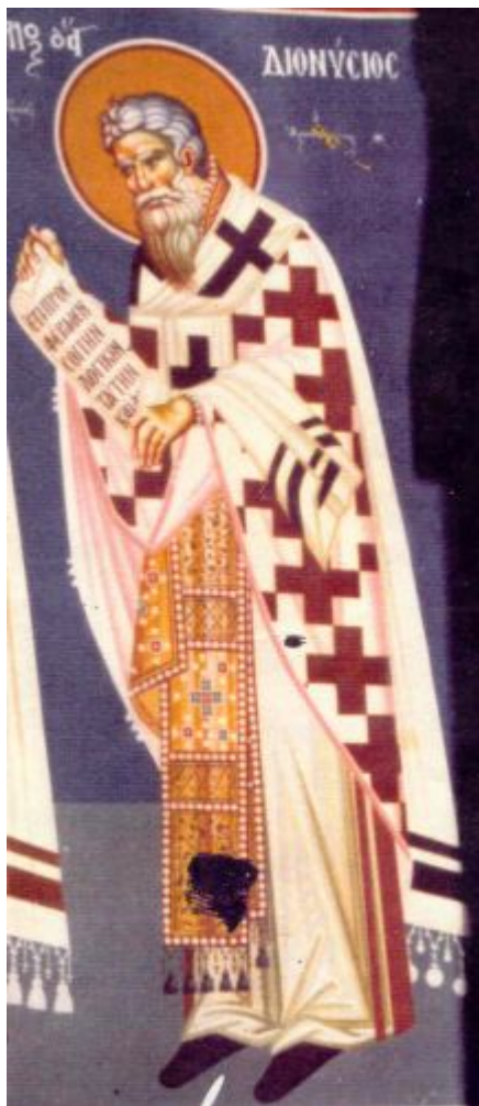
Άγιος Διονύσιος ο Αρεοπαγίτης