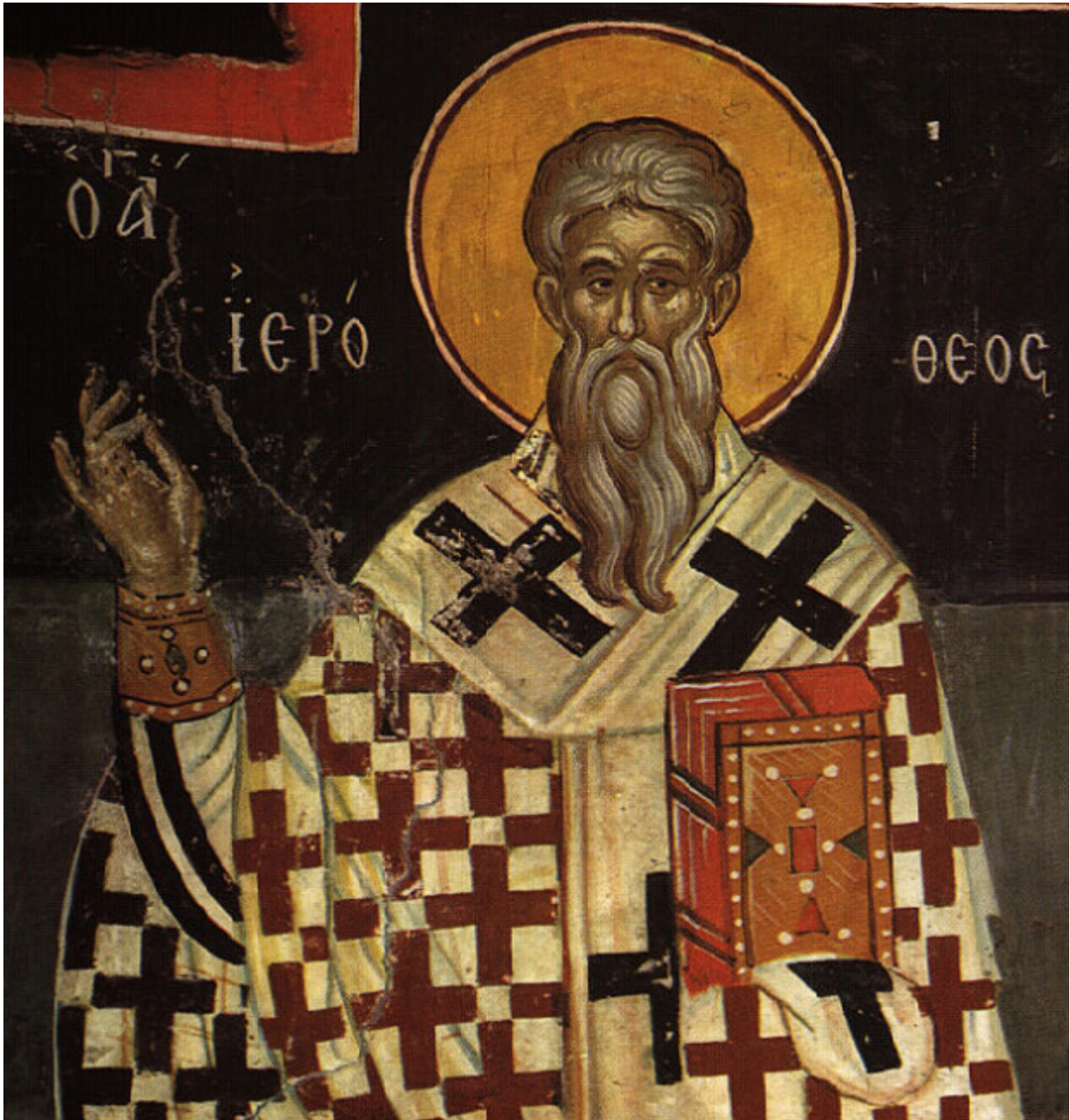
Άγιος Ιερόθεος Επίσκοπος Αθηνών

Εορτάζει στις 4 Οκτωβρίου εκάστου έτους.