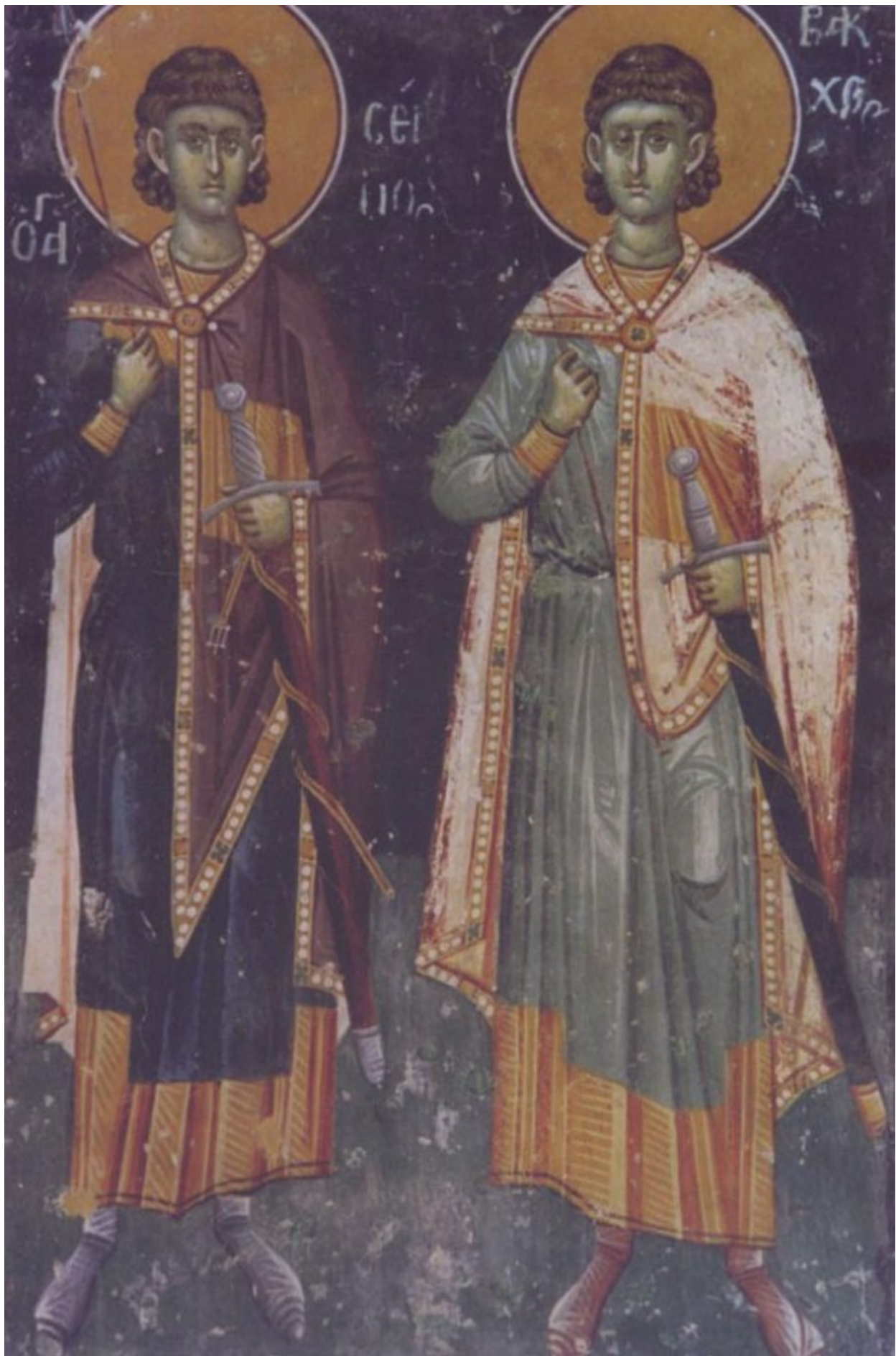
Άγιοι Σέργιος και Βάκχος