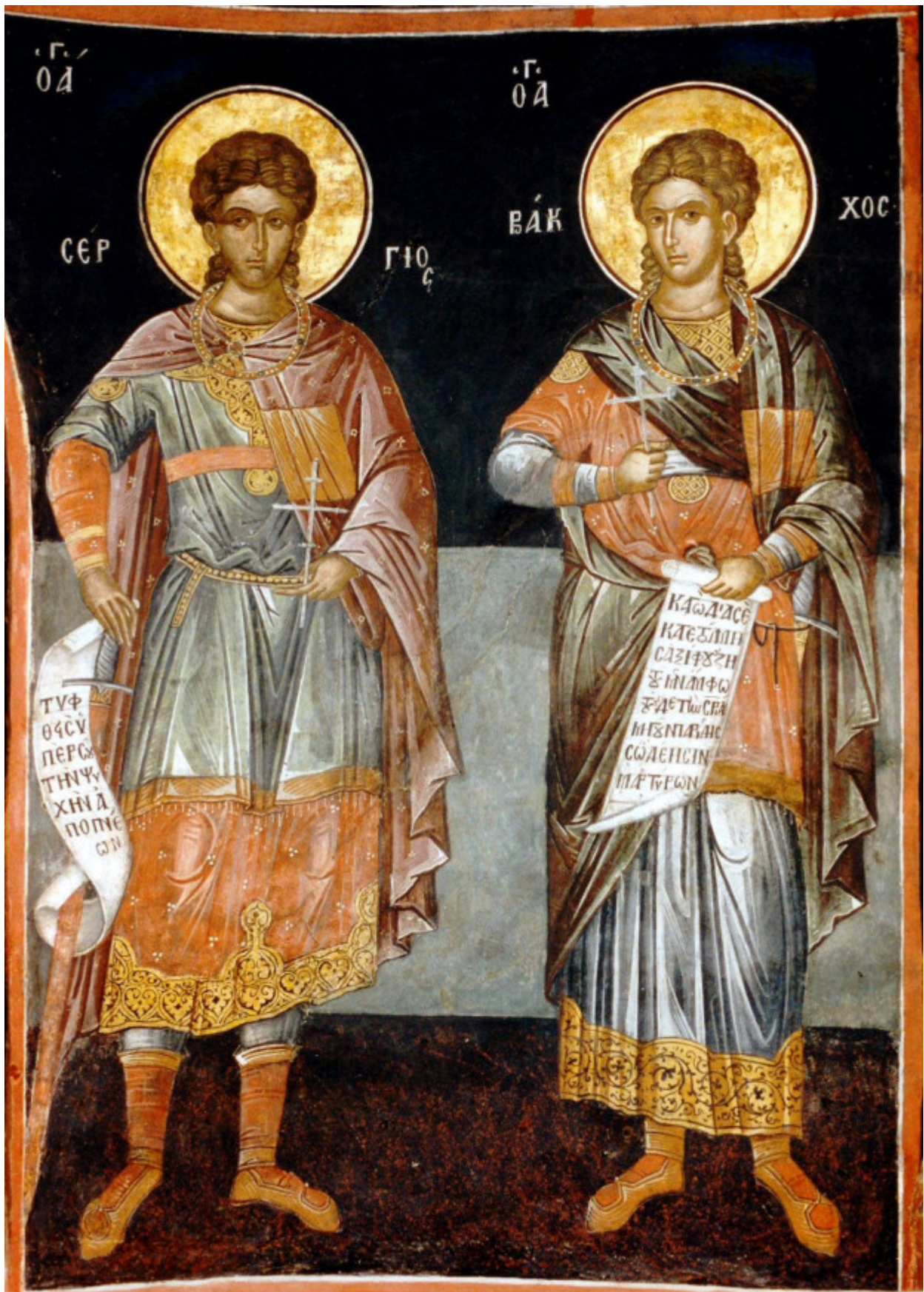
Άγιοι Σέργιος και Βάκχος - Θεοφάνους Κρητός, Καθολικόν Ι. Μ. Μ. Λαύρας

Εορτάζει στις 7 Οκτωβρίου εκάστου έτους.