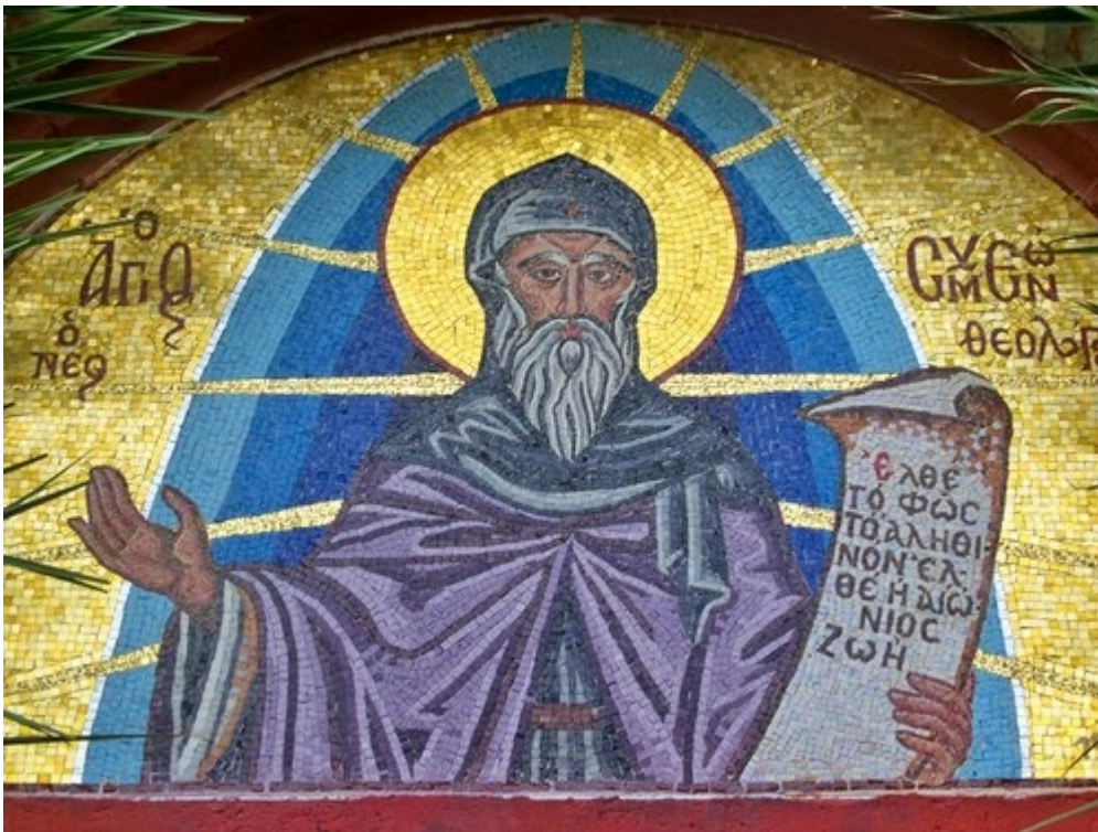
Όσιος Συμεών ο Νέος Θεολόγος