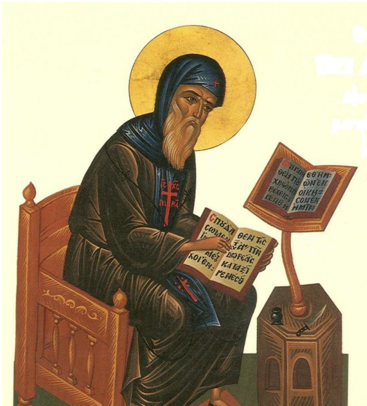
Όσιος Συμεών ο Νέος Θεολόγος