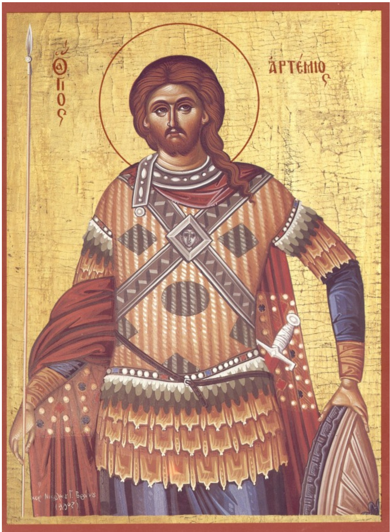
Άγιος Αρτέμιος ο Μεγαλομάρτυρας