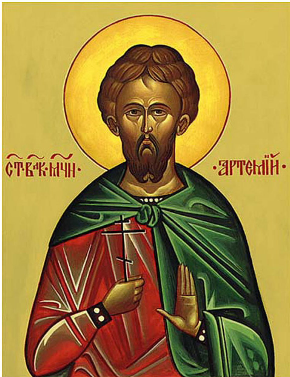
Άγιος Αρτέμιος ο Μεγαλομάρτυρας