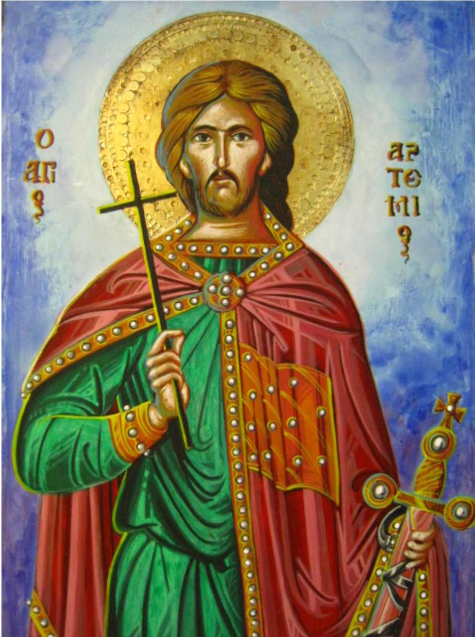
Άγιος Αρτέμιος ο Μεγαλομάρτυρας - Χρήστος Στύλος©

Εορτάζει στις 20 Οκτωβρίου εκάστου έτους.