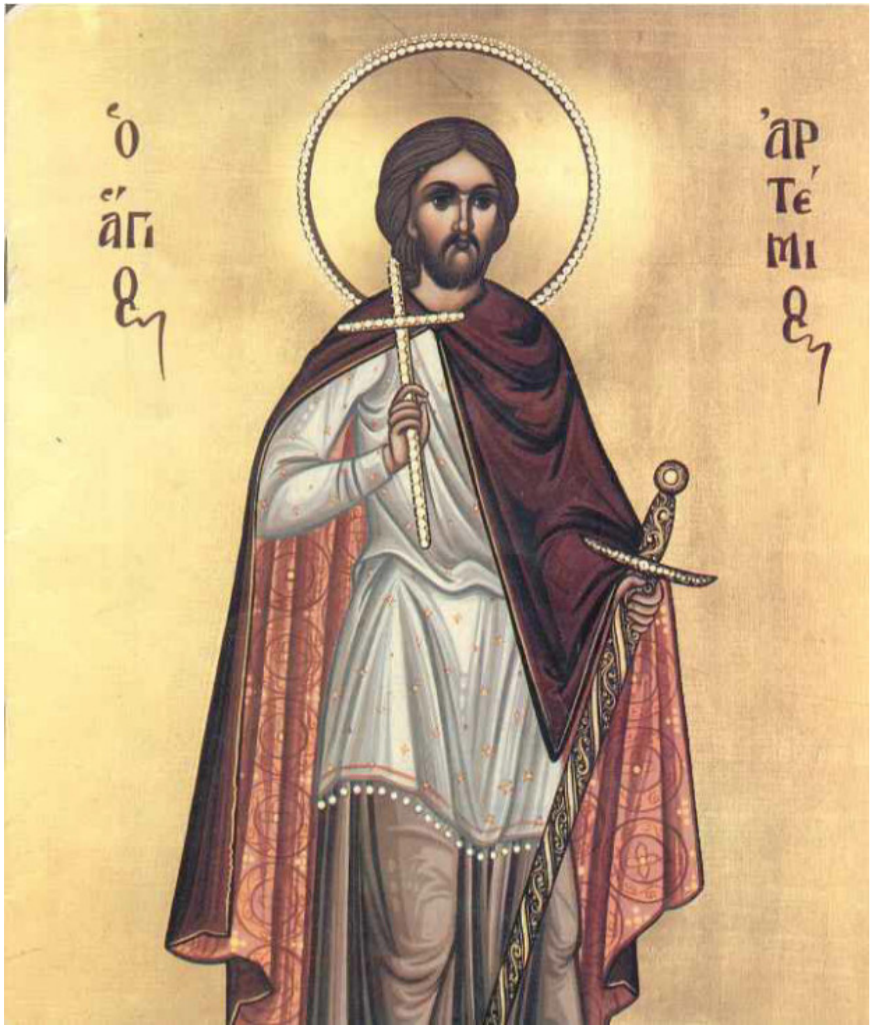
Ἅγιος Ἀρτέμιος ὁ Μεγαλομάρτυρας