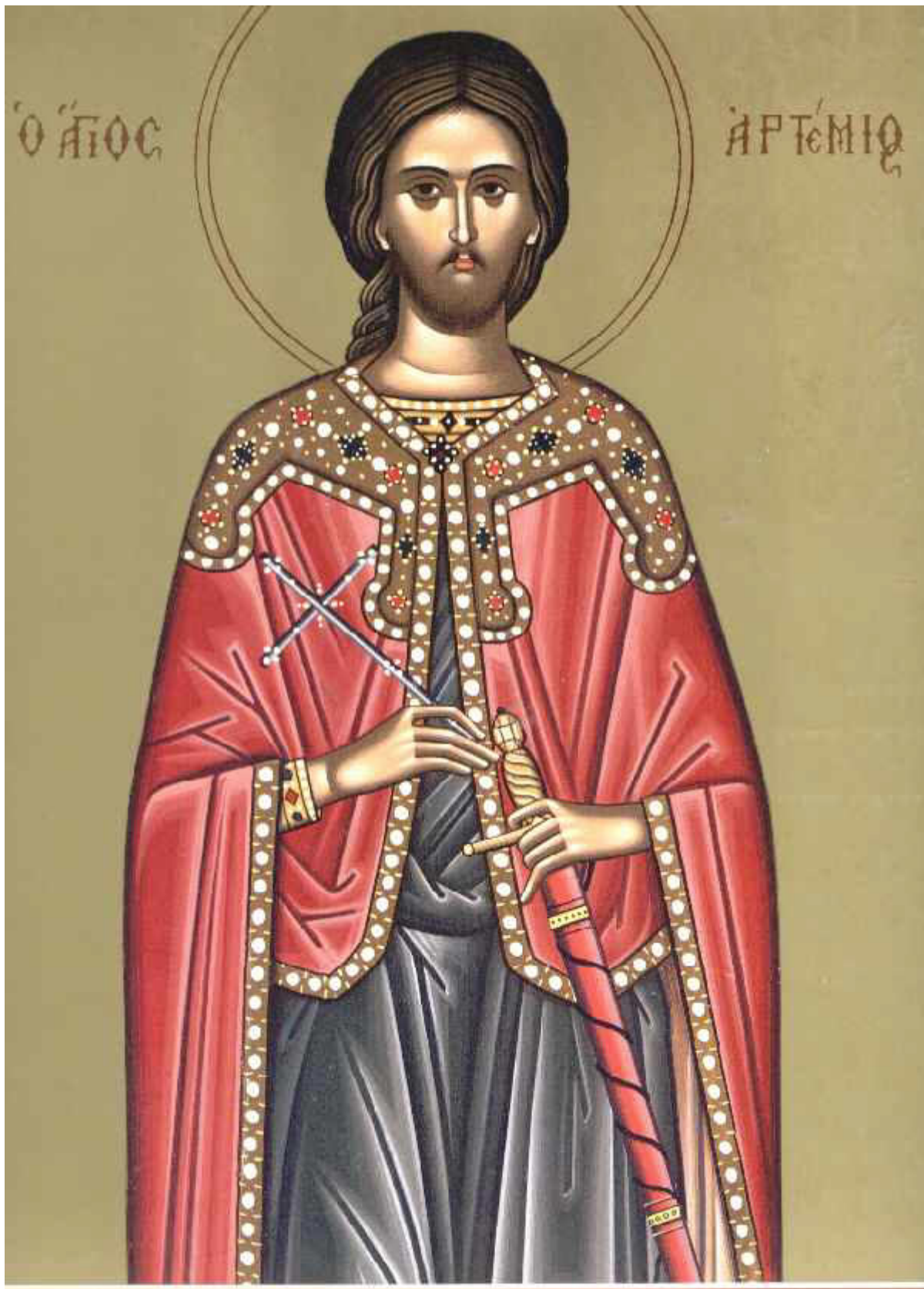
Άγιος Αρτέμιος ο Μεγαλομάρτυρας