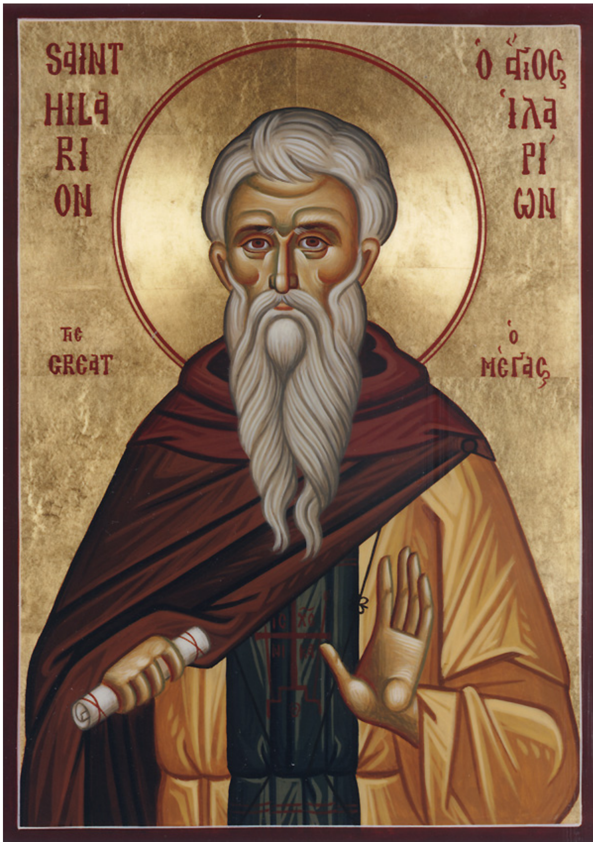
Όσιος Ιλαρίων ο Μέγας

Εορτάζει στις 21 Οκτωβρίου εκάστου έτους.