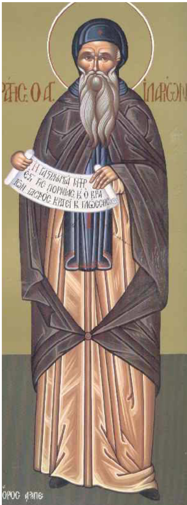
Όσιος Ιλαρίων ο Μέγας