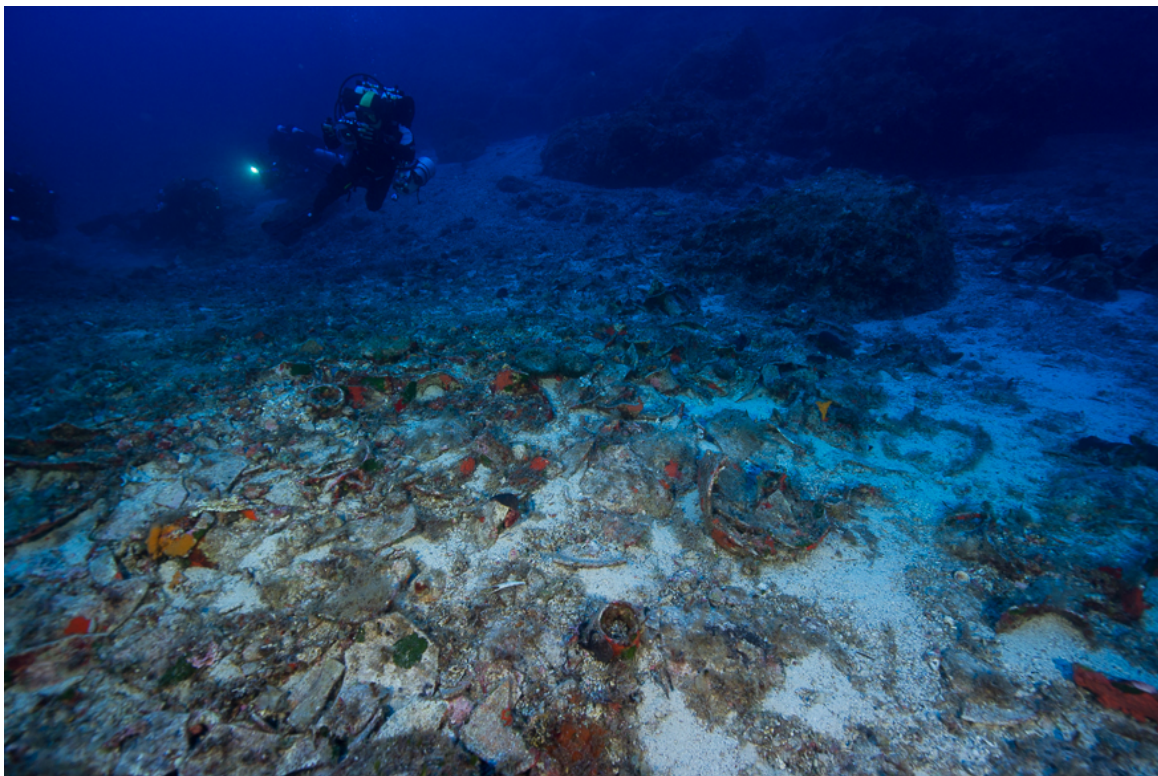
Γενική άποψη του χώρου του ναυαγίου

Στις 16 Σεπτεμβρίου ολοκληρώθηκε η φετινή περίοδος έρευνας του Ναυαγίου των Αντικυθήρων, από την Εφορεία Εναλίων Αρχαιοτήτων με την υποστήριξη του Αμερικάνικου Ωκεανογραφικού Ινστιτούτου Woods Hole. Αξίζει να σημειωθεί ότι για πρώτη φορά δόθηκε η δυνατότητα να γίνει ανασκαφή στο συγκεκριμένο ναυάγιο, με την φυσική παρουσία Ελλήνων και ξένων καταδυόμενων αρχαιολόγων.