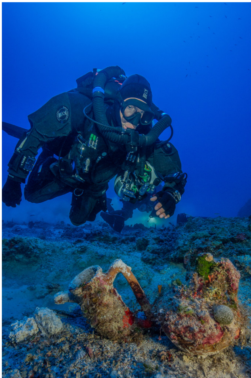
Παρατήρηση αγγείων από μέλος της ερευνητικής ομάδας

Η ανίχνευση μετάλλων προσδιόρισε την έκταση της διασποράς ανιχνεύσιμων μεταλλικών στόχων σε μία έκταση περίπου 40 X 50μ., αν και δεν έχει ολοκληρωθεί πλήρως. Η έκταση αυτή φαίνεται να προσδιορίζει και τη συνολική πιθανή διασπορά του φορτίου του ναυαγίου και αποτελεί ένδειξη για το πιθανό μέγεθός του.