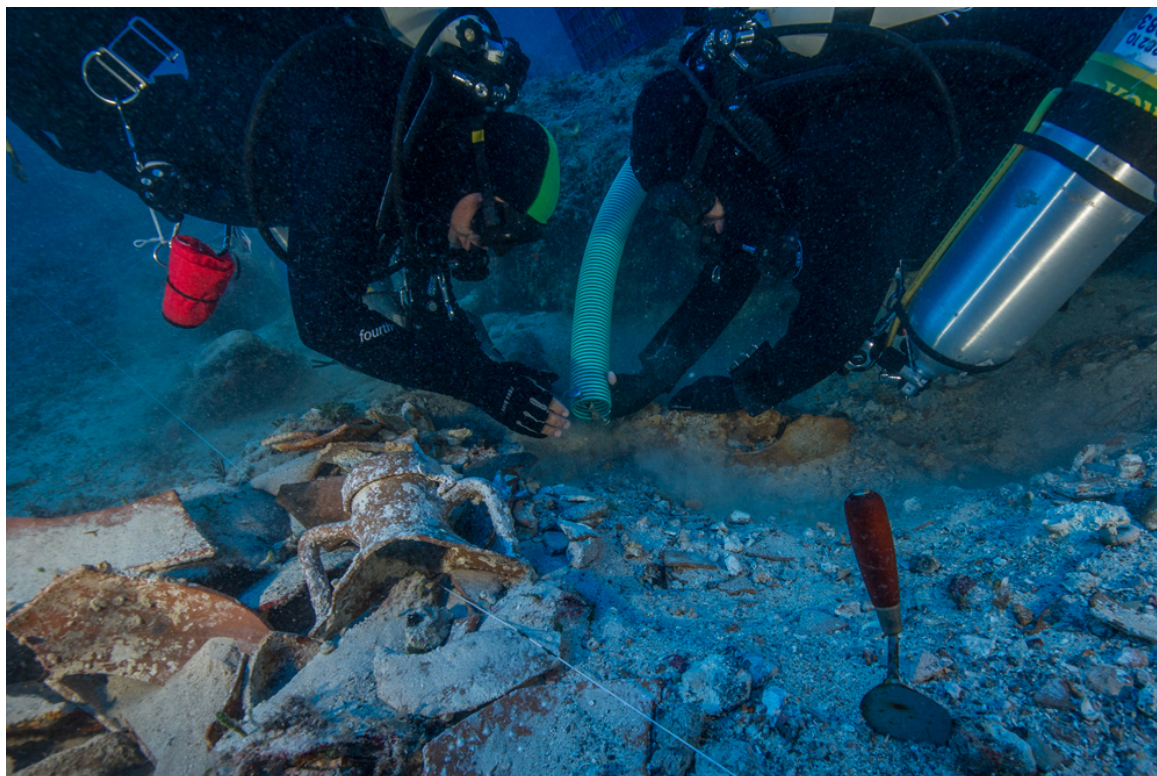
Ανασκαφικός καθαρισμός γύρω από λίθινο αντικείμενο

Διενεργήθηκαν, επίσης, καθαρισμοί σε εννέα σημεία με αφορμή την παρουσία ορατών στην επιφάνεια αντικειμένων ή για την διερεύνηση στόχων που προέκυψαν από την ανίχνευση μετάλλων. Από τον ευρύτερο χώρο του ναυαγίου εντοπίστηκαν, σημάνθηκαν, τεκμηριώθηκαν και ανελκύστηκαν ανάμεσα σε άλλα ένας ολόκληρος αμφορέας, ένας μεγάλος δακτύλιος απελευθέρωσης άγκυρας, ενδεικτικός για το μέγεθος της άγκυρας για την οποία προοριζόταν, δύο ένθετοι μολύβδινοι στύποι[1] άγκυρας, η θέση των οποίων αποτελεί ένδειξη για την κατεύθυνση κατάληξης του σκάφους στο βυθό, μικρή λίθινη τετράπλευρη «βάση» με 12 οπές και αδιάγνωστη μάζα στο εσωτερικό της, μία μικρή λάγυνος[2], συσσωματώματα και σκωρίες[3] σιδερένιων και μπρούτζινων καρφιών και άλλων αντικειμένων, φύλλα μολύβδου από την επιμολύβδωση του σκάφους κ.α.