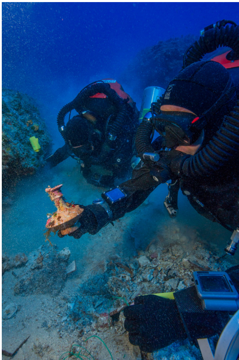
Παρατήρηση αγγείου (λαγύνου) από μέλος της ερευνητικής ομάδας