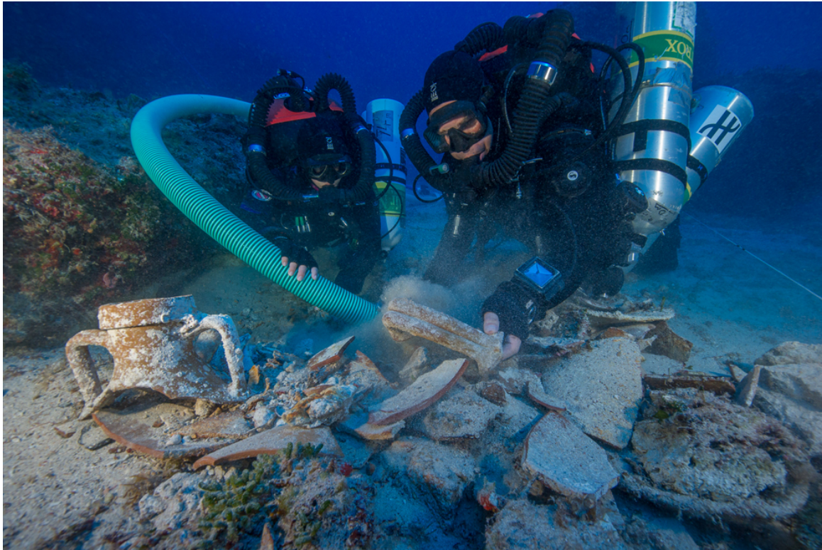
Στιγμιότυπα από την ανασκαφή

Μετά από τις τρεις αποστολές του 1900, 1953, 1976, η για πρώτη φορά συστηματική ανασκαφή στο χώρο του μοναδικού Ναυαγίου των Αντικυθήρων, όπου η υποβρύχια αρχαιολογία έκανε τα πρώτα της βήματα, αποτελεί μια επίπονη διαδικασία. Το μεγάλο βάθος και οι κακές καιρικές συνθήκες, είναι δύο μόνον από τους παράγοντες που δυσκολεύουν την έρευνα.