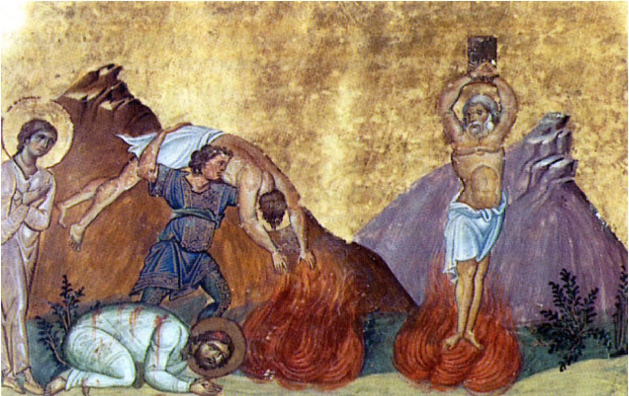
Άγιοι Κάρπος, Πάπυλος, Αγαθόδωρος και Αγαθονίκη

Εορτάζει στις 13 Οκτωβρίου εκάστου έτους.