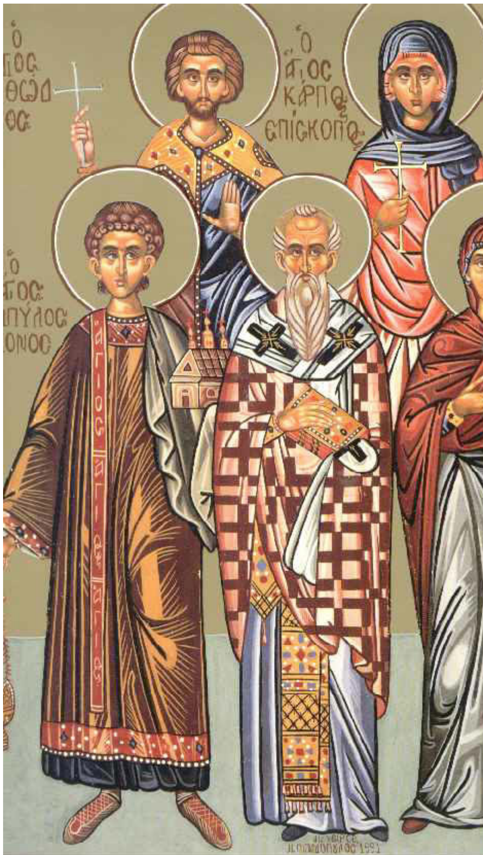
Άγιοι Κάρπος, Πάπυλος, Αγαθόδωρος και Αγαθονίκη