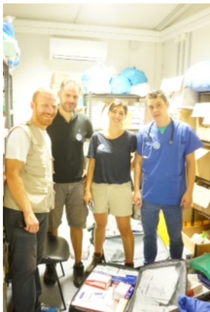
Φαρμακείο στο Μοριά