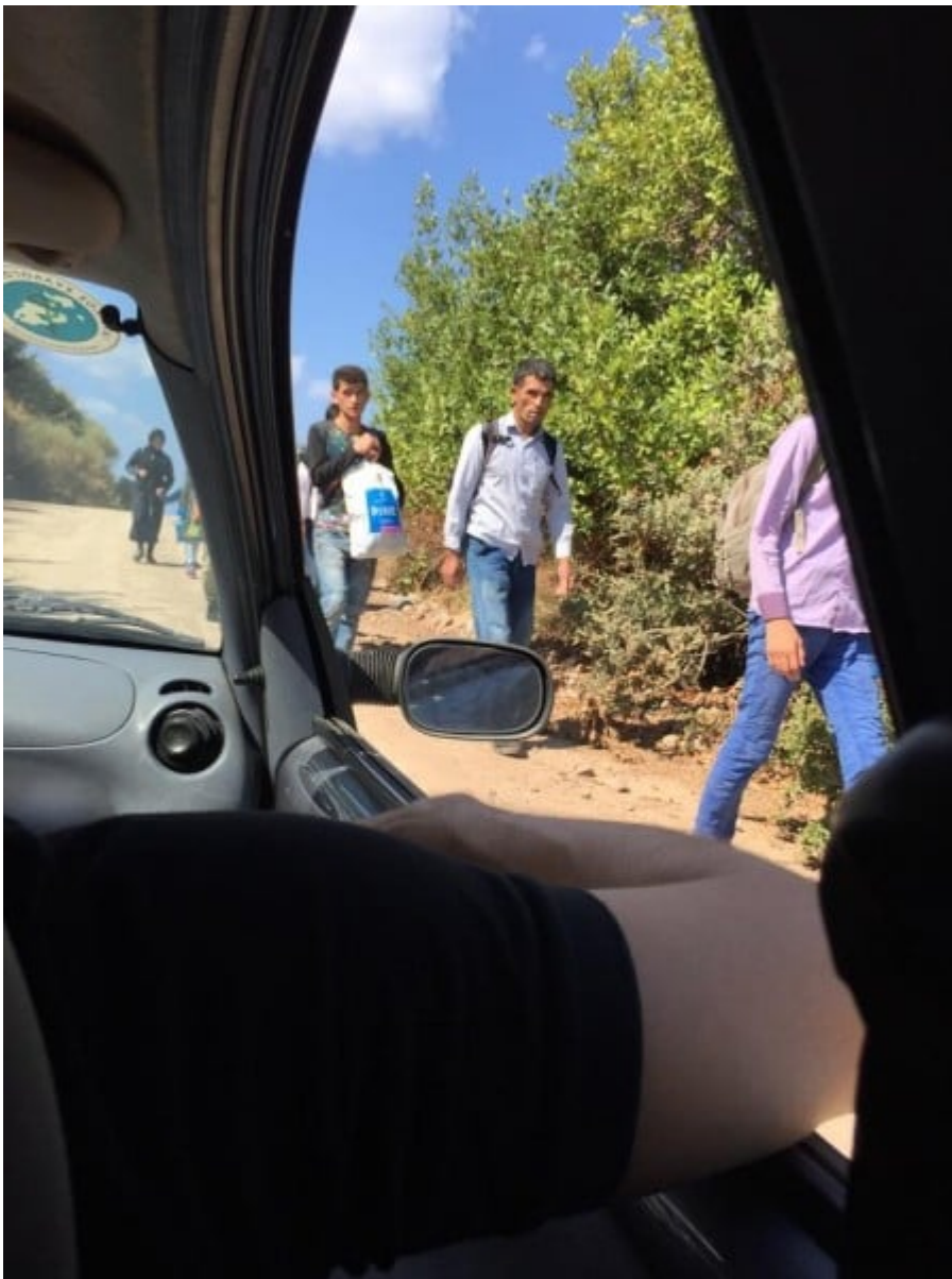
Ο δρόμος από την παραλία Συκαμιάς στη Σκάλα

Λίγο πιο κάτω ήταν τρεις άνθρωποι από μια αποστολή. Σταματήσαμε να τους μιλήσουμε. Είχαν έρθει από την Ολλανδία να βοηθήσουν. Εκείνη τη στιγμή μάζευαν σωσίβια για να έρθει ο Δήμος με το φορτηγάκι να τα περισυλλέξει. Μας μιλούσαν χαμογελώντας χωρίς να σταματούν τη δουλειά τους. Παρά τη ζέστη και το τοπίο που σε έπιανε απελπισία, τα μάτια τους χαμογελούσαν και συνέχιζαν.