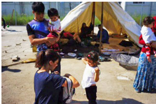
Καραμέλες στο Μοριά

Εκεί ήταν ένας σκωτσέζος μηχανικός γύρω στα εβδομήντα που κατασκεύαζε με την ομάδα του λυόμενους κοιτώνες, εγκαταστάσεις για ηλεκτρικό και αποχέτευση, καθώς και μια παιδική χαρά. Μία ομάδα γυναικών από την Αμερική απασχολούσε τα παιδιά, παίζαν μαζί τους και κάνανε χειροτεχνίες. Στο ίδιο χώρο ήταν και τα γραφεία καταγραφής από όπου παίρνανε τα χαρτιά τους και κάποιες τσίγκινες ντουζιέρες, γυναίκες που πλένανε τα ρούχα τους. Μας χαιρετούσαν και μας χαμογελούσαν.