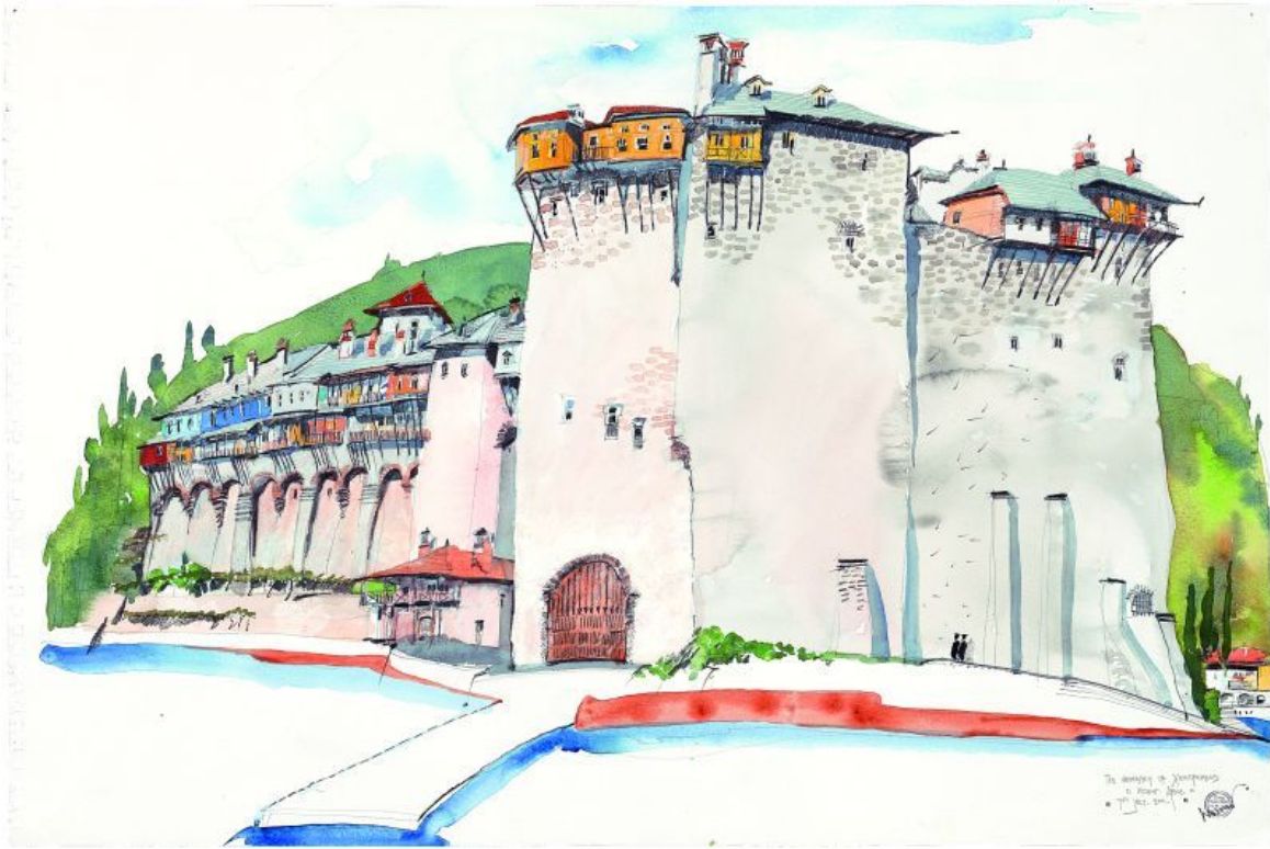
Ιερά Μονή Ξενοφώντος

Ο Paterson επισκέφθηκε για πρώτη φορά το Άγιο Όρος το 2002 και μέχρι σήμερα το έχει περιηγηθεί περισσότερες από 10 φορές, κερδίζοντας τον σεβασμό και την εμπιστοσύνη τόσο των μοναχών όσο και της Ιεράς Κοινότητας, που του έχουν χορηγήσει μια ειδική άδεια η οποία του επιτρέπει να επισκέπτεται για να σχεδιάζει και να ζωγραφίζει τα 20 Ιερά Καθιδρύματα. Είναι η πρώτη φορά που κάτι τέτοιο επιχειρήθηκε, αν εξαιρέσει κανείς τον Ρώσο μοναχό Βασίλειο Γκρηγόροβιτς Μπάρσκι που του είχε διατεθεί παρόμοια άδεια το 1745.