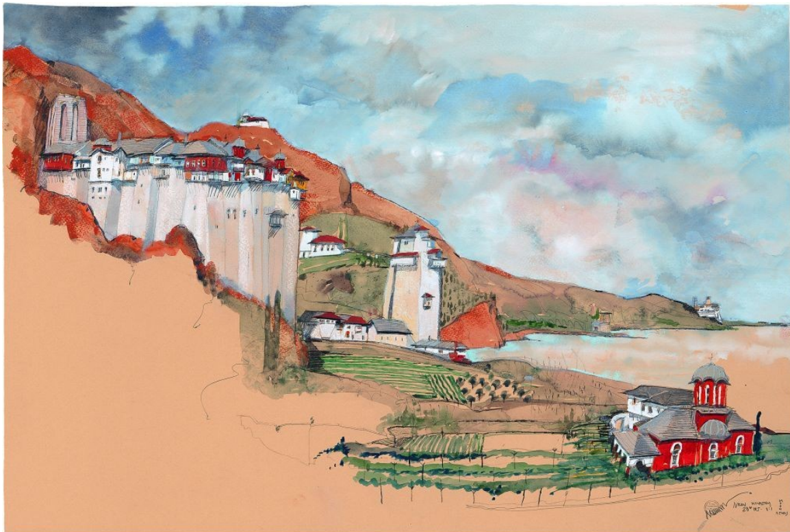
Ιερά Μονή Ιβήρων

Η Αγιορειτική Εστία Θεσσαλονίκης, συμμετέχοντας στο πρόγραμμα των δράσεων του Δήμου Θεσσαλονίκης, για την προώθηση της πόλης ως τουριστικού προορισμού, διοργανώνει σε συνεργασία με τον Δήμο Καλαμάτας, Έκθεση έργων του Βρετανού Ζωγράφου - Αρχιτέκτονα Doug Patterson με τον τίτλο «Ζωγραφίζοντας σε τόπους ιερούς. Άθως - Σινά». Η Έκθεση θα πραγματοποιηθεί στο Πνευματικό Κέντρο του Δήμου Καλαμάτας, θα εγκαινιαστεί στις 22 Οκτωβρίου 2015 και θα έχει διάρκεια έως τις 13 Νοεμβρίου 2015. Η Έκθεση, είχε πρωτοπαρουσιαστεί στους Εκθεσιακούς χώρους της Αγιορειτικής Εστίας το 2011 και από τότε έχει εκτεθεί και σε άλλους χώρους τόσο στην Ελλάδα, όσο και στο εξωτερικό.