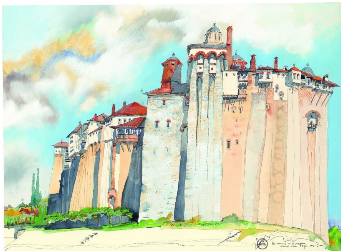
Ιερά Μονή Χιλανδαρίου

του από το Άγιον Όρος και την Ιερά Μονή της Αγίας Αικατερίνης Σινά, ακολουθώντας τα βήματα του Ρώσου περιηγητή των αρχών του 18 ου αιώνα Βασίλι Μπάρσκι. Η ζωγραφική του, ιδιαίτερη, φωτεινή με τολμηρή γραμμή και λαμπρά χρώματα, υπηρετεί με τον πιο πετυχημένο τρόπο την ομορφιά, τον πλούτο, το μεγαλείο των κτισμάτων, αλλά και την ταπεινότητα, την εσωστρέφεια και την αφιέρωση των Μοναχών.