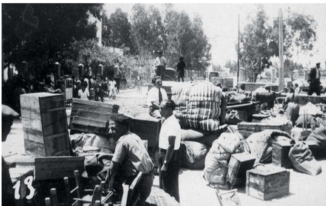
Φυγή από την Αλεξανδρέττα με προορισμό τη Συρία.