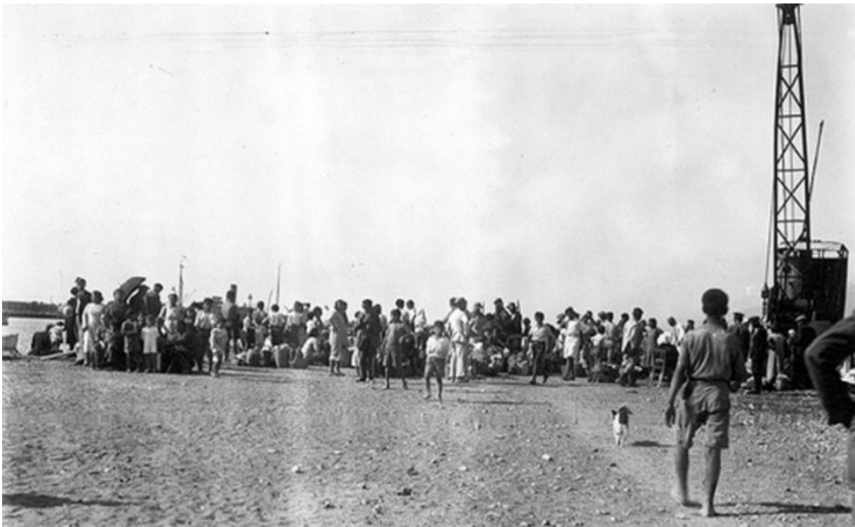
Αρμένιοι πρόσφυγες περιμένουν στο λιμάνι της Αλεξανδρέττας να επιβιβαστούν για τη Συρία και το Λίβανο, το 1939.

Μέχρι τα τέλη του 1940, 48.000 κάτοικοι εγκαταλείπουν τις εστίες τους και καταφεύγουν στο Λίβανο και τη Συρία. Μεταξύ αυτών και 11.000 με 12.000 ήταν Έλληνες, ενώ 26.000-27.000 ήταν Αρμένιοι. Οι περισσότεροι Έλληνες βρήκαν καταφύγιο στη Δαμασκό και στο Χαλέπι.