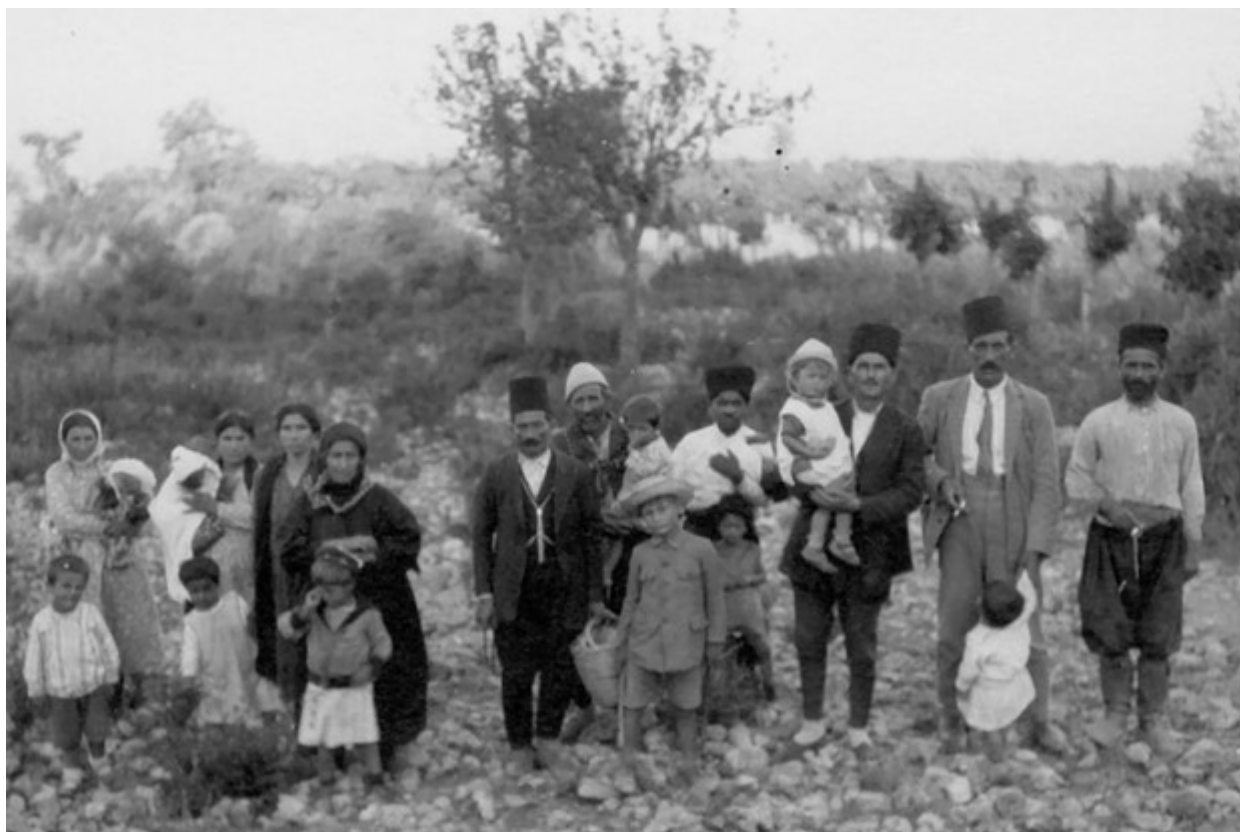
Αρμένιοι πρόσφυγες από την Τουρκία βρίσκουν προσωρινό καταφύγιο στην Αλεξανδρέττα, πριν διωχθούν για δεύτερη φορά μετά την προσάρτηση από την Τουρκία.