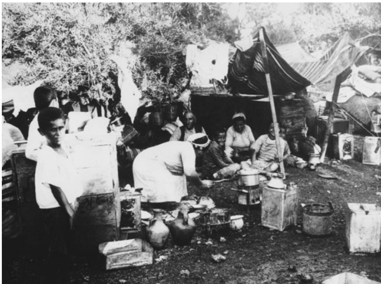
Πρόσφυγες της Αλεξανδρέττας σε προσωρινή εγκατάσταση στη Συρία την ώρα που τουρκικά στρατεύματα καταλαμβάνουν και τα τελευταία εδάφη του σαντζάκιου, τον Αύγουστο του 1939.