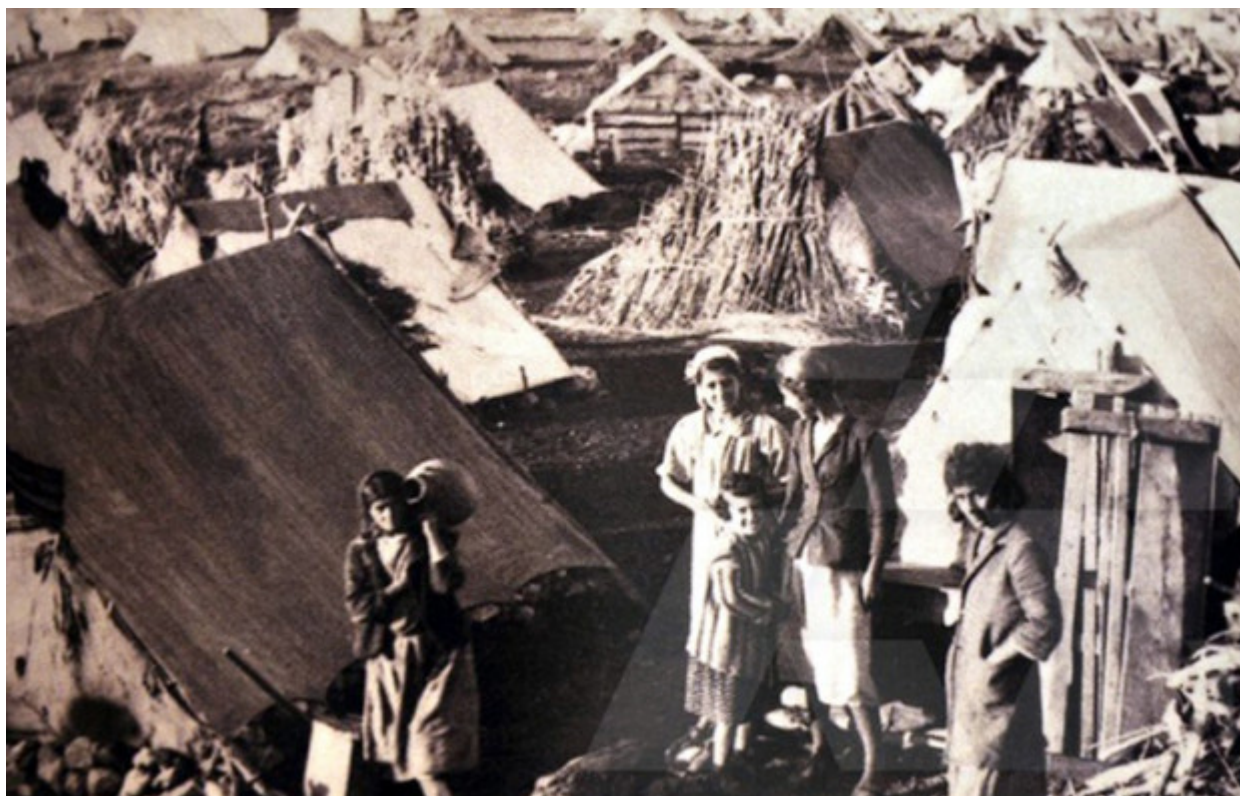
Πρόσφυγες από την Αλεξανδρέττα στην Αντζάρ, στην Κοιλάδα Μπέκαα, το 1940.