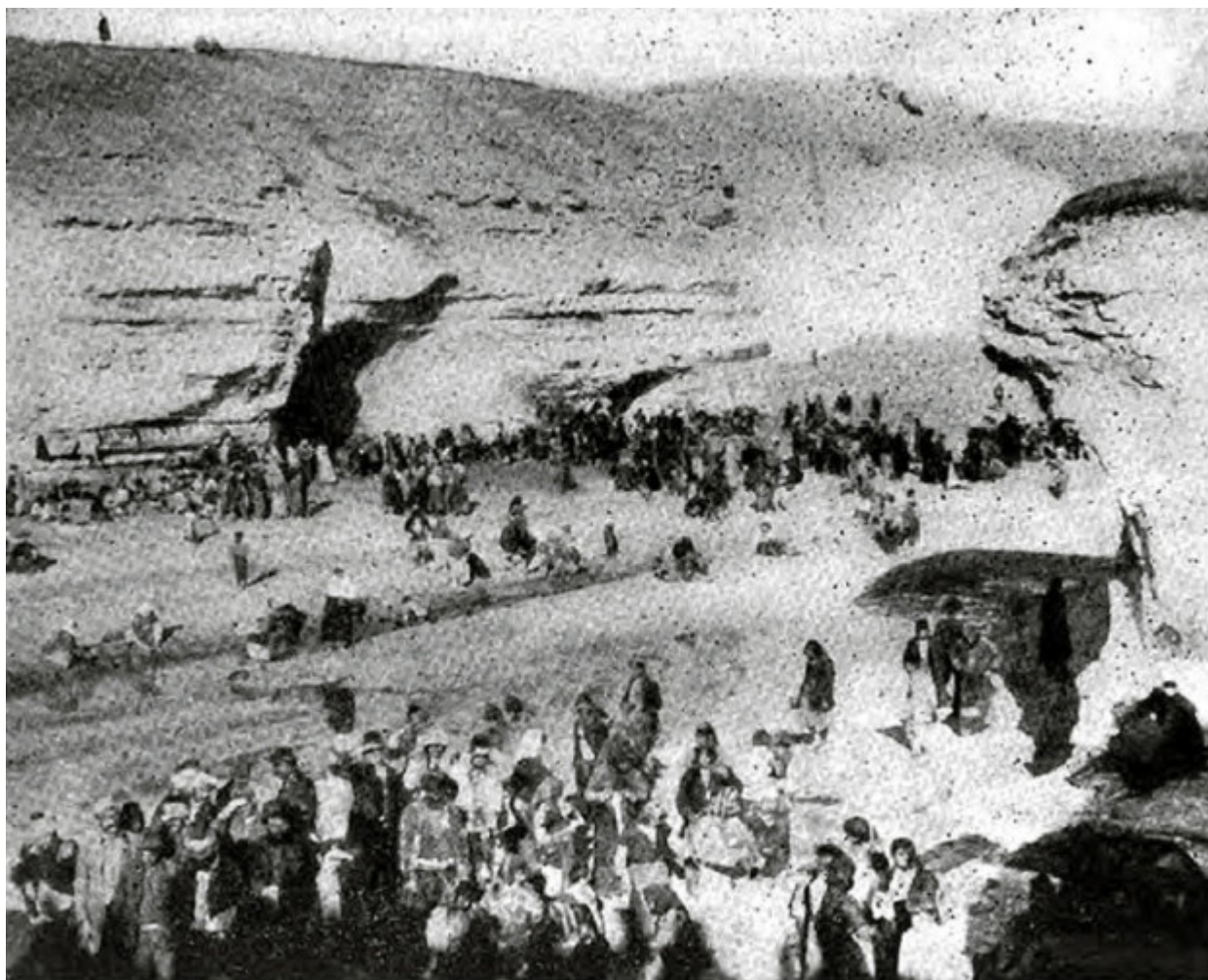
Περίπου 8.000 Έλληνες πρόσφυγες από την Ανατολία βρίσκουν καταφύγιο σε σπηλιές κοντά στο Χαλέπι.