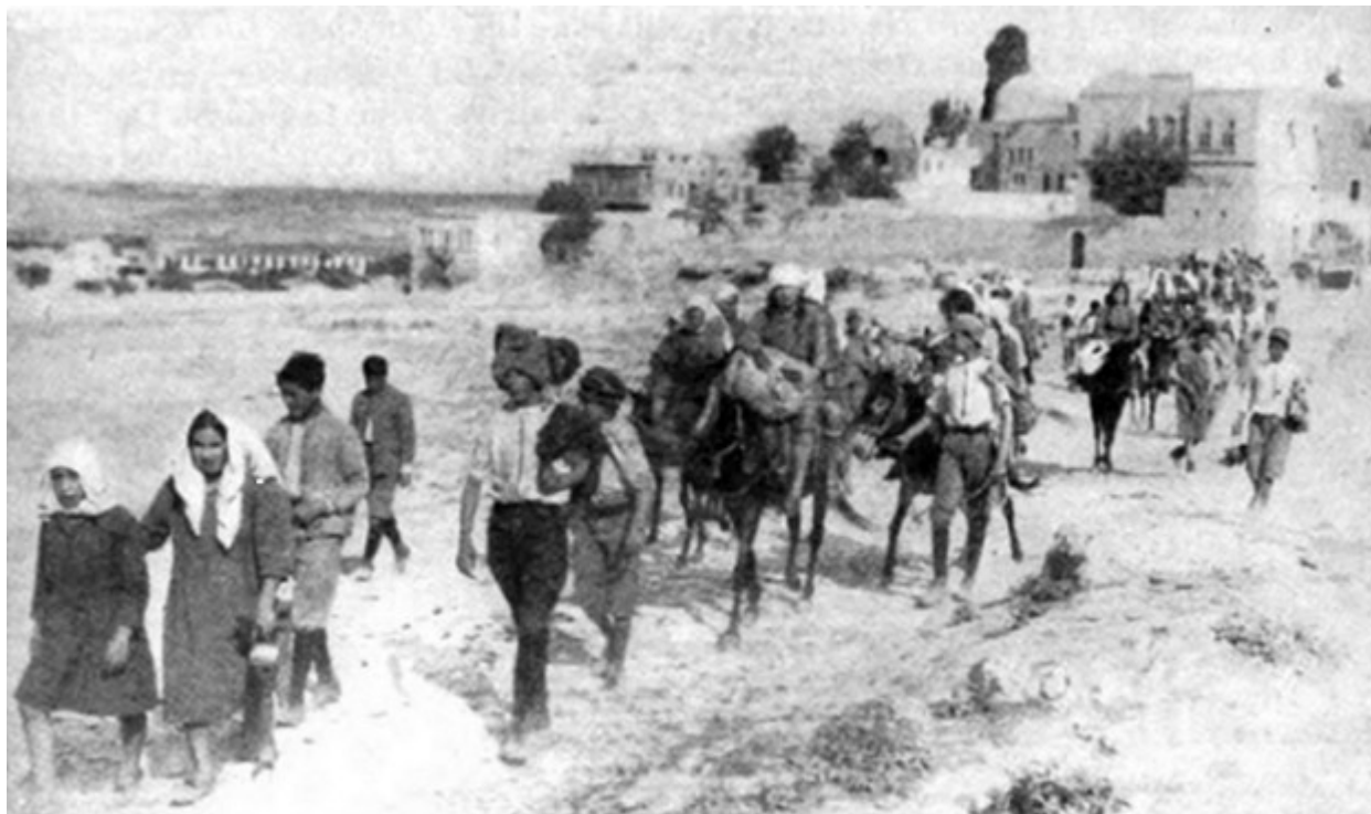
Πορεία επιζησάντων της Γενοκτονίας από το Χαρπούτ της Τουρκίας στο δύσκολο δρόμο προς το Χαλέπι, που βρίσκεται σε απόσταση 800 χιλιομέτρων.