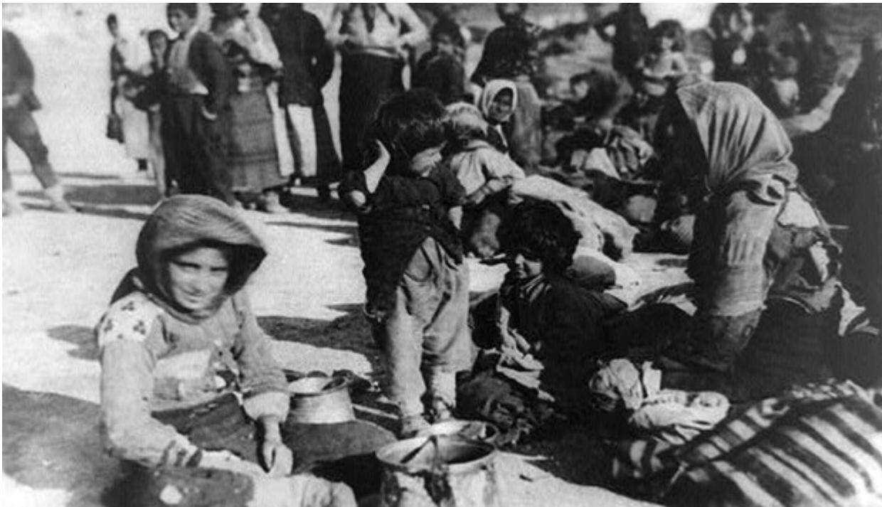
Πρόσφυγες από την Ανατολία στο Χαλέπι της Συρίας.

Πόστερ για τη δωρεά χρημάτων για τους επιζήσαντες από τις γενοκτονίες Αρμενίων, Ελλήνων και Σύρων, μεταξύ 1917-1919.