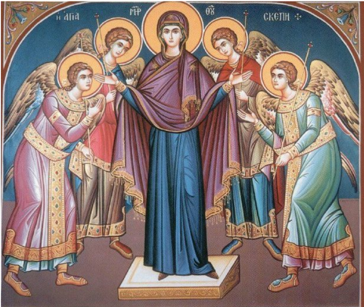
Αγία Σκέπη της Υπεραγίας Θεοτόκου

Εορτάζει στις 28 Οκτωβρίου εκάστου έτους.