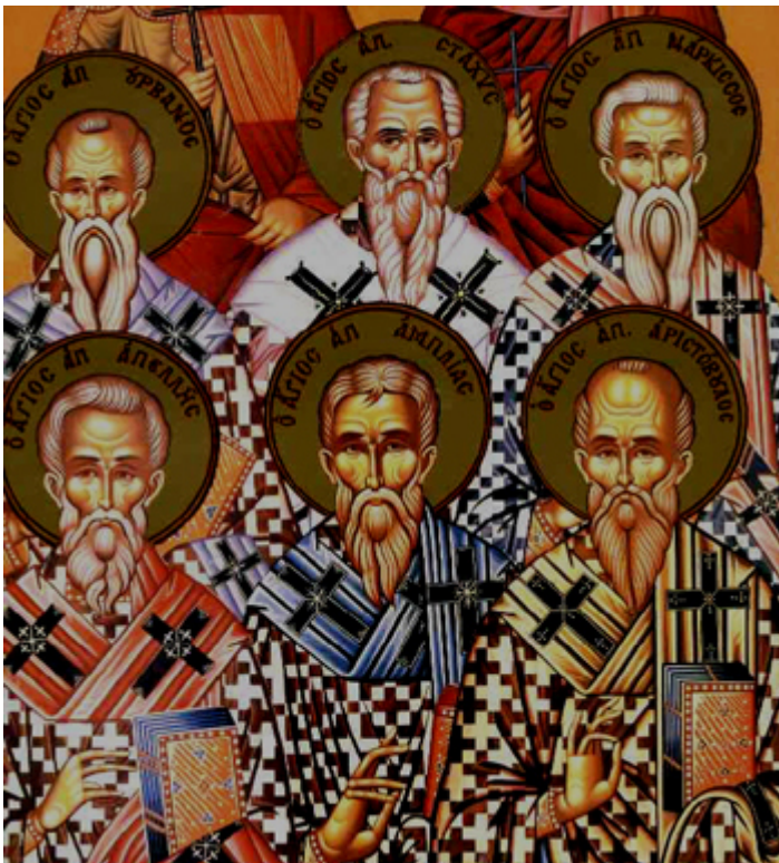
Άγιοι Στάχης, Απελλής, Αμπλίας, Ουρβανός, Νάρκισσος και Αριστόβουλος οι Απόστολοι από τους Εβδομήκοντα

Εορτάζει στις 31 Οκτωβρίου εκάστου έτους.