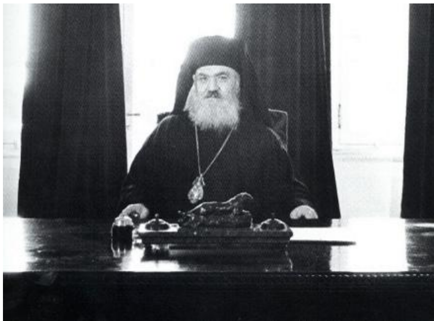
Ο Αρχιεπίσκοπος Δαμασκηνός στο γραφείο του

Μνημείο ηρωισμού και θάρρους, ίσως μοναδικό – σε καμιά άλλη ευρωπαϊκή χώρα δεν υπήρξε ανάλογη αντίδραση από θρησκευτικό ηγέτη – αποτελεί η επιστολή του Αρχιεπισκόπου Δαμασκηνού προς τις Γερμανικές Κατοχικές δυνάμεις, με την οποία ζητά την προστασία των Ελλήνων Εβραίων[2].