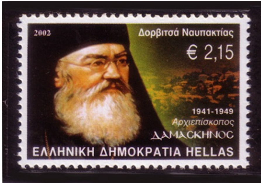
Γραμματόσημο με τον Αρχιεπίσκοπο Δαμασκηνό

«Ο Αρχιεπίσκοπος Δαμασκηνός, τον οποίο τιμάμε σήμερα, δεν έπραξε παρά το καθήκον του ως Χριστιανού και ποιμενάρχου. Εφήρμοσε αυτά τα οποία η θρησκεία μας διδάσκει. Δηλαδή ότι μείζων πασών των αρετών είναι η αγάπη, όπως την δίδαξε ο Ιησούς Χριστός και στην Παραβολή του Καλού Σαμαρείτου και όπως γλαφυρά την περιγράφει ο Απόστολος των Εθνών Παύλος στο 13ο κεφάλαιο της Α' προς Κορινθίους Επιστολής του. Αλλά και η Δικαιοσύνη, την οποία εφήρμοσε ο Αρχιεπίσκοπος Δαμασκηνός, είναι μεγίστη αρετή...», έλεγε ο μακαριστός Αρχιεπίσκοπος Αθηνών και πάσης Ελλάδος κυρός Χριστόδουλος, στις τιμητικές εκδηλώσεις που είχε οργανώσει