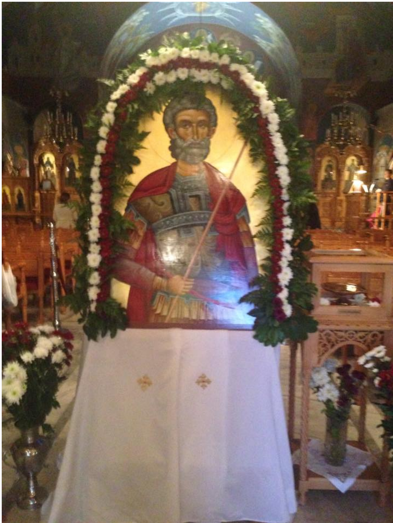
ΙΕΡΑ ΜΗΤΡΟΠΟΛΙΣ Ν.ΙΩΝΙΑΣ - ΦΙΛΑΔΕΛΦΕΙΑΣ