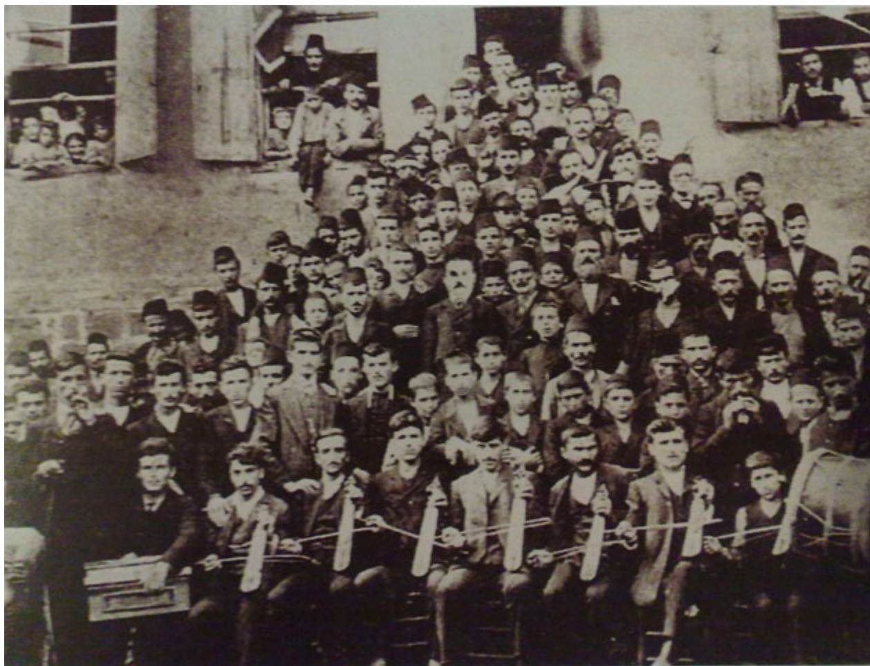
Φροντιστήριο Σουρμένων Ιούλιος 1908.

Στον κορυφαίο βυζαντινολόγο Steven Runciman συναντούμε δύο επισημάνσεις που αναφέρονται στην περίοδο της Τουρκοκρατίας: Η μία αφορά στα αγιορείτικα μοναστήρια και η άλλη στα μοναστήρια του Πόντου. Για τα πρώτα γράφει: «Οι μοναχοί (του Άθωνα) χρησιμοποιούσαν απρόσεχτα τα φύλλα αρχαίων (βαρύτιμων) χειρογράφων για να περιτυλίγουν τα τρόφιμά τους...». Για τα δεύτερα: «Τα μεγάλα ποντιακά μοναστήρια Σουμελά Βαζελώνα και Περιστερέωτα περιποιούνταν και μεγάλωναν τις βιβλιοθήκες τους, ώστε παρέμειναν καλοδιατηρημένα μέχρι και τον 19 ο αιώνα». Όσο θλιβόμαστε για την αμάθεια που επικρατούσε στα πρώτα, τόσο παρηγορούμαστε για τη φιλότιμη προσπάθεια στα δεύτερα.