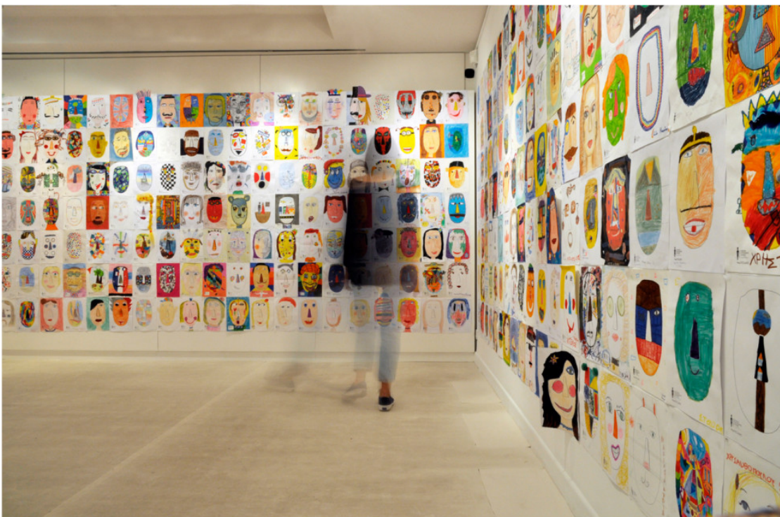
«5000 ζωγραφιές, ένα κυκλαδικό κεφάλι»

Κάποια πρώιμα ειδώλια, που δεν παρουσιάζουν τα παραπάνω στοιχεία σε πλήρη εξέλιξη αποκαλούνται «προ-κανονικά» ενώ υπάρχουν δύο ακόμα τύποι της Πρωτοκυκλαδικής I περιόδου που έχουν πάρει τις ονομασίες του από τα νεκροταφεία όπου εντοπίστηκαν για πρώτη φορά (Πλαστηράς, Λούρος): στον τύπο Πλαστηρά η ανθρώπινη μορφή αποδίδεται με έντονα φυσιοκρατικό τρόπο που θυμίζει νεολιθικά ειδώλια ενώ στον τύπο Λούρου επικρατεί μεγαλύτερη σχηματοποίηση. Αντίθετα, μια σειρά ύστερων ειδωλίων στα οποία παρατηρείται ένας εκφυλισμός των αυστηρών καλλιτεχνικών συμβάσεων της Πρωτοκυκλαδικής I περιόδου (κυρίως ως προς τη στάση των πήξεων αλλά και ως προς το συνολικό τρόπο απόδοσης της μορφής) αποκαλούνται «μετα-κανονικά».