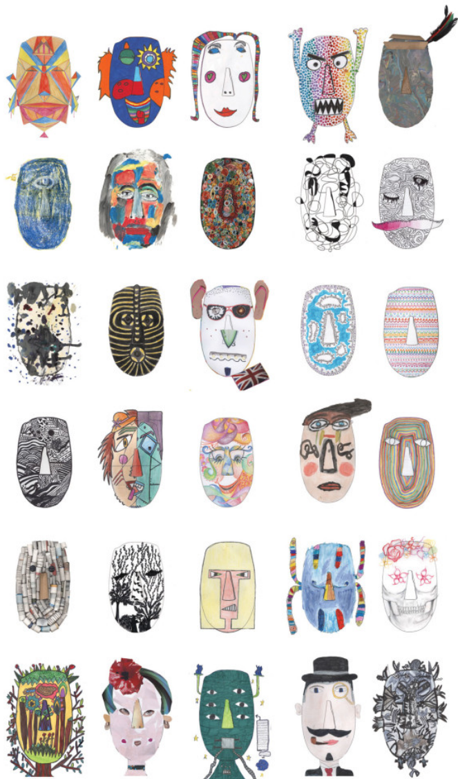
Η αφίσα με τα έργα που διακρίθηκαν

τους μόνο ως προς τον τρόπο απόδοσης συγκεκριμένων λεπτομερειών. Τα «κανονικά» ειδώλια ποικίλλουν από μικροσκοπικά παραδείγματα ύψους λίγων μόλις εκατοστών μέχρι γλυπτά σχεδόν φυσικού μεγέθους. Τα περισσότερα, πάντως, δεν ξεπερνούν τα 40 εκ. σε ύψος.