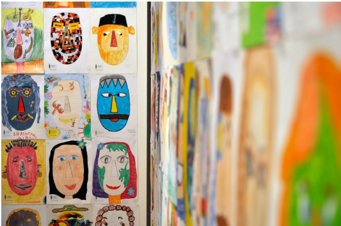
«5000 ζωγραφιές, ένα κυκλαδικό κεφάλι»

Τριάντα ήταν οι νικητές του διαγωνισμού, καθώς τριάντα είναι και τα χρόνια του Μουσείου που συμπληρώνονται το 2016. Οι μαθητές που διακρίθηκαν, είδαν τα έργα τους να πρωταγωνιστούν στη φετινή αφίσα των εκπαιδευτικών προγραμμάτων του Μουσείου.