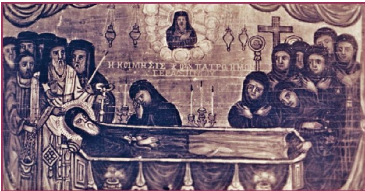
Η κοίμηση του Αγίου Γερασίμου. Διακρίνονται οι πενθούσες μοναχές της συνοδείας του.