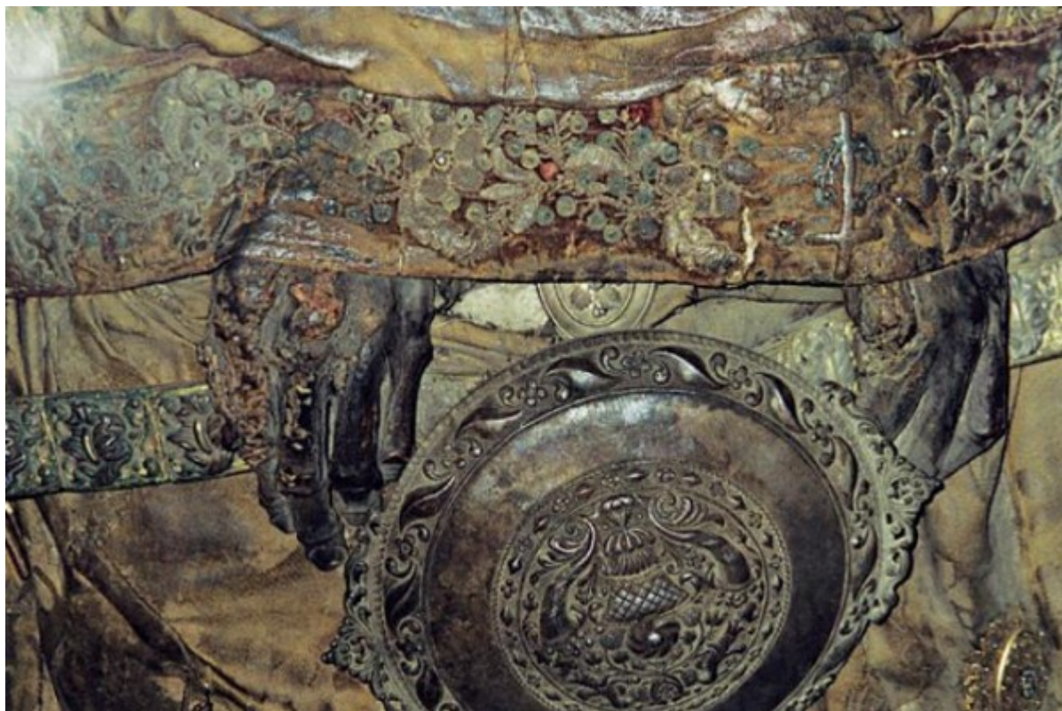
Λεπτομέρεια από τις παλάμες του άφθαρτου λειψάνου του Αγίου Γερασίμου.

Η τοπική Εκκλησία γιορτάζει τον Άγιο Γεράσιμο από τις 16 έως τις 23 Αυγούστου [5] και από τις 20 έως τις 26 Οκτωβρίου [6] . Κατά τις ημέρες αυτές, όπως και την περίοδο από το Σάββατο του Λαζάρου ως και την Κυριακή του Θωμά, ο Άγιος παραμένει όρθιος μέσα στην κρυστάλλινη λειψανοθήκη και μπροστά στην νότια θύρα του Ιερού Βήματος. Στις 16 Αυγούστου, στις 20 Οκτωβρίου και την Κυριακή του Θωμά λιτανεύεται έως τον Μεγάλο Πλάτανο και τοποθετείται επάνω στο Πηγάδι. Τότε συμβαίνει το εξής παράδοξο: υπερχειλίζει το νερό του πηγαδιού και ο πλάτανος χαμηλώνει τα κλαδιά του. Έτσι οι πιστοί παίρνουν νερό για αγίασμα και φύλλα για φυλακτά. Στις 23 Αυγούστου και στις 26 Οκτωβρίου λιτανεύεται ως τα αλώνια. Τότε θεραπεύονται πολλοί ασθενείς, ιδιαίτερα μάλιστα δαιμονισμένοι.