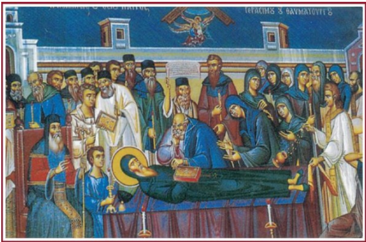
Η κοίμηση του Αγίου Γερασίμου. Τοιχογραφία στο παλαιό Καθολικό της Μονής.

Έκτοτε προσκυνείται για περισσότερα από πεντακόσια χρόνια μαρτυρώντας με την αφθαρσία, την ευωδία και την θαυματουργία του τα μεγαλεία και την δόξα του Θεού. Το λείψανο είναι ντυμένο με τα ιερατικά άμφια της ταφής του Αγίου και εκτίθεται προς προσκύνηση μέσα σε κρυστάλλινη λειψανοθήκη, η οποία ενσωματώνεται σε μεγαλύτερη, αργυρή περίτεχνη λάρνακα. Αυτή βρίσκεται στον τάφο του Αγίου, ο οποίος με το πέρασμα του χρόνου περιλήφθηκε στον χώρο του παλαιού Καθολικού της Μονής.