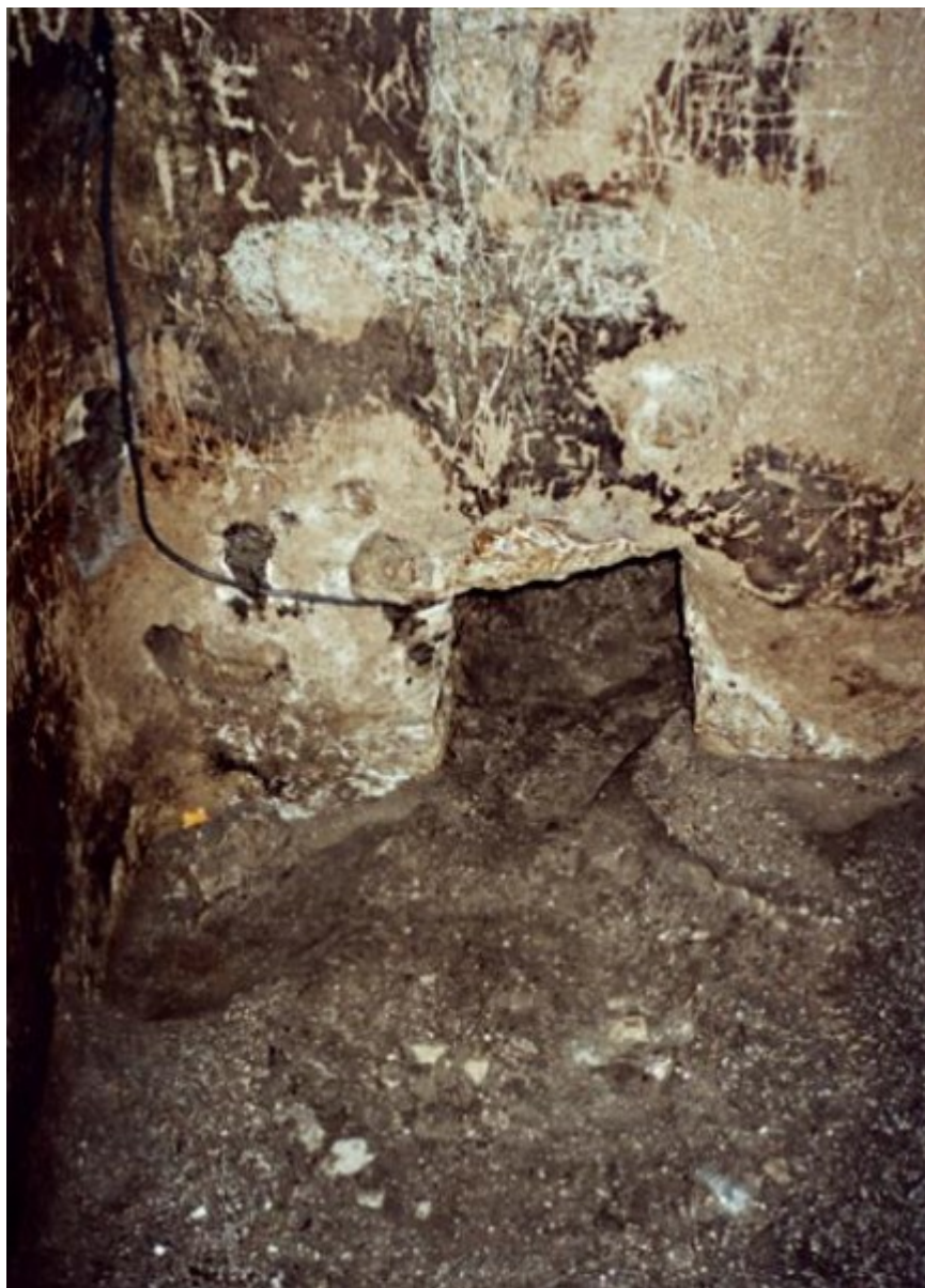
Είσοδος του σπηλαίου ασκήσεως του Αγίου Γερασίμου