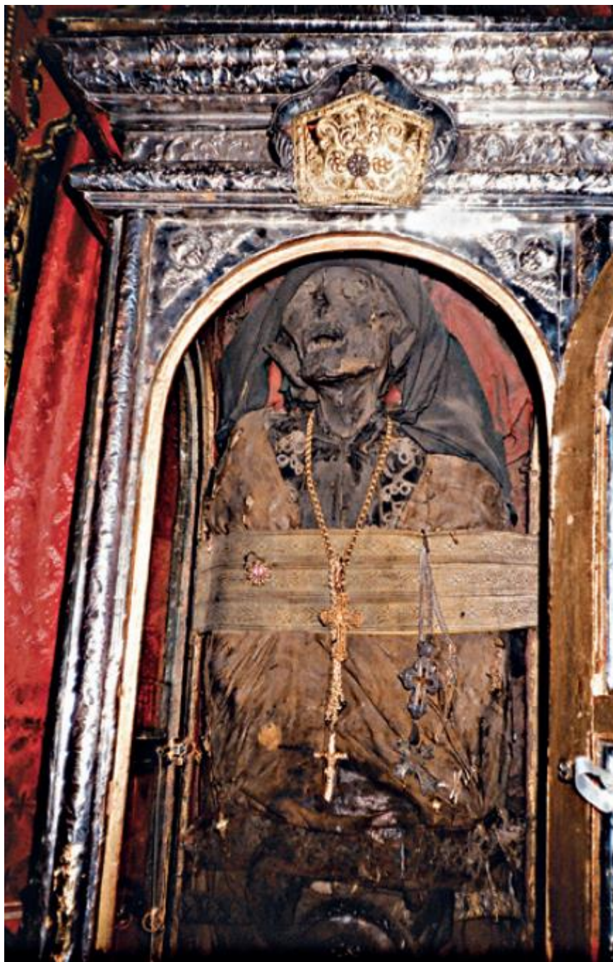
Το Ιερό Λείψανο του Αγίου Γερασίμου (όρθιο στην νότια θύρα, Πάσχα 1994).

Τρία χρόνια μετά την αγιοκατάταξη του Αγίου (το έτος 1625), τυπώθηκε στο Λονδίνο με επιμέλεια και δαπάνη του Επισκόπου Ιερεμίου η πρώτη βιογραφία του Αγίου βάσει της οποίας ο Ιερομόναχος Μητροφάνης ο Ναύπλιος συνέταξε την πρώτη Ακολουθία του Αγίου που τυπώθηκε στην Βενετία το 1704. Άλλη Ακολουθία συνέταξε ο Ζακύνθιος Ιερέας Νικόλαος Γαβριηλόπουλος που εκδόθηκε στην Βενετία το 1718 ενώ στις μέρες μας Ακολουθία και έτερα υμνογραφήματα συνέταξε ο Γέροντας Γεράσιμος Μικραγιαννανίτης.