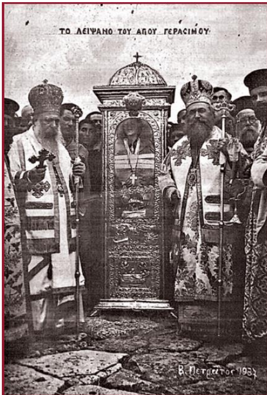
Εορτή του Αγίου Γερασίμου του έτους 1937. Το ιερό λείψανο του Αγίου Γερασίμου μεταξύ του Αθηνών Χρυσσοστόμου Παπαδοπούλου και του Κεφαλληνίας Γερμανού Ρουμπάνη.

Το 1780 ο Ιεροδιάκονος Νεόφυτος από τα Καλάβρυτα που υπέφερε από σεληνιασμό ήρθε στην Μονή και παρέμεινε για ένα χρόνο προσευχόμενος και τρώγοντας μόνο ψωμί και νερό. Ο Άγιος τον θεράπευσε και εκείνος χειροτονήθηκε ιερέας και εξυπηρέτησε την Μονή για πολλά χρόνια ως εφημέριος. Στα 1785 μία μητέρα από την Κατοχή έφερε στην Μονή την κωφάλαλη κόρη της Σωσάννα που υπέφερε από δαιμονικές κρίσεις. Μετά ένα χρόνο η κόρη άρχισε να φωνάζει με άναρθρες κραυγές, να κάνει φασαρίες, να υβρίζει, να διακόπτει την λειτουργία. Παρ' όλες τις συστάσεις του ιερομονάχου Νεοφύτου, η κόρη δεν σταματούσε και έτσι εκείνος την χαστούκισε δυνατά. Το ίδιο βράδυ είδε στον ύπνο του ότι άνοιξε η λάρνακα