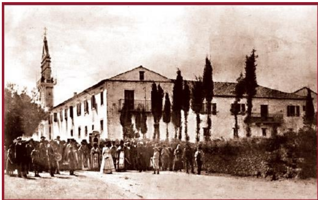
Στιγμιότυπο από λιτανεία του Αγίου Γερασίμου στην προσεισμηκή Ιερά Μονή.