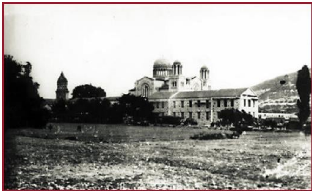
Η προσεισμική Ιερά Μονή Αγίου Γερασίμου.

αναγέννηση, καλεί σε μετάνοια και δημιουργεί κλίσεις για την ιερατική και μοναχική ζωή. Η Εκκλησία μας στα τροπάρια της ονομάζει τον Άγιο «Ορθοδόξων προστάτην», «εν σώματι άγγελον» και «θαυματουργόν θεοφόρον», ο οποίος «ρώννυσι τους νοσούντας» και «ιάται τους δαιμονώντας». Επίσης τον αποκαλεί «ασύλητον θησαυρόν της Κεφαλληνίας» και «μέγα καύχημα της Ελλάδος».