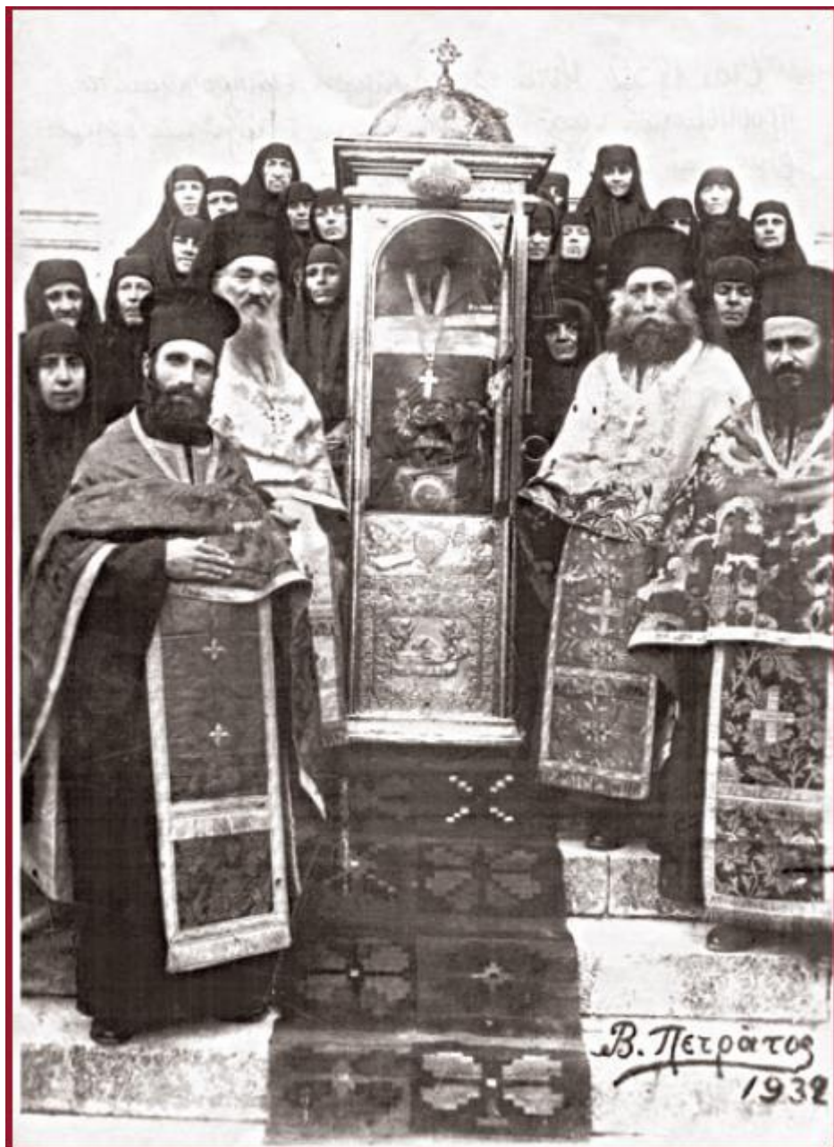
Έτος 1932. Μετά την πανήγυρη, στα προπύλαια του προσεισμικού ναού το ιερό λείψανο μεταξύ των εφημερίων και των αδελφών της Μονής.