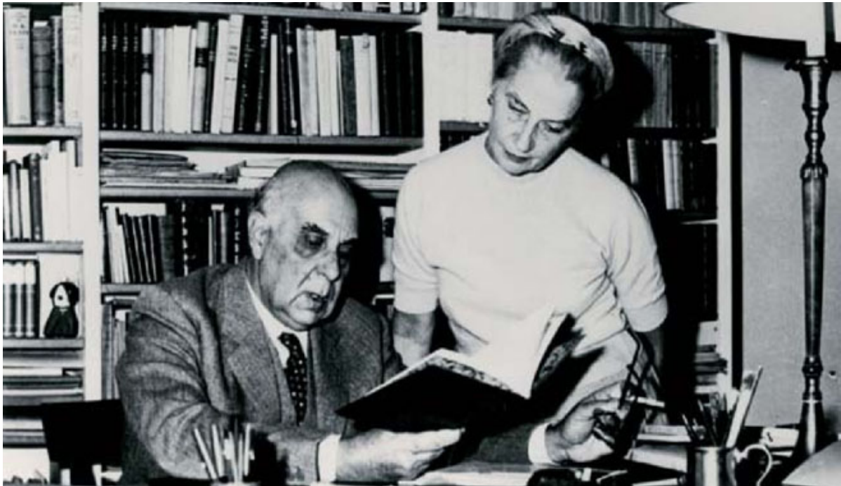
Γιώργος και Μαρώ Σεφέρη, ca. 1963.

Οι Συλλογές και τα Αρχεία της Αμερικανικής Σχολής: Τα αρχεία της Αμερικανικής Σχολής αποτελούνται από δύο διακριτές συλλογές που στεγάζονται χωριστά (στη Γεννάδειο Βιβλιοθήκη και στη Βιβλιοθήκη Blegen) αλλά διευθύνονται από έναν αρχειονόμο.