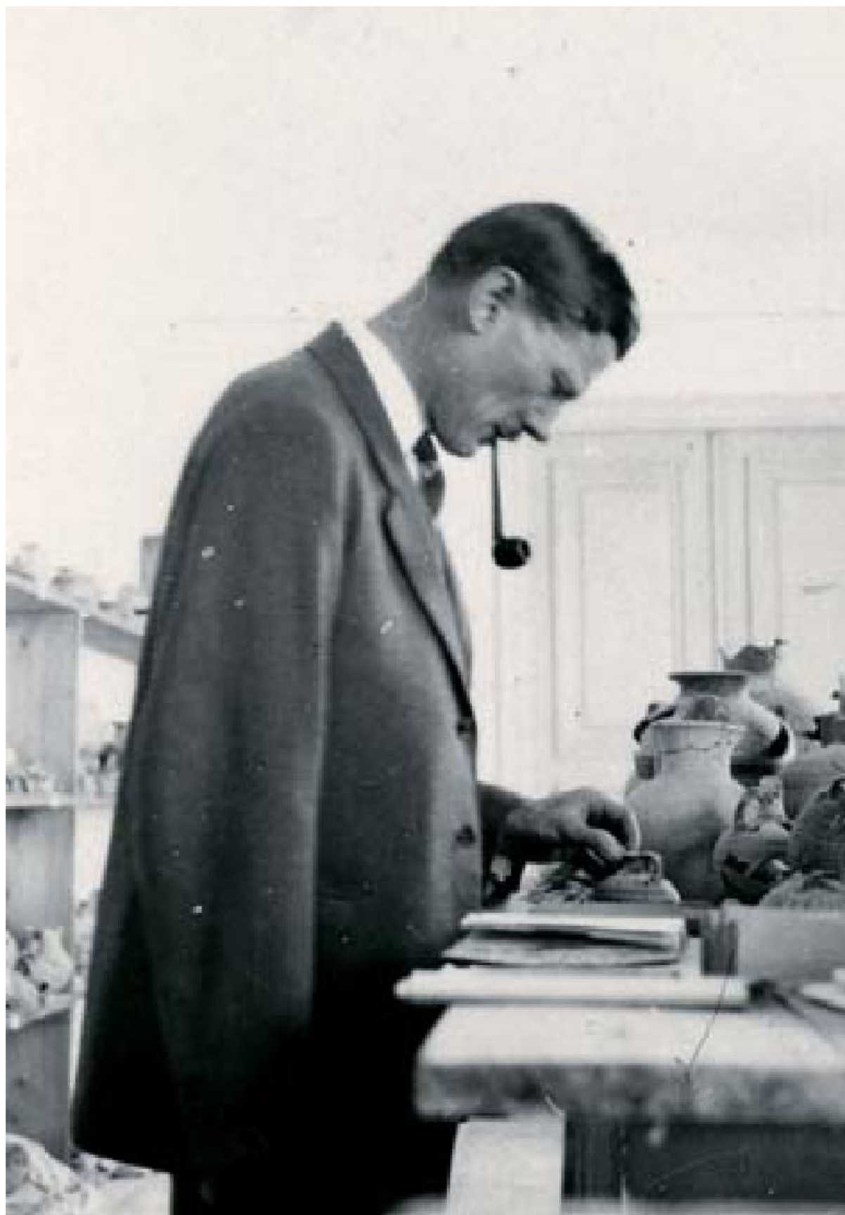
Carl W. Blegen, 1929.

Στο φωτογραφικό αρχείο περιλαμβάνεται μια σπάνια συλλογή από γυάλινες πλάκες που τεκμηριώνει τις αρχαιολογικές έρευνες της Σχολής ανά την Ελλάδα μεταξύ