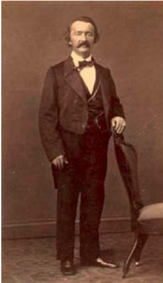
Heinrich Schliemann, ca 1850-1860.