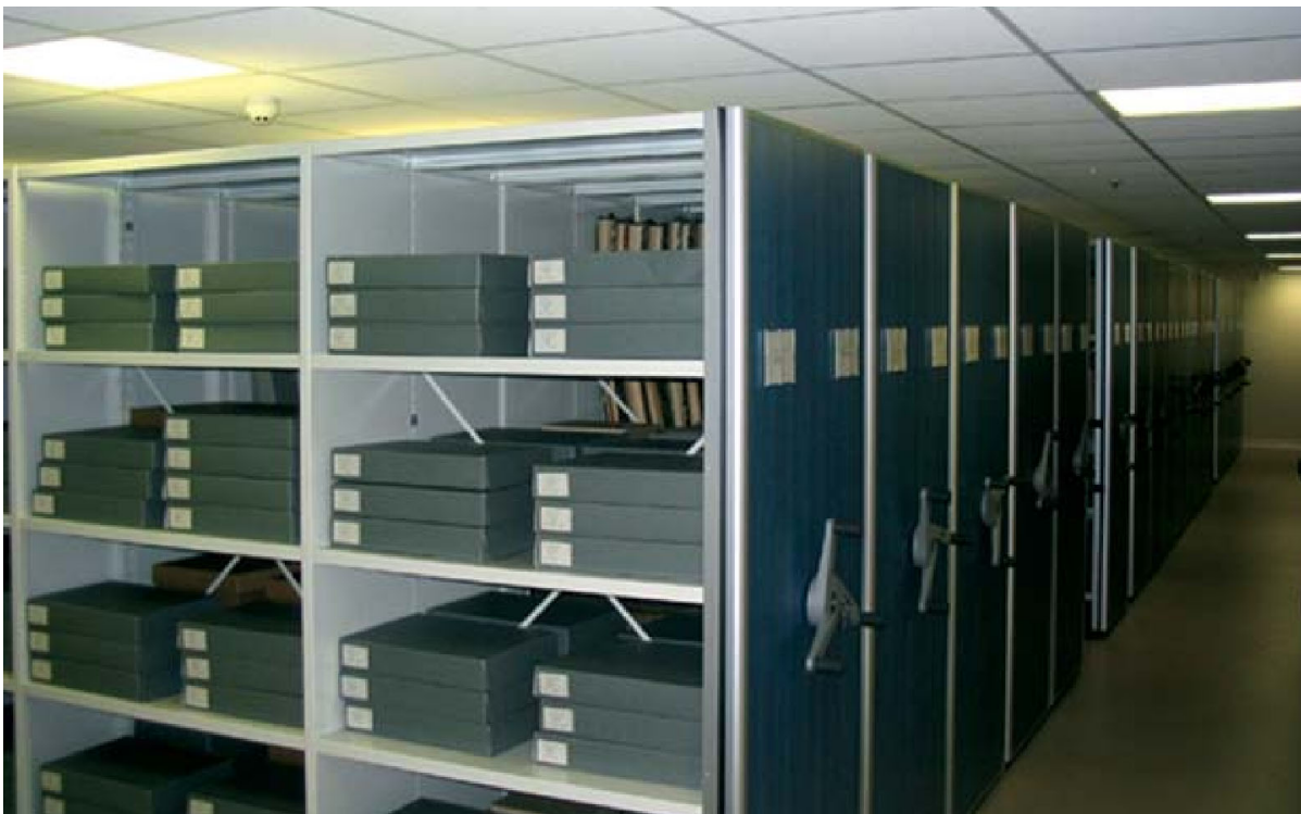
Τα Αρχεία στη Γεννάδειο Βιβλιοθήκη.

των ετών 1880 και 1940 και καταγράφουν μνημεία, ευρήματα και τοπογραφικά στοιχεία που δεν σώζονται πια. Μια δεύτερη σημαντική πηγή φωτογραφικού υλικού είναι η συλλογή της γνωστής αρχαιολόγου και φωτογράφου Alison Frantz. Οι φωτογραφίες της, που χρονολογούνται από τα τέλη της δεκαετίας του 1940 έως τις αρχές της δεκαετίας του 1970, εστιάζουν κυρίως σε αρχαιολογικούς χώρους της Ελλάδας, αρχαϊκά και κλασικά γλυπτά, καθώς και την αρχιτεκτονική της αρχαιότητας. Μεταξύ πολλών αρχαιολογικών σχεδίων σημαντική θέση κατέχει η εκτεταμένη συλλογή υδατογραφιών του Piet de Jong, διάσημου Άγγλου εικονογράφου που εργάστηκε σε πολλές από τις ανασκαφές της Σχολής.