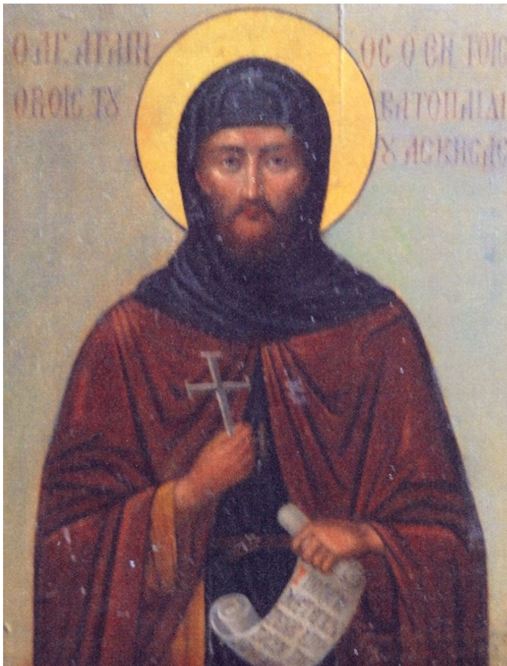
Ο Όσιος Αγάπιος ο Βατοπαιδινός ο ασκήσας εν τη Σκήτη της Κολιτσούς. Φορητή εικόνα Ιεράς Μονής Καρακάλλου (1943).

Ο όσιος Αγάπιος μόναζε με τον Γέροντα του στη Βατοπαιδινή Σκήτη της Κολιτσούς. Κατά τον Γεράσιμο Σμυρνάκη η περιοχή ονομάσθηκε έτσι από τον Γέροντα του οσίου Αγαπίου ησυχαστή Κολέτιο. Όταν κάποτε ο όσιος κατέβηκε στην παραλία για κάποια συγκεκριμένη εργασία, αιχμαλωτίσθηκε από πειρατές. Ο άγιος Νικόδημος ο Αγιορείτης αναφέρει πώς ήταν Σαρακηνοί και πώς ο όσιος τους μετέβαλε και βάπτισε. Άλλοι αναφέρουν πώς ήταν Αγαρηνοί και τον πούλησαν ως δούλο σε σκληρό Αγαρηνό, που τον κρατούσε δεμένο με αλυσίδες επί δώδεκα ολόκληρα χρόνια, χρησιμοποιώντας τον συγχρόνως σε σκληρές και βαρειές εργασίες. (περισσότερα...)