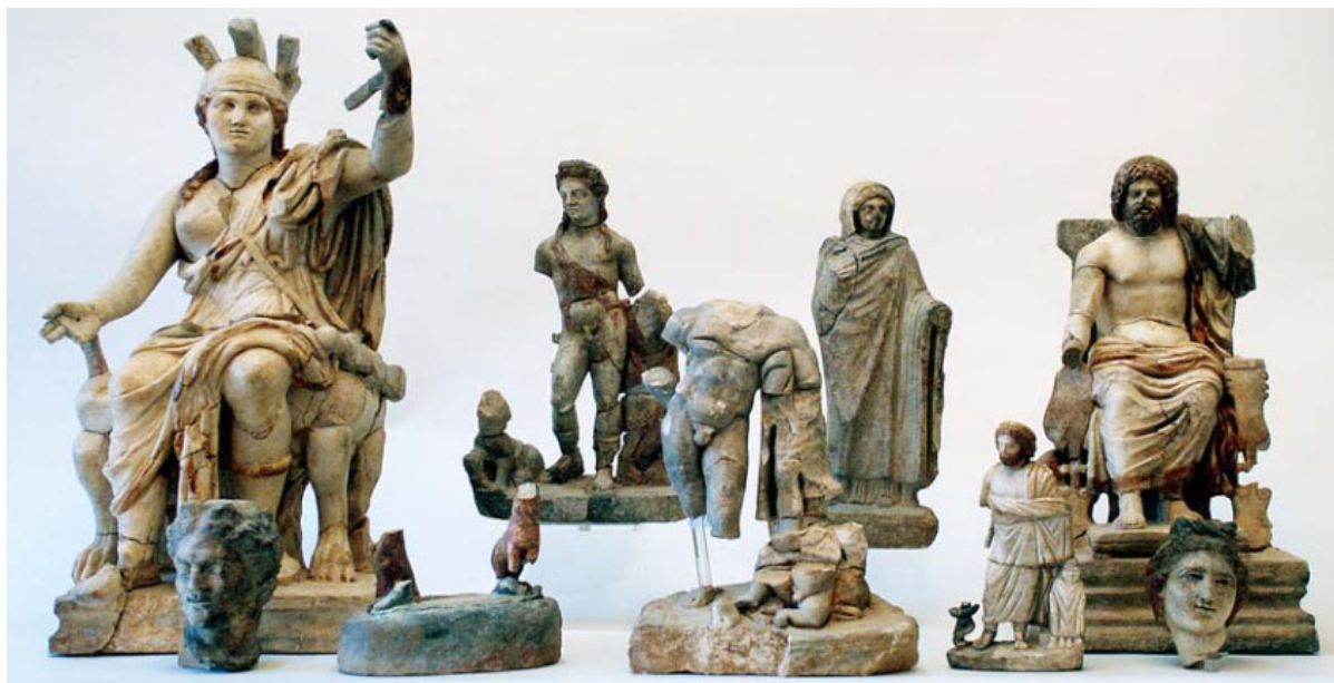
Επιχρυσωμένα μαρμάρινα αγαλμάτια μυθολογικών μορφών από οικία του 4ου αι. μ.Χ. στην περιοχή της Παναγίας στην αρχαία Κόρινθο.

Οι ανασκαφές στην Κόρινθο έχουν φέρει στο φως αρχαιολογικά ευρήματα που χρονολογούνται από τη Νεολιθική περίοδο ως την Οθωμανική εποχή. Τα τελευταία χρόνια έχει δοθεί ιδιαίτερη σημασία στην αποκάλυψη και μελέτη των μεσαιωνικών καταλοίπων. Επιπλέον, έχει δοθεί έμφαση στη μελέτη του αρχαιοβοτανολογικού και ανθρωπολογικού υλικού, με στόχο την ανασύσταση του φυσικού περιβάλλοντος και του πληθυσμού της Κορίνθου διά μέσου των αιώνων.