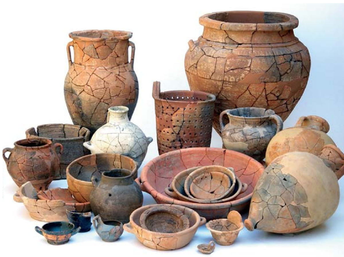
Κεραμική από τον Αζοριά Καβουσίου, Κρήτη.

Παρόλο που οι ανασκαφές στην Αρχαία Αγορά επικεντρώνονται στην κλασική αρχαιότητα, η Σχολή αναγνωρίζει ότι η ιστορία και ο πολιτισμός της Αθήνας εξακολουθούν αδιάκοπα έως σήμερα. Το ενδιαφέρον της για τα μνημεία της μεταγενέστερης Αθήνας έχει πιστοποιηθεί με πολλούς τρόπους, με προεξάρχουσα την ανακατασκευή της εκκλησίας των Αγίων Αποστόλων, στα νοτιοδυτικά της Στοάς του Αττάλου. Παράλληλα με τις ανασκαφές και τις εργασίες αποκατάστασης των μνημείων δόθηκε έμφαση στη δημιουργία ενός αρχαιολογικού πάρκου στο χώρο της αρχαίας Αγοράς, το οποίο κατέχει μια σημαντική θέση στην εικόνα και τη ζωή της σύγχρονης Αθήνας.