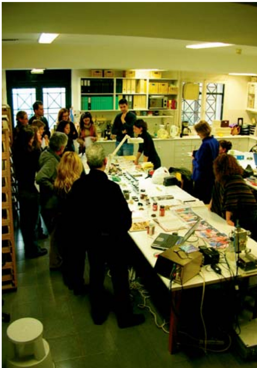
Το εργαστήριο Wiener.

Το Εργαστήριο Wiener περιλαμβάνει μια διαρκώς αναπτυσσόμενη επιστημονική βιβλιοθήκη που υποστηρίζει την έρευνα των μελών του Εργαστηρίου καθώς και άλλων μελετητών και ανασκαφών. Η βιβλιοθήκη του φιλοξενεί 26 περιοδικά και ενημερωτικά δελτία και περισσότερους από 1.150 τόμους, οι οποίοι περιλαμβάνουν διατριβές και μονογραφίες στους τομείς της οστεοαρχαιολογίας και της γεωαρχαιολογίας, καθώς και εκδόσεις γενικού ενδιαφέροντος για την αρχαιολογία και τις φυσικές επιστήμες. Η βιβλιοθήκη του δεν υποστηρίζει απλώς την έρευνα στο Εργαστήριο, αλλά λειτουργεί επίσης ως βάση για την ανάπτυξη διεπιστημονικών ερευνητικών προγραμμάτων.