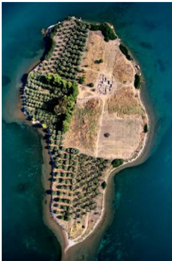
Η ανασκαφή στο Μήτρο Λοκρίδας.