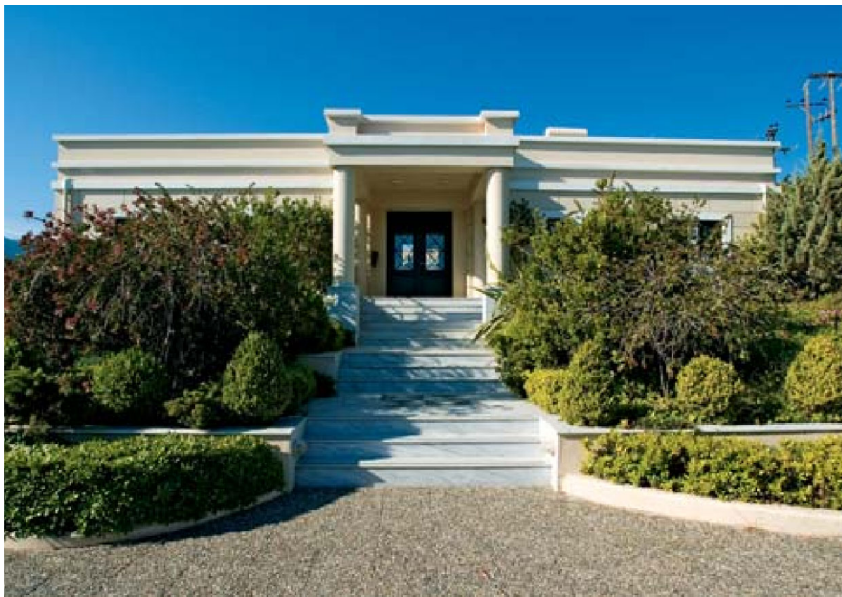
Κέντρο Μελέτης Ανατολικής Κρήτης, Παχειά Άμμος.

επιφανειακές έρευνες στη βόρεια Κέα, τη νότια Αργολίδα, την ανατολική Κρήτη, την κοιλάδα της Νεμέας, την ανατολική Κορινθία, τη νότια Ήπειρο και την περιοχή της Πύλου.